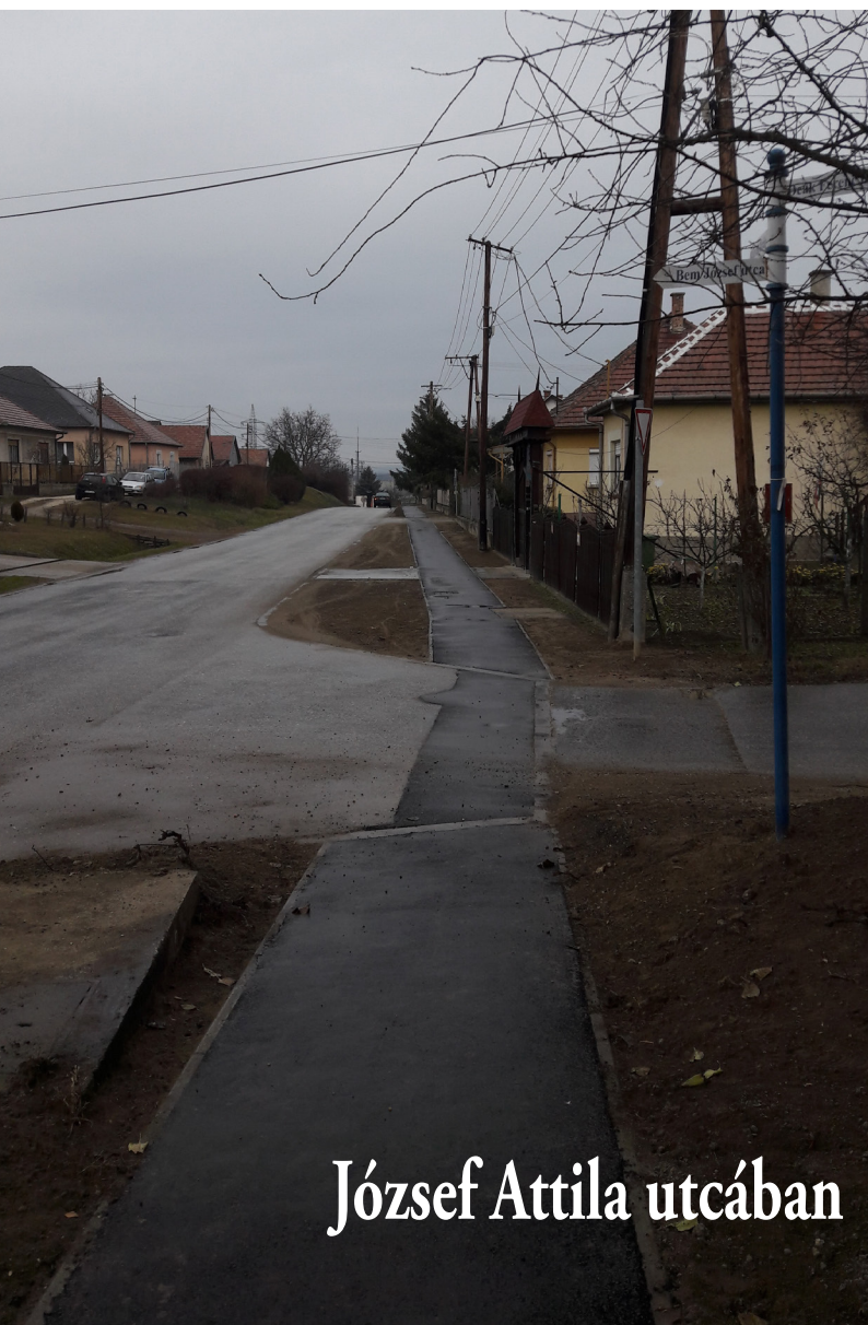
József Attila utcában