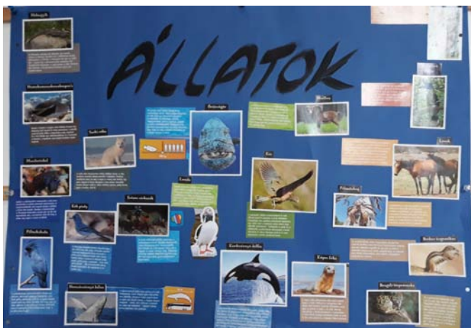
„Állatok világnapja” feladatból részlet 3. osztályos tanuló munkája

A bemutatott illusztrációk csak kis szeletei a megvalósult feladatoknak, alkalmanként az egyes projektek hosszabb lélegzetvételűek, esetleg egész iskolát érintő, nagyobb léptékű munkák részegységei. Ilyenek a jelenleg is folyamatban lévő, a környezetvédelem – fenntarthatóság témakörében tartott foglalkozások is.