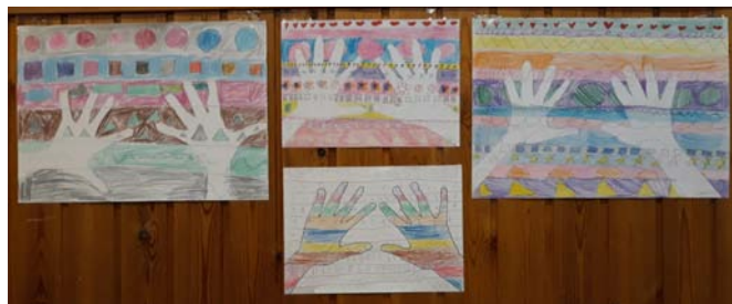
„Ritmus” – 2. osztály

A merőben új megközelítést igénylő, aktuális élethelyzet kihívásai közepette számos iskolai projektmunka született az elmúlt hónapokban is. A feladatok különböző területekről, témakörökből kerülnek a diákok elé, legyen szó egy jeles napról, megemlékezésről vagy egy izgalmas tananyag színes prezentálásáról. Az adott korosztály szintjén megfogalmazott témák feldolgozásában és megértésében a felkészítő tanárok igyekeznek útmutatóikkal a legkomplexebb megoldás felé terelni a vállalkozó szellemű alkotókat.