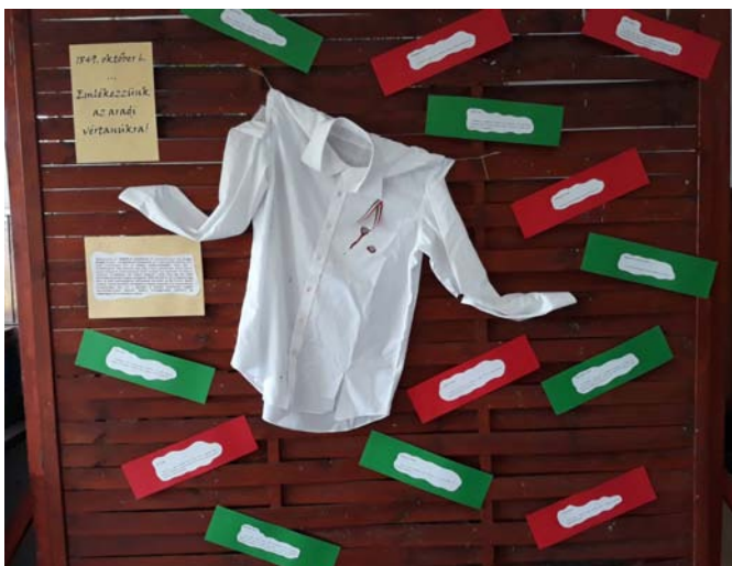
„Október 6-ai megemlékezés” feladatból részlet – 6. osztály