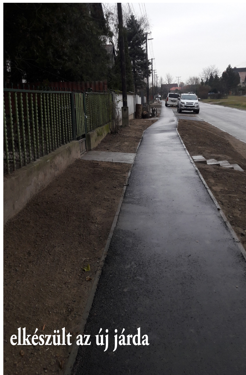
elkészült az új járda