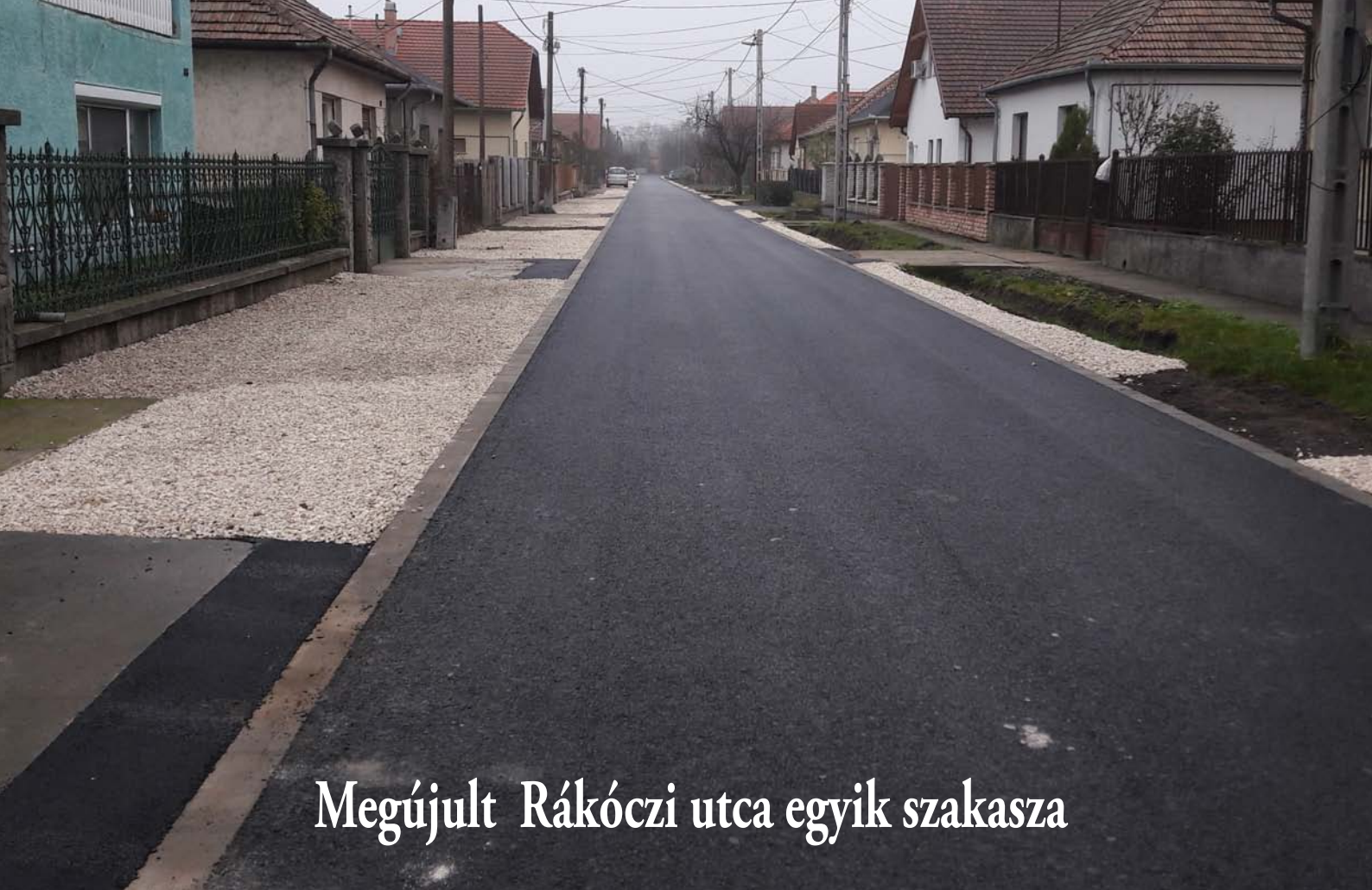
Megújult Rákóczi utca egyik szakasza