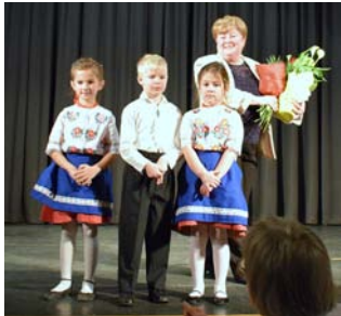
A vezető óvónőt óvodásai köszöntik

ló által játszott műremek, Márai költői módon megírt életnácainak gyűjteménye az emberről, hazáról, sorsról, művészetéről, a férfi és nő kapcsolataról. Az előadásban a Márai földrész tökéletesen megjelenik előttünk.