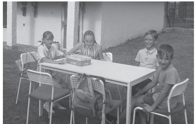
VASÁRNAPI ISKOLA 2020

Tervezünk hálaadó napot, gyülekezeti találkozót, szeptember elejétől újra indult a gyermekek számára a vasárnapi iskola a belülről megszépült épületben délelőtt 9.30-tól a Dózsa György út 62-ben, illetve annak kertjében.