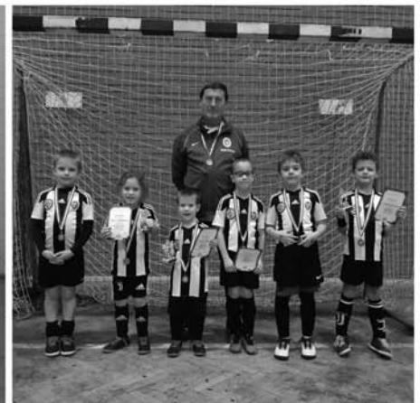
A 0. korcsoportos csapat