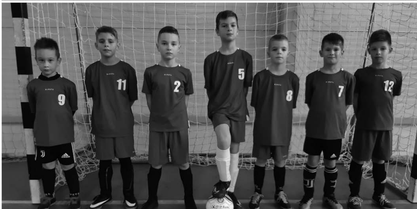
A DSE 1. és 2. korcsoportos Bozsik csapata