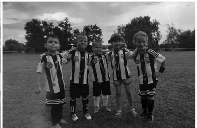
DSE kupa képekben