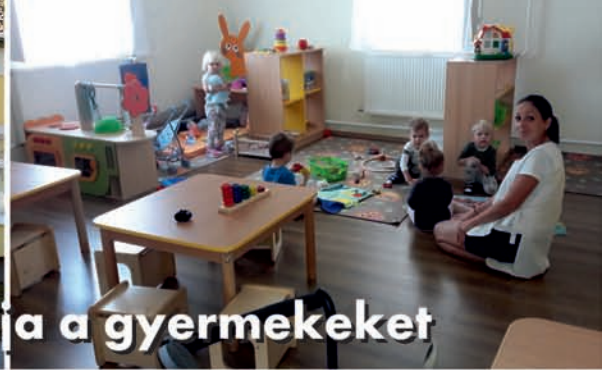
Az új bölcsőde szeptember 1-től várja a gyermekeket