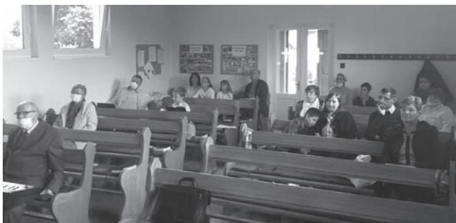
PÜNKÖSD 2020 ISTENTISZTELET

Idén március közepétől május végéig be volt zárva az imaházunk. Május végén fellélegeztünk, kitakarítottunk, és azt gondoltuk: vége, túl vagyunk rajta. Pünkösd óta ismét összejöhetünk ugyan, de valami mégis megváltozott: 65 év felettiek és krónikus betegek csak saját felelőségükre látogathatják az istentiszteleteket. Kézfertőtlenítés, maszk, védőtávolság. Nincs kézfogás, kevés az éneklés, rövidebbek az alkalmak. Tudomásul vesszük. Kevesebben jövünk össze. Ezt is tudomásul vesszük.