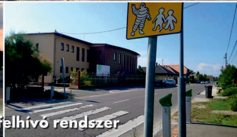
Működik a figyelemfelhívó rendszer