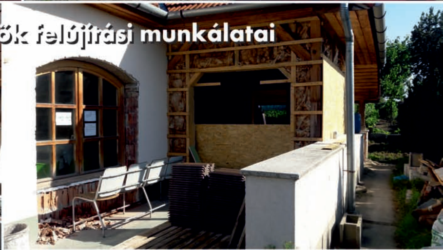
Védőnői rendelők felújítási munkálatai