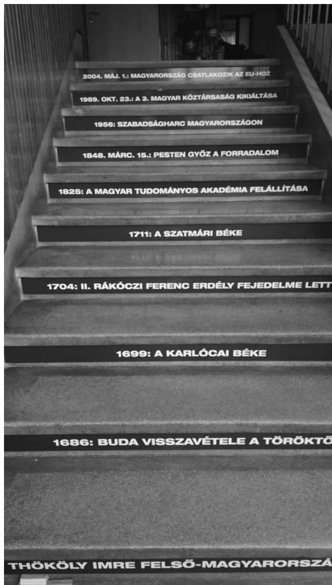
Iskolai lépcső dekorációja

Továbbra is arra szeretnénk bátorítani a kedves szülőket, tanárokat, gyerekeket, lakosokat, hogy keressenek minket kérdéseikkel, észrevételeikkel akár személyesen akár elérhetőségeink