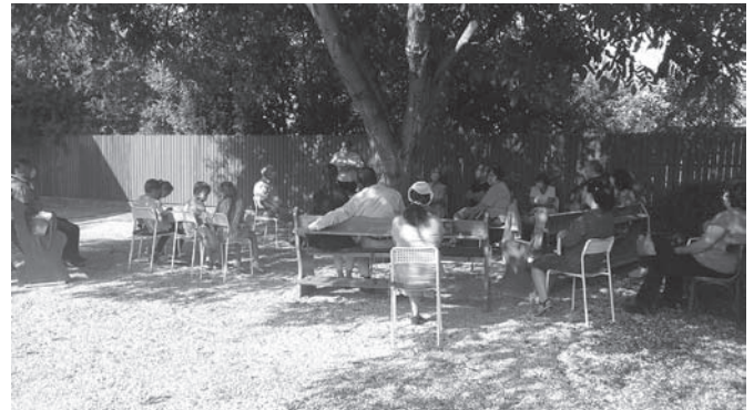
SZABADTÉRI ISTENTISZTELET 2020 ŐSZ

Hallunk ezekről, bizonyos eseményeket valóban át is élünk