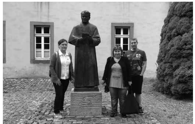
Steinfeld, Kis magyar küldöttségünk

2019. július 10. és 14-e között a németországi Horremben került sor az európai laikus szalvatoriánusok hetedik találkozására. Az eseményen belga, osztrák, lengyel, magyar, spanyol és német testvérek vettek részt. A találkozónak a szalvátor nővérek adtak otthont és a Horremben működő laikus csoport tagjai voltak a fő szervezők. A találkozó mottóját Apostolokról nevezett Boldog Mária anya, született Therese von Wuellenweber bárónő gondolata adta: "Kerestem és kerestem". Az idézet alapja, hogy Mária anya több szerzetesi közösségben is próbálta megtalálni saját hivatását, de örök fogadalmat sohasem tett. Neuwerkben Szent Borbála Intézet néven jótékonyági intézményt alapított, és kvázi-szerzetes életet élt. Miután 1882-ben elolvasta Jordan atya Társaságának ismertetését a „Misszionárius” lapjain, rájött, ezt kereste eddig, és azonnal felajánlotta szolgálatát. 1883-ban Jordan atya kezébe tette le örök fogadalmát. Mária anya később Jordan atya mellett a szalvatoriánus rend női ágának társalapí-