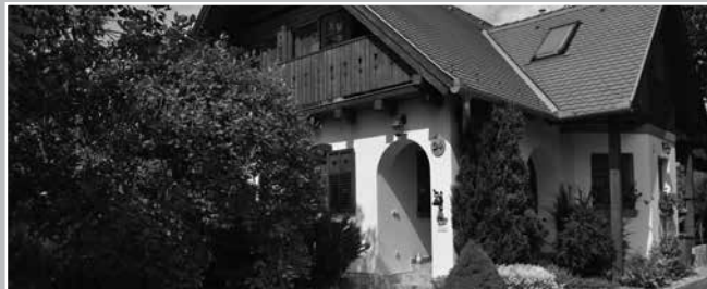
Hertel Gábor, Tabán utca