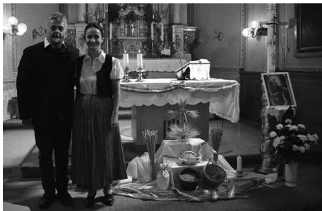
Buzogány Márta és Lázár Csaba színművészek