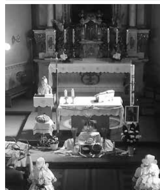
Varga Hédi szaval