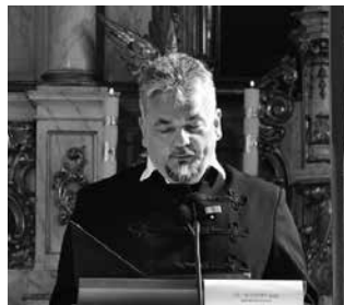
Lázár Csaba színművész

Ezen a csodás keddi napon, augusztus 20-án, megtartottuk államalapító Szent István királyunk és az új kenyér tiszteletére megrendezett községi ünnepségünket, a szödi Mária Magdolna római katolikus templomban. Az ünnepi