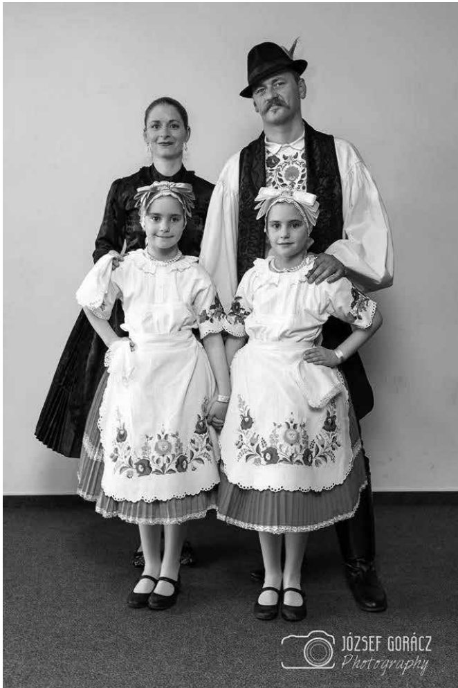
Onodi család, Országos Táncszínház Találkozó, Budapest – Kép: Gorács József