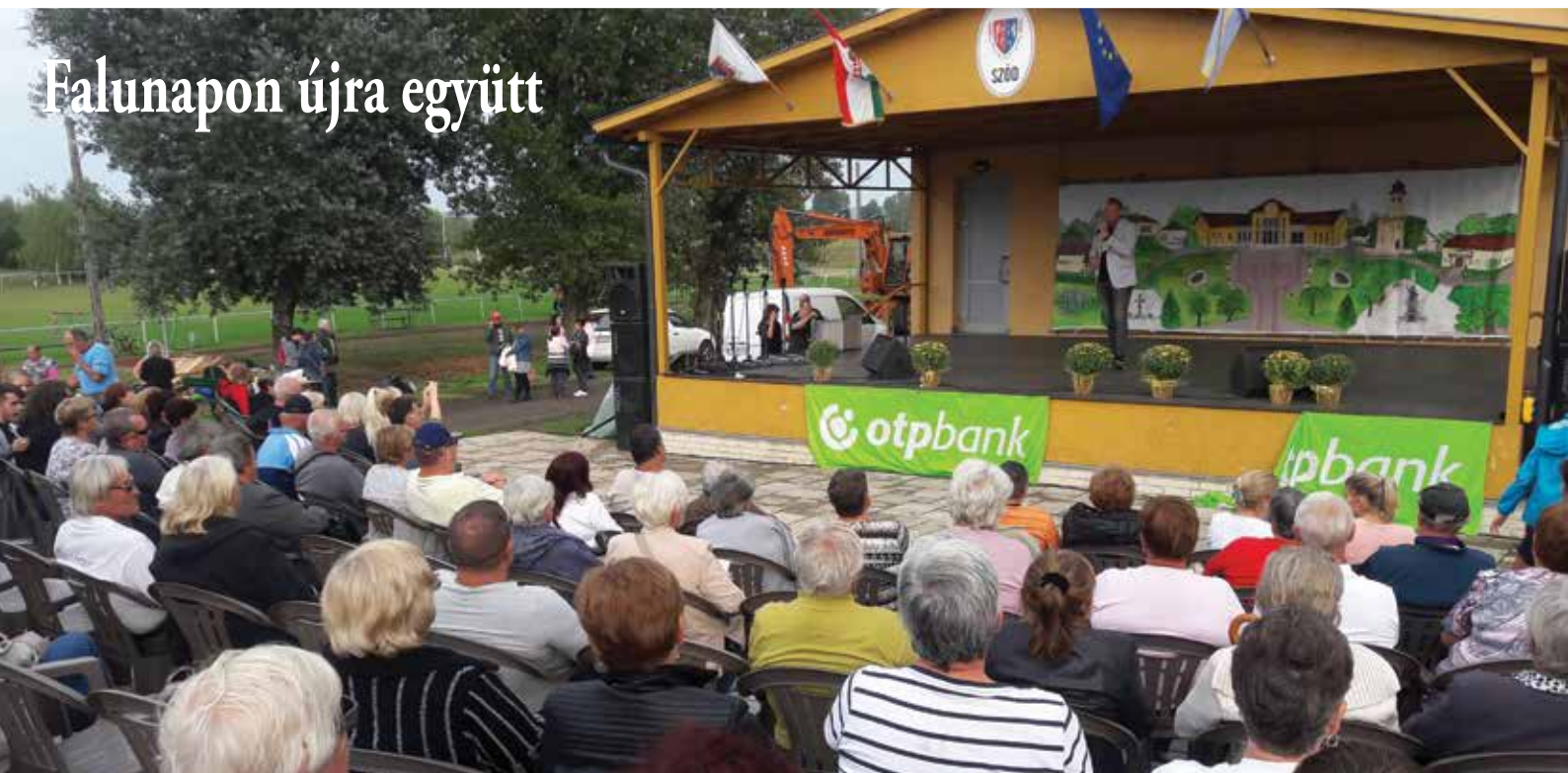
Falunapon újra együtt