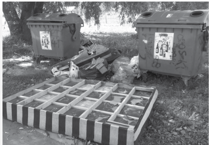
szelektív hulladékgyűjtő sziget

szes településén a Zöld Híd kénytelen volt megszüntetni a szelektívgyűjtő szigeteket, (és áttért a zsákos szelektívgyűjtésre) mivel ezek a szigetek nem rendeltetésszerűen működtek. Gondolom, sokan emlékeznek a Dózsa György út és a József Attila út sarkán lévő szelektív hulladékgyűjtő szigetre. Jelen pillanatban egyetlen egy szelektív hulladékgyűjtő szigetet tartottunk meg, mégpedig a szödi labdarúgópályánál, ahová a táblán jelzett üvegeket lehet elhelyezni. Azt hiszem erről nem kell sokat írnom, beszéljen az a kép, amelyet itt az újságban közzé teszek. Ezt az egy szigetet nem szeretnénk megszüntetni, ezért a jövőben a helyet telepített kamerával fogjuk figyelni.