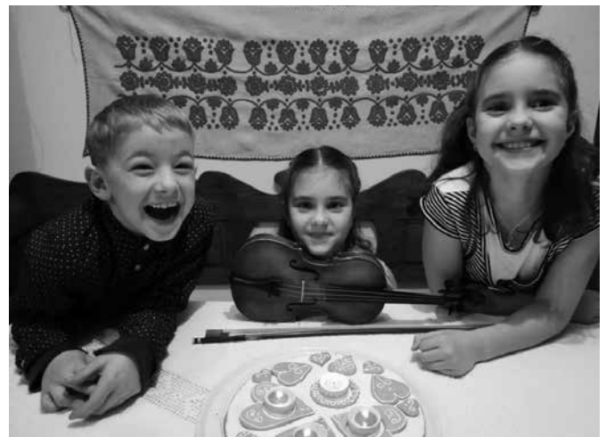
A gyerekek 2018 karácsonyán