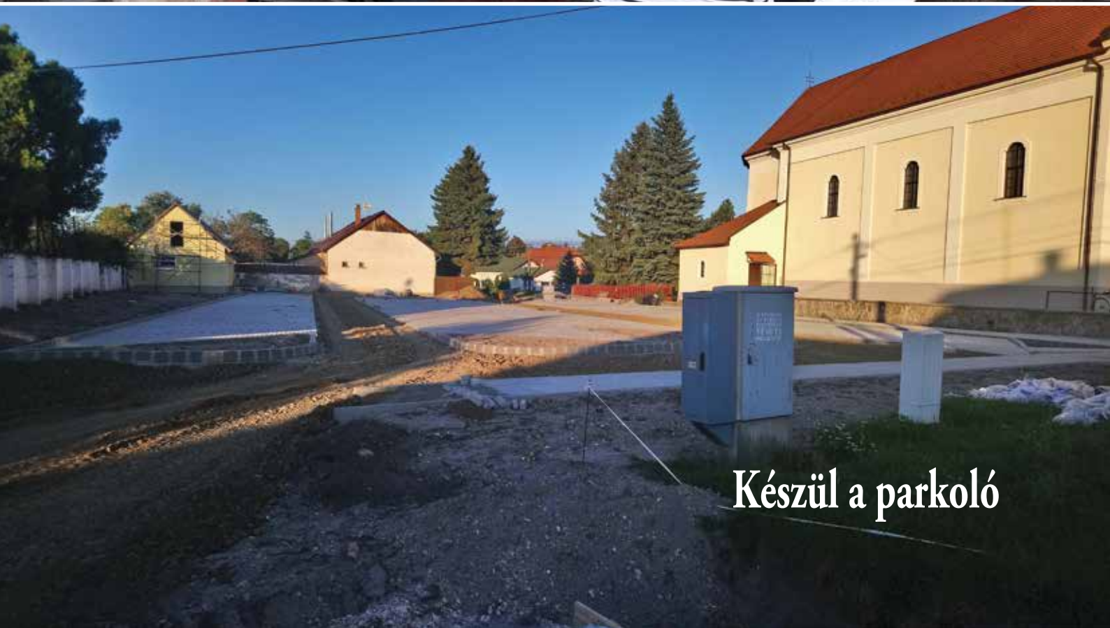
Készül a parkoló