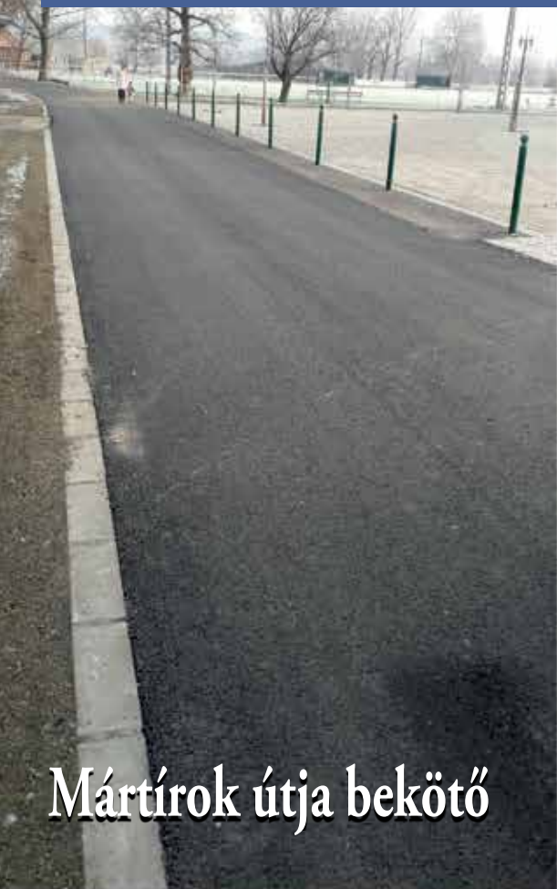
Mártírok útja bekötő

Ebben az évben az önerős beruházások értéke meghaladta a 80 millió forintot