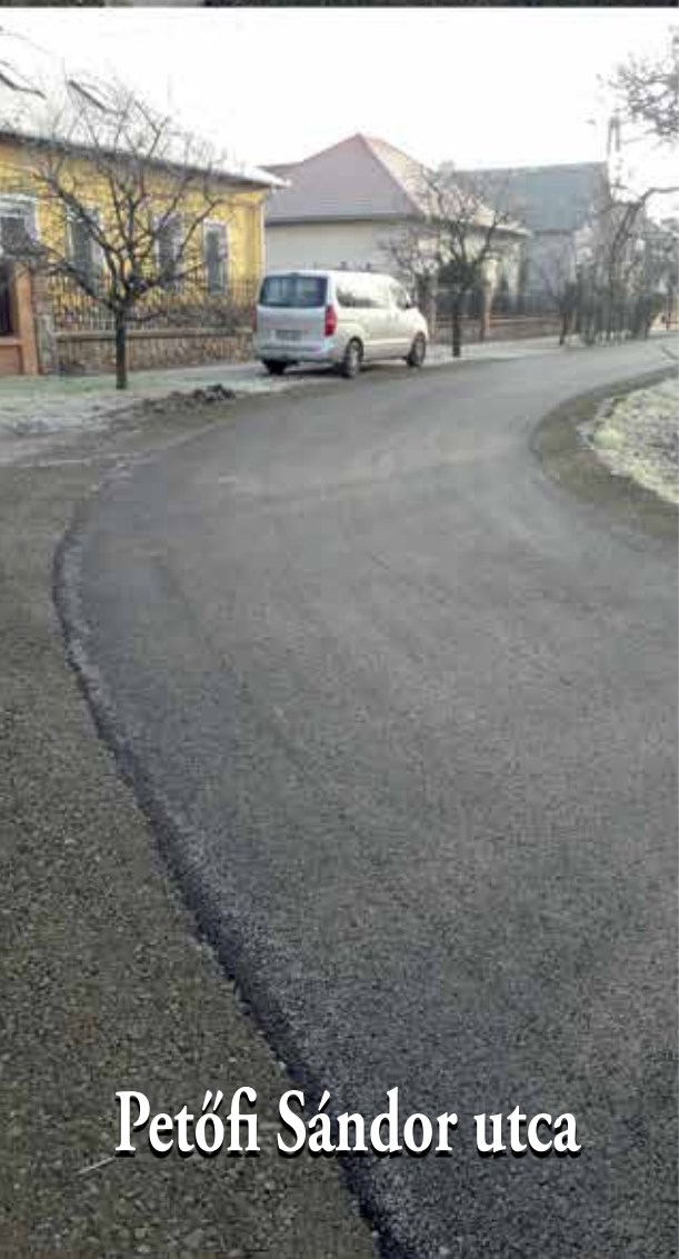
Petőfi Sándor utca