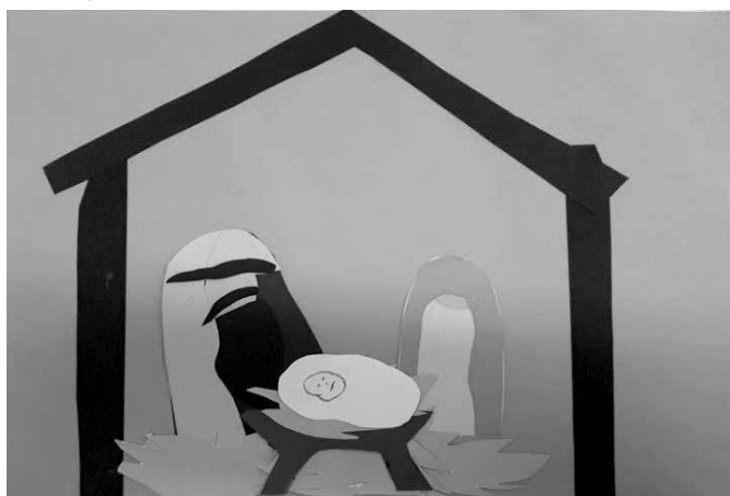
Horváth Arina Méhecske csoport 6 éves