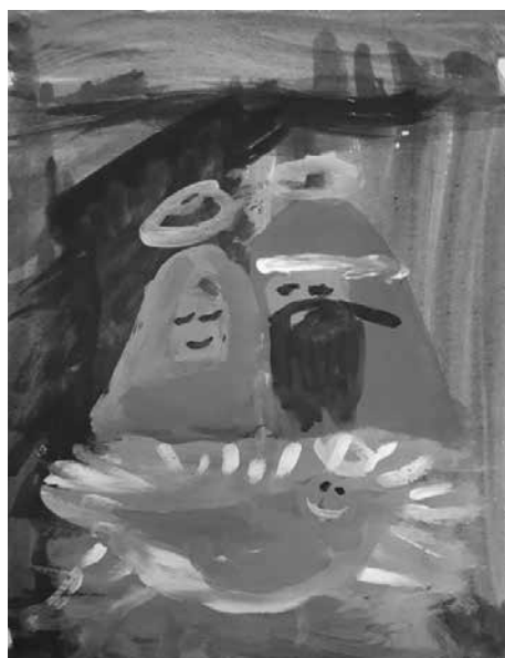
Szilas Anna Méhecske csoport 5 éves