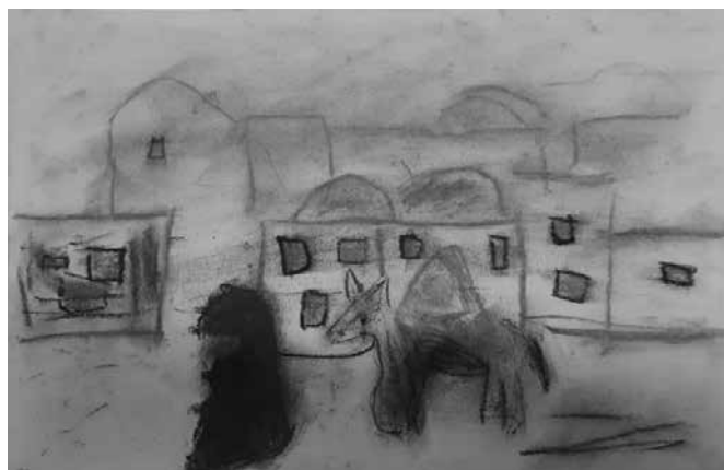
Kelemen Zselyke Méhecske csoport 5 éves