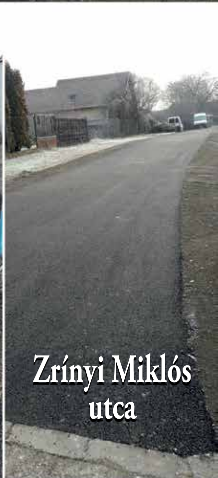
Zrínyi Miklós utca