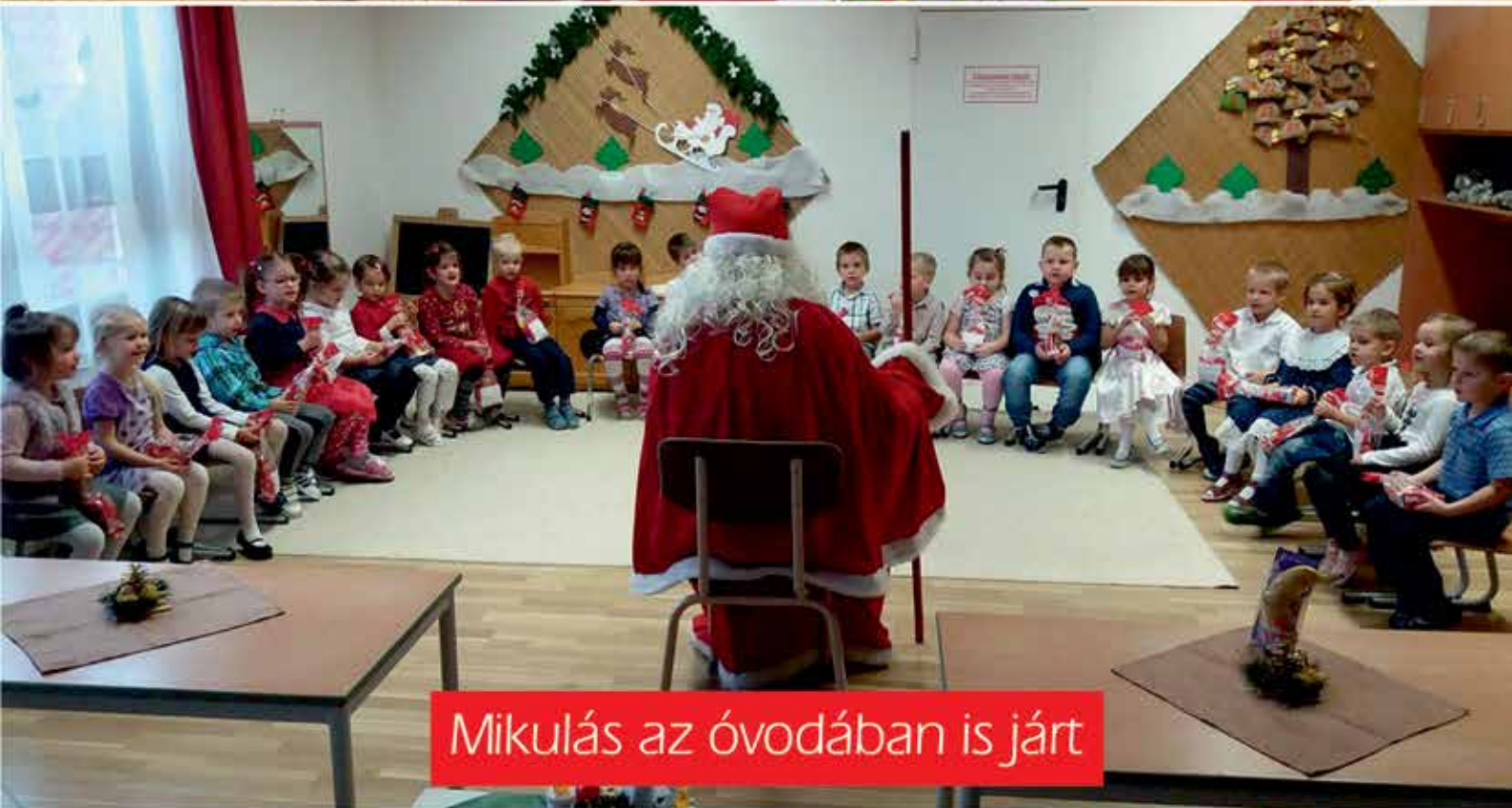
Mikulás az óvodában is járt