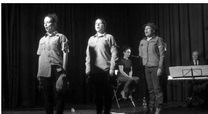
Szadai Színházikó csoport