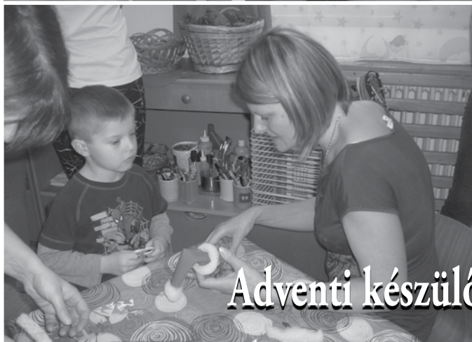
Adventi készülődés és nyílt nap