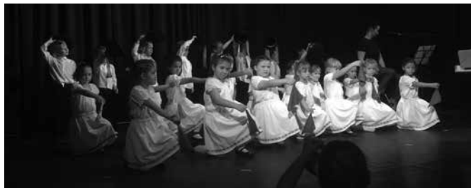
Ovisok az ünnepen

Vannak olyan együttlétek, amik nem kívánnak már különösebb utólagos értékelést, kritikát. Ilyen esemény volt ezen a csodálatos pénteki napon, amikor sok sződi gyermek, felnőtt, idős ember összegyűlt a sződi faluházban emlékezni. Emlékezni úgy, hogy az méltó legyen 56-os hőseinkhez. Ezer köszönet a fellépőknek és ezer köszönet azoknak akik bár kihagyták ezt a csodálatos alkalmat, jövőre megtisztelik a magyar történelmet jelenlétükkel.