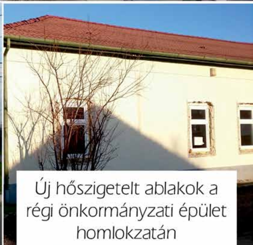
Új hőszigetelt ablakok a régi önkormányzati épület homlokzatán