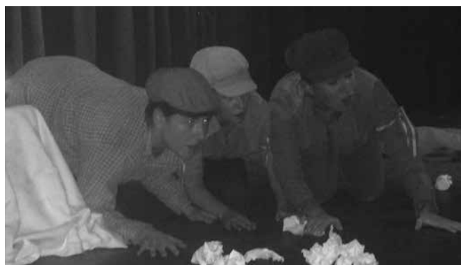
Szadai Színházikó csoport