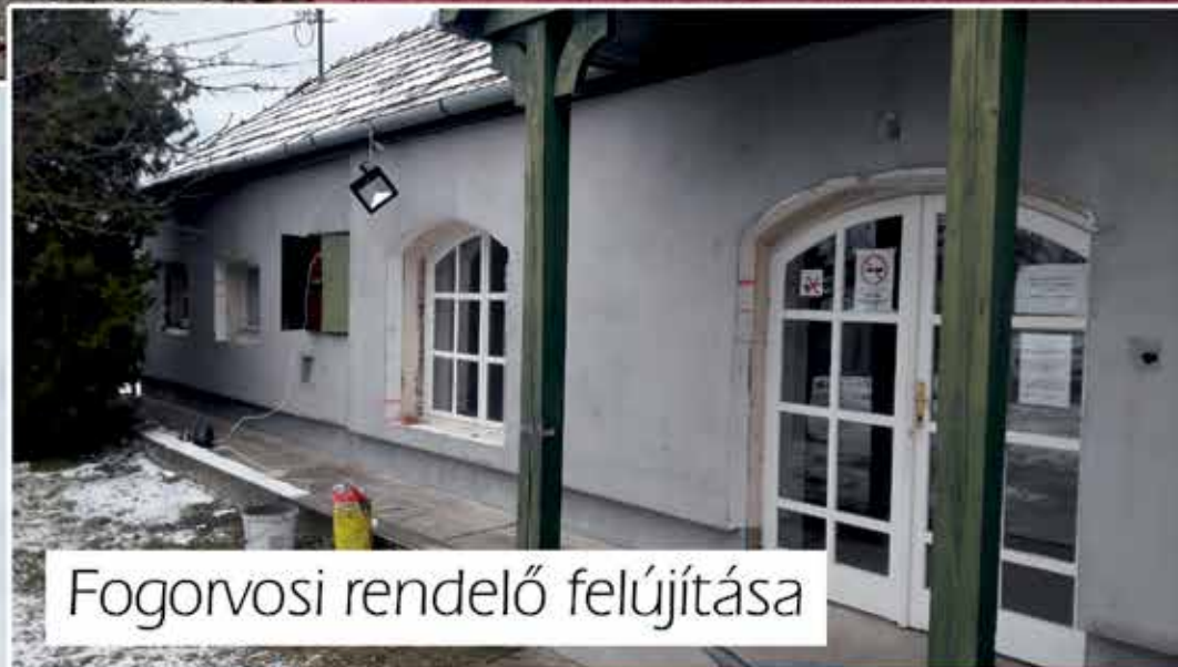
Fogorvosi rendelő felújítása