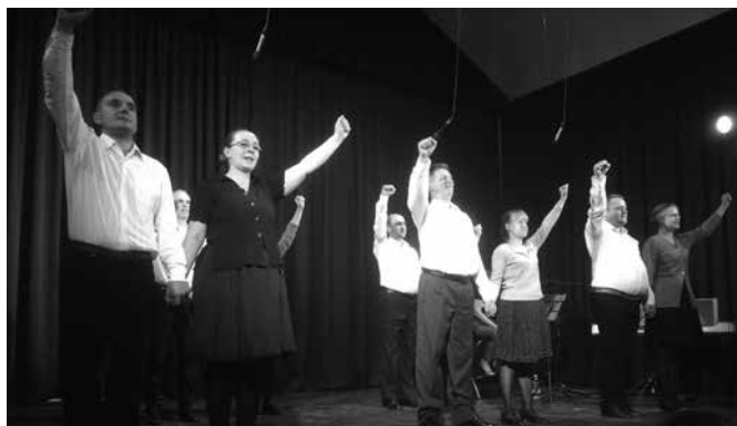
Szabadtánc együttes 56-os fellépése