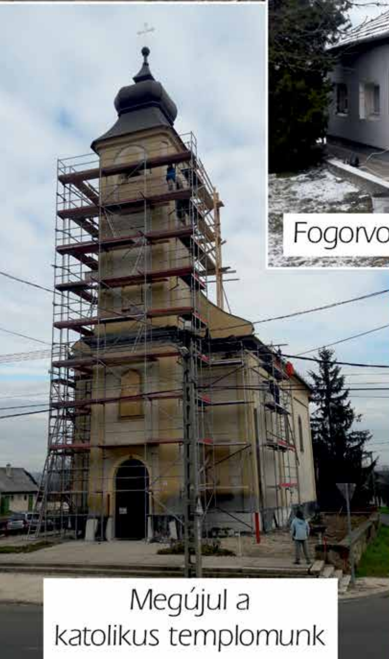
Megújul a katolikus templomunk