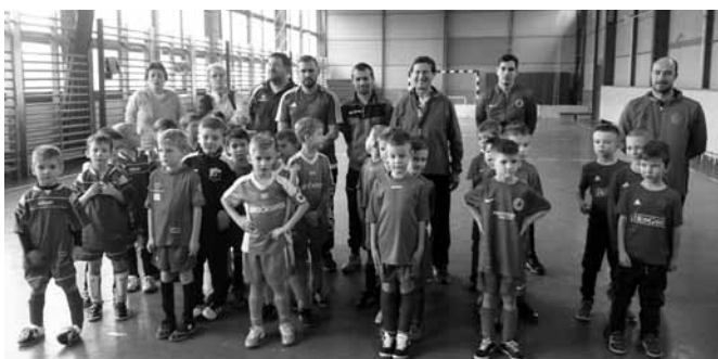
Mikulás Kupa, Szód

Végeredmény: 1. Szódi DSE 2. Órbottyán 3. Vácrátót 4. Vácduka 5. Kosd Utánpótlás bajnokság