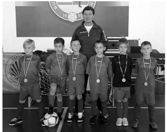
Dunakanyar Kupa, Budakalász

Mikulás Kupa Tizennyolc csapat részvételével szerveztük meg a hagyományos évzáró szódi teremlabdarúgó tornát. A hazai pálya nem adott erőt a csapatnak, hullámozó játékot produkáltunk és nem úgy alakult a szereplésünk ahogyan azt szeretnénk volna.. Eredmények: Szód - III. Ker. TVE Bp.8 : 1 Szód - Gödöllő 2. 1 : 3