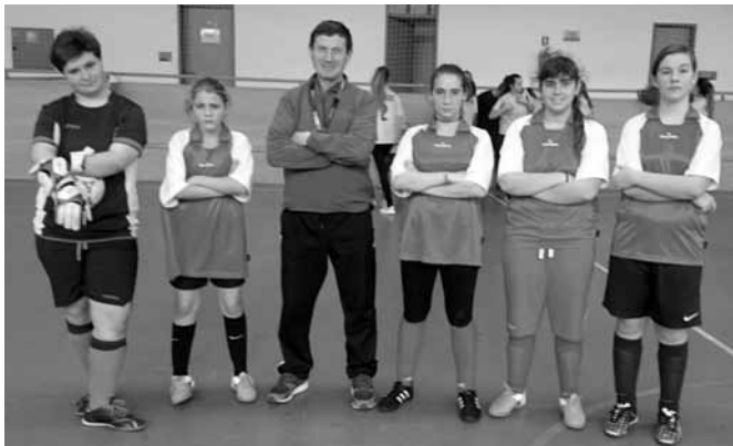
Bozsik teremlabdarúgás Vácrátót

Bozsik teremlabdarúgás, Vácrátóti Sportcsarnok Lányok I. forduló Nagyszerű játékkal rukkolt elő leány csapatunk az első meccsen, sajnos a második csatában elfáradtunk és lemaradtunk az első helyről. Szód - Verőce 5 : 2