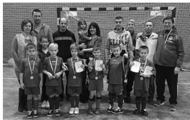
Újévi Kupa, Vecsés