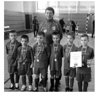
RAFC Kupa, Rákosszentmihály