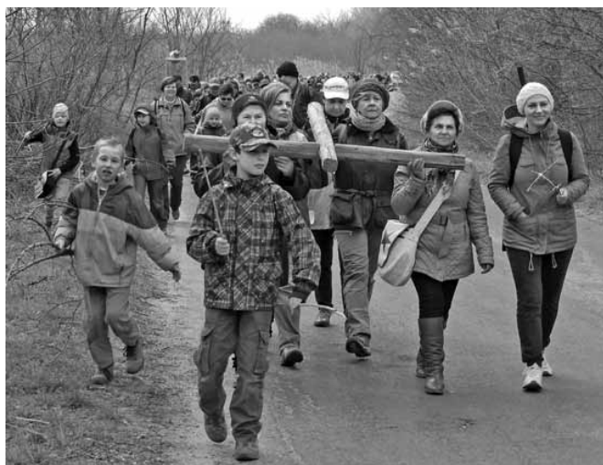
Mert úton vagyunk. Hazafelé. A mennyország felé...

Legyünk minél többen, tegyünk tanúságot hitünkéről és elköteleződésünkről.