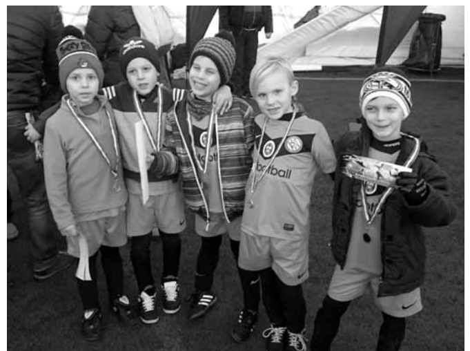
The Ground Kupa, Gödöllő

Eredmények: Csoportmérkőzések: Szód - Vasas 3 : 3 Szód - Tura 8 : 4 Szód - Honvéd 6 : 3 Szód - Dunakeszi VSE 1 : 3 Szód - Gödöllő 1. 3 : 8 Helyosztó mérkőzések: Szód - Gödöllő 3. 4 : 1 Szód - Vasas 3 : 5 Gólszerzők: Nagyszücs 13 ,