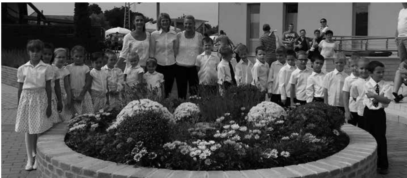
A falunapi fellépés előtt