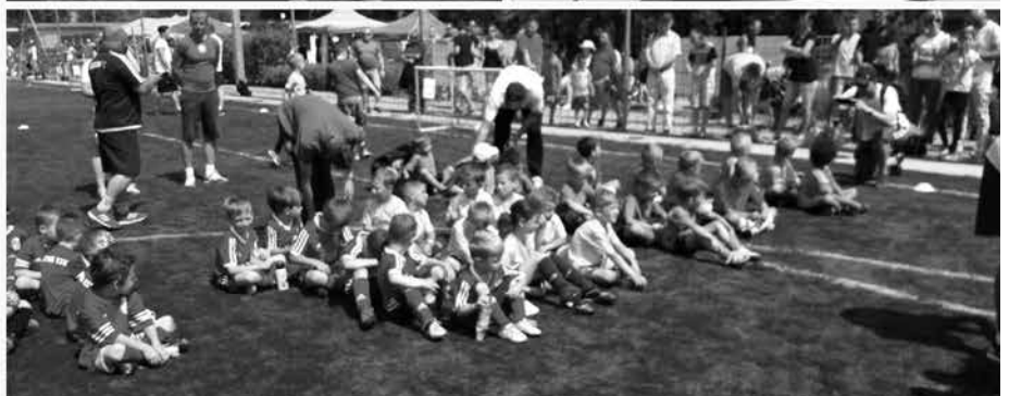
Az arany- és a bronzérmes U7- es és U6- os gárda