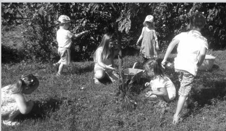
Hamvas szilva hull a földre