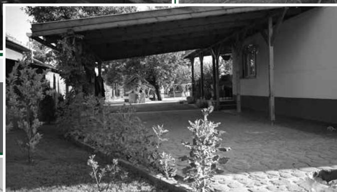
Tajti Gyula, Árpád út 18.