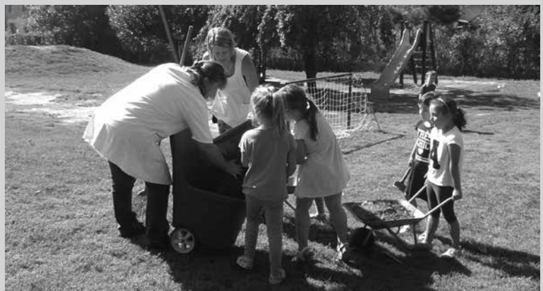
Amíg várjuk a pályázat elbírálását