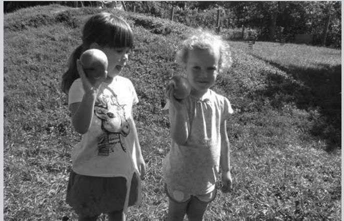
Alma, alma, piros alma