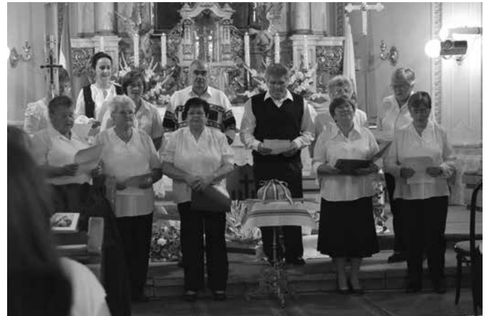
Ünnepi előadás a szódi templomban

wak SDS plébános úr celebrált sor az ünnepi műsorra, majd a kenyérszentelésre, a kenyér felszelésére.