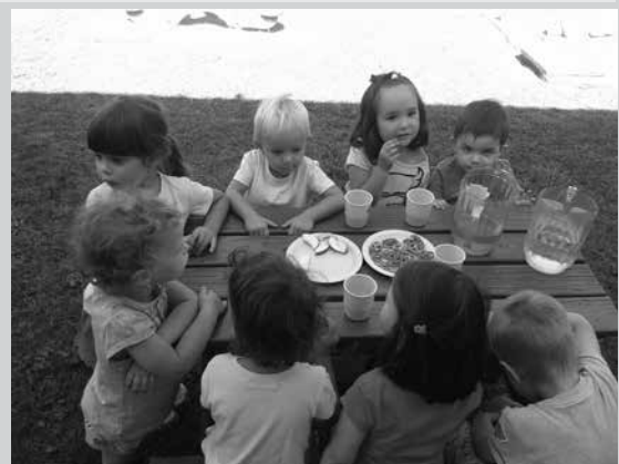
Nyuszi csoportosok lettünk