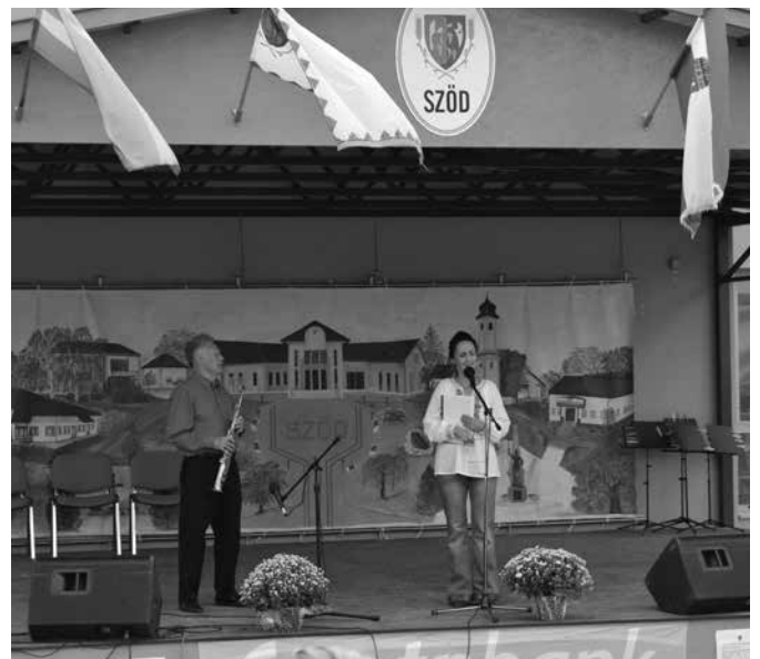
Dallal nyitjuk meg a Falunapot