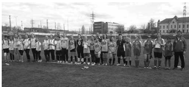
Az iskola leánycsapatának minden idők legjobb eredménye ( a csapat pirosban)

Váci Reménység Megyei elődöntő bajnokság, lányok III- IV. korcsoport Nagyon készültünk, nagyon akartunk, mindvégig vezet- tünk, aztán elfáradtunk és ki-