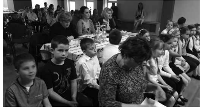
Szaválás előtti izgalom