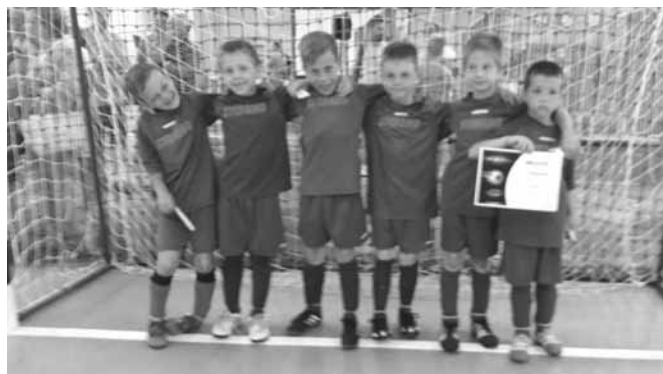
az U7-es csapat