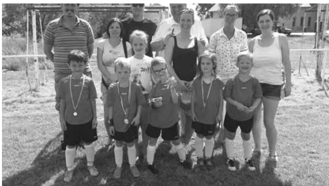
Pünkösdi ünnepi óvodás örömfoci Sződön

A kánikulai meleg ellenére huszoneköt csapat Bp. Hidegkút SC, Visegrád SE, Szódi DSE1., Puma Bp., Újlengyeli DSE, Bp. Kelen SC, Szódi DSE2., Újpest FC, Gödi MFS, Bp. Budatétény SE, Mogyoród FC, Bp. Kőbánya, Bp. MFS, Dunakeszi VS, Taksony SE, Eger Plútó és Erdőkertes SE vett részt a hagyományos szódi pünkösdi ünnepi U6- os és U7- es labdarúgó tornán.