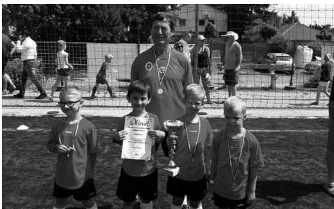
U6 Az ezüstérmes csapat