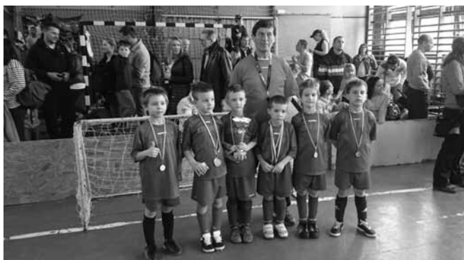
az U7- es csapat

Az U6-os csapat több hiányzó játékost kellett nélkülözönni, de a jelenlévő játékosok nagy küzdelmet vívtak az ellenféllel.