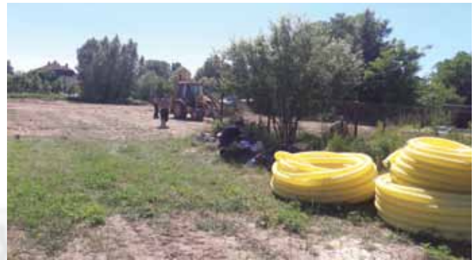
Készül a műfüves pálya

tív támogatások év közbeni növekedése, mely ugyanilyen mértékben növelte a kiadási oldalt is. A bevétel és a kiadás közötti plusz többletet elsősorban az eredményezte, hogy önkormányzatunk sikeres üzleti tevékenységet folytatott, takarékosan gazdálkodott. Másodsorban pedig, hogy a pályázaton elnyert fejlesztési beruházások megvalósulása áthúzódott 2017. évre, melynek eredményeképp a kiadások 2016. évben nem jelentek meg.