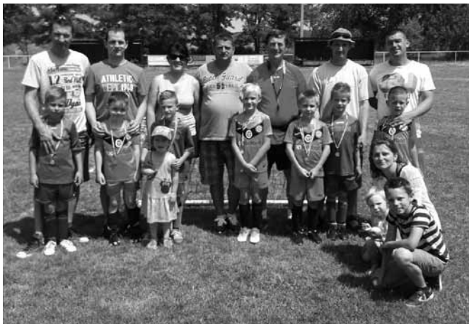
Pünkösdi ünnepi óvodás örömfoci Sződön

Szöd- Hírös 4: 1 Szöd- Monor 2: 3 Gólszerzők: Garaba 4, illetve Bugyi és Demeter 1- 1 Rangsor: 1. MFS1., 2. FTC, 3. MFS2., 4. Soroksár, 5. Monor, 6. Szöd- Dunakanyar , 7. Kecskemét, 8. Gödöllő