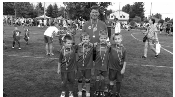
U7 20 csapat, hét meccs, öt győzelem és két vereség

Remek formában, igazi csapatként izgalmas, agresszív, látványos, támadó futballt játszottunk. Nagyon sokat tet-