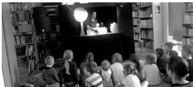
Bábszínház a szódi könyvtárban

Május 12-én pénteken, a Pest Megyei Könyvtár és a Szódi Könyvtár összefogásával, bemutattuk „Holle anyó meséjét”, a Fabula színház művészeivel. Vendégeink a könyvtárban a szódi óvoda nagy-középső csoportosai voltak. Remekül szórakoztunk. Köszönjük Pest Megyei Könyvtár!