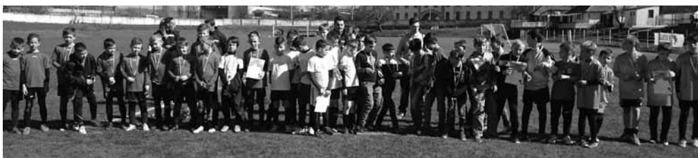
A bronzérmes II. korcsoportos csapat