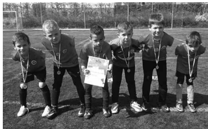
A fiúk az első helyen végeztek

Szöd - Vác Árpád 3: 6 Szöd - Kartal 3: 2