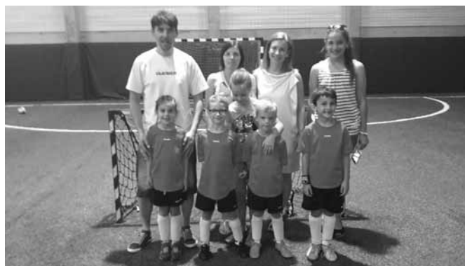
U6- os csapat és a szurkoló szülők

mi irányítottuk a játékot sajnos a legnagyobb helyzeteket elpuskáztuk.