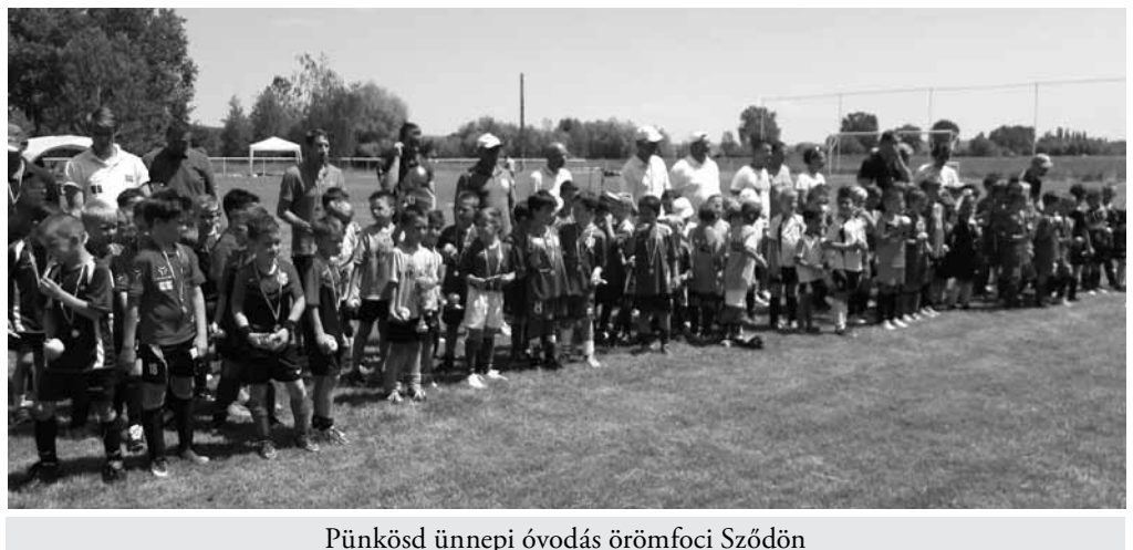
Pünkösdi ünnepi óvodás örömfoci Sződön

Göd, 12. Újpest, 13. Taksony, 14. Hidegkút, 15. Kelen, 16.