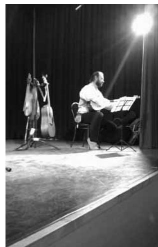
Heinczinger Miklós fényében

Arany János születésének 200. évfordulójára emlékezünk, március 10-én, pénteken. Kétszáz éve 1817. március 2-án született Nagyszalontán Arany János, a 19. század magyar költészetének központi alakja, a magyar nyelv máig utolérhetetlen mestere. A jubileum alkalmából március 2-án kezdődött az Arany János emlékév.