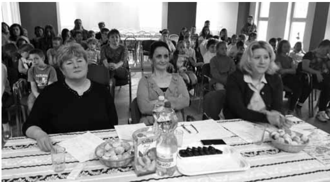
Költészet napi zsűrizés

A Szódi Faluház hagyományosan, minden évben megünnepli a Magyar Költészet Napját. Idén sem volt másképp, a szódi Cs-