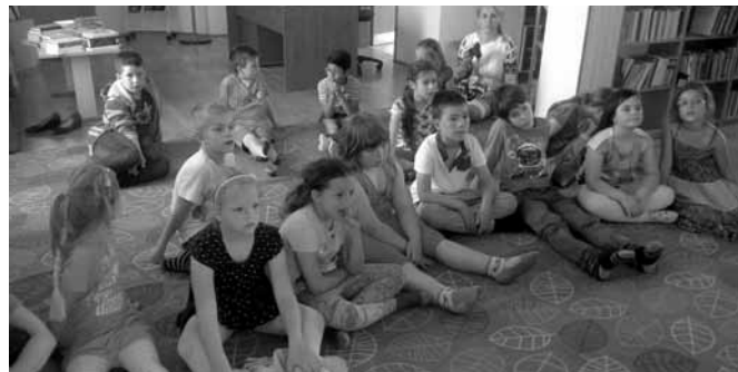
Újabb rendezvény a könyvtárban, a mai napon az iskola egyik 1. osztályát láttuk vendégül.

A 12-i eseményhez hasonlóan, ugyancsak a Pest Megyei Könyvtárral összefogva, Papírszínház program volt a könyvtárban. Ezúttal a Hunyadi János Iskola alsós tanulói voltak vendégeink. Köszönjük szépen az élményt!