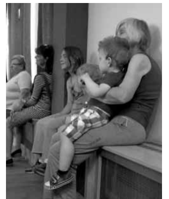
A legkisebb érdeklődő