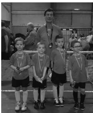
az U6- os csapat