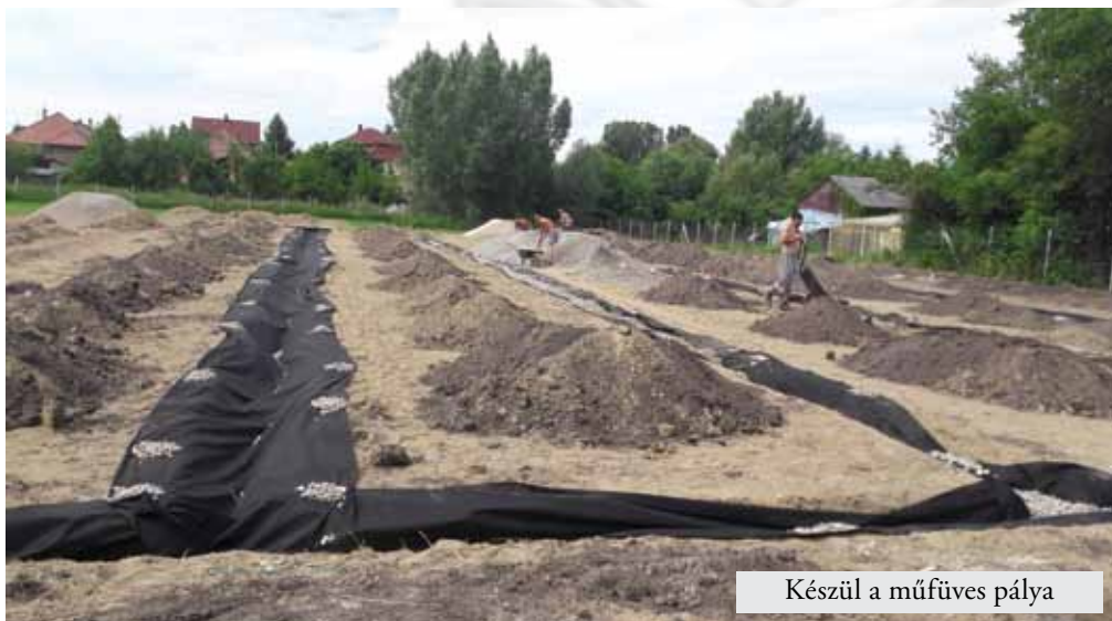
Készül a műfüves pálya

Szöd Község képviselő-testülete úgy döntött, hogy a régi csirketelep mellett lakók rossz közlekedési helyzetén javítani kíván. Ennek érdekében a Rátóti úton, a volt csirketelep bejáratáig tartó aszfaltutat tovább építi Vácrátót közigazgatási határáig. Mivel a volt csirketelep bejáratától a közigazgatási határig rendkívül rossz minőségű földút van, ennek az útnak új alapot építünk, szikkasztóárokokkal megoldjuk az út vízelvezetését, és márt aszfaltburkolattal látjuk el.