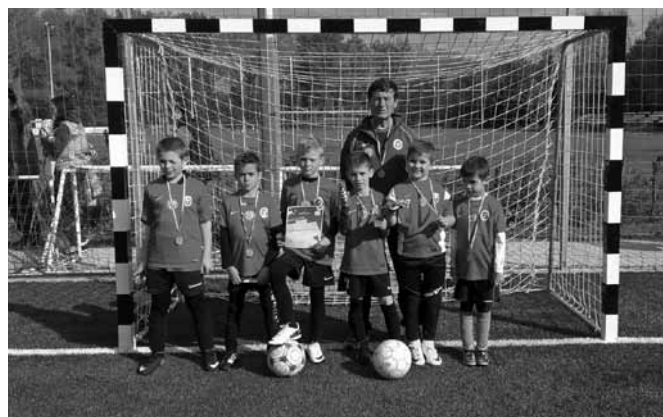
A Szódi Hunyadi János Általános Iskola minden idők legjobb labdarúgó eredménye

dolgozott támadójátékkal csapott le az ellenfélre a jól felállított csapat. Eredményes és fel-emelő volt számunkra a szódi eredmény, amelyet vastapsal jutalmaztak a szurkoló szülők.