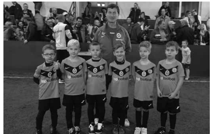
Az U7- es csapat

Főnix Kupa, Székesfehérvár Kettőzött erővel készültünk a rangos székesfehérvári teremlabdarúgó tornára. Erős vetélytársakkal szálltunk szembe, ismert és új csapattal csaptunk össze, hullámzó játékot produ-