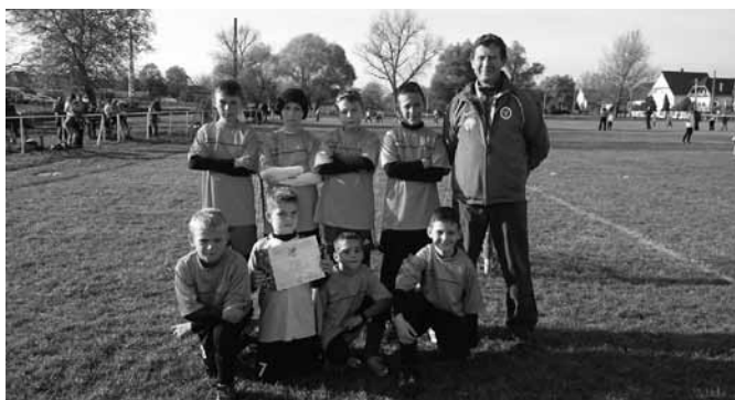
A dobogós II. korcsoport

Eredményes futballt produkált az I., II., IV. korcsoportos leány, valamint a II. korcsoportos futball csapatunk a Vác vonzáskörzeti bajnokságon. Az aranyéremért csatáztak, mindvégig fényben voltak, kontrákra rendezkedtek be és a védelem stabil lábakon állt, megérdemelten jutottak tovább a versenyben.