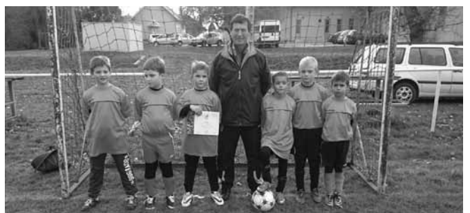
A győztes I.korcsoport