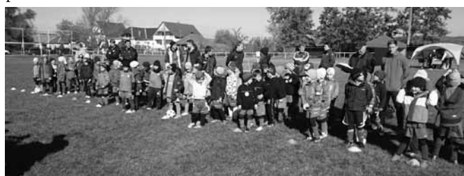
Sokan jöttek az ünnepi tornára

U7- es eredmények: Szöd – Visegrád 0 : 4 Szöd – Mogyoród 3 : 1 Szöd – Göd 1 : 2 Szöd – Monor 3 : 3