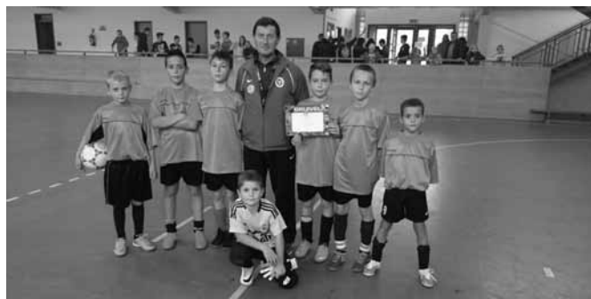
A gárda a megyei elődöntőt fogja játszani a Vácraóti Sportcsarnokban