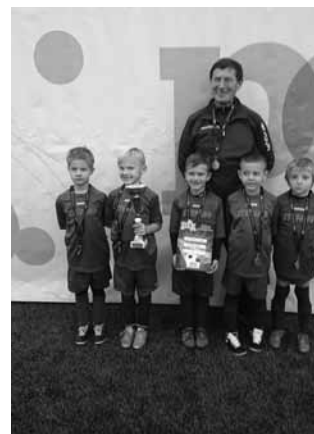
Az ezüstérmes csapat

patot alkotott a gárda, a mi támadójátékunk volt az erősebb, már a saját térfelükön letámadtuk az ellenfelet, nem hagytuk, hogy náluk legyen a labda, hogy közelünkbe passzolgassanak, csak a Fradi tudott legyőzni és így lettünk ezüstérmesek. A sok lelkes sződi szülő is megtette a magáét, mindvégig hangosan és bekiabálásokkal buzdították a sráccokat.