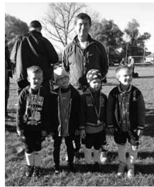
az U6- os