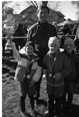
U7- es csapat

Októberben állandóan esett az eső, végre az ünnepi napon kisütött a nap és csodálatos őszi időben tudtuk levelezni a hagyományos tornánkat. A sok illusztris csapat közt nyerni akartunk, de sajnos nem jött össze,