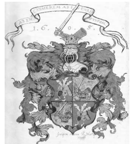
Wathay Ferenc illusztrációi Énekes Könyvéből 1605.