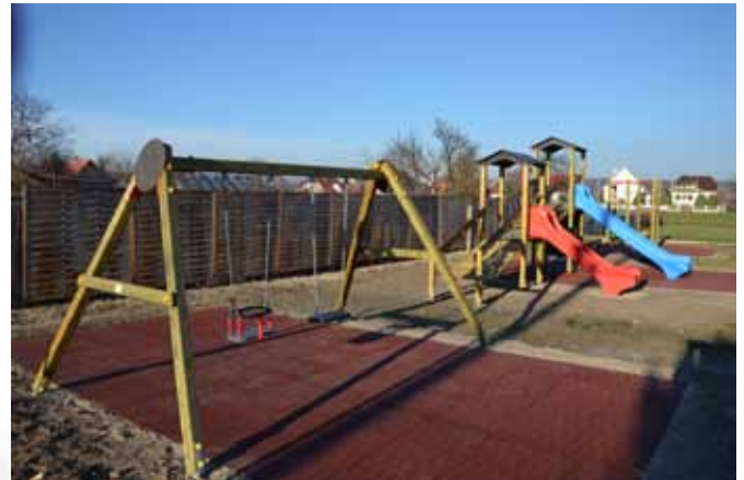
Az elkészült játszótér tavasszal kerül átadásra

nek eredményeként a 125 millió forintos beruházásból 118 millió forint uniós támogatást nyertünk el.