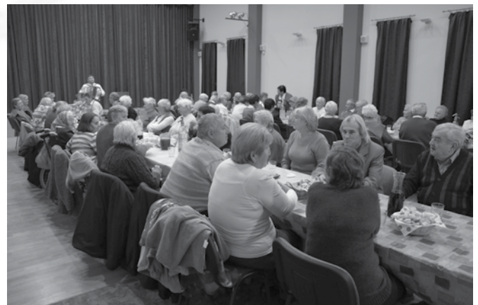
Együtt mulattak a szépkorúak

A rendezvényeink színvonalas és sikeres megtartásában nagy segítségünkre voltak szponzoraink, akik felajánlásukkal támogatták önkormányzatunkat.