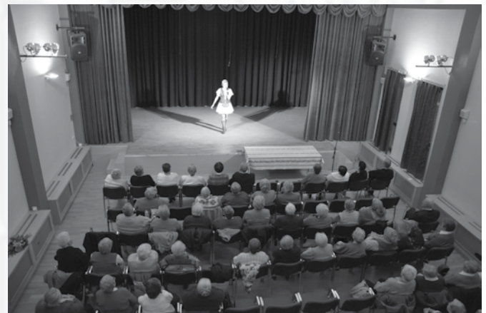
Az idősek napi ünnepség operett-előadással vette kezdetét

A képviselő-testület nagy gondot fordított arra, hogy az elmúlt évek sikeres önkormányzati rendezvényeinek megtartásához megfelelő pénzügyi fedezetet biztosítson a 2013. évi költségvetésben.