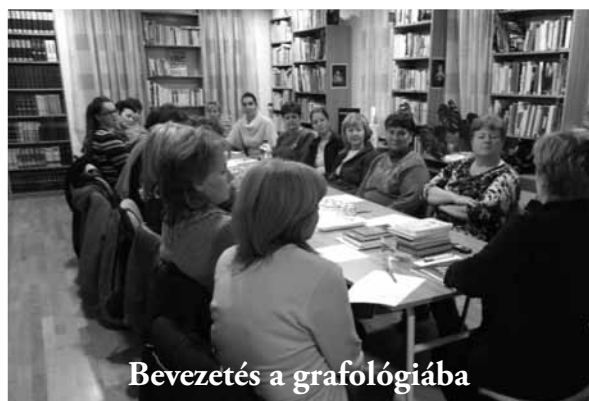
Bevezetés a grafológiába