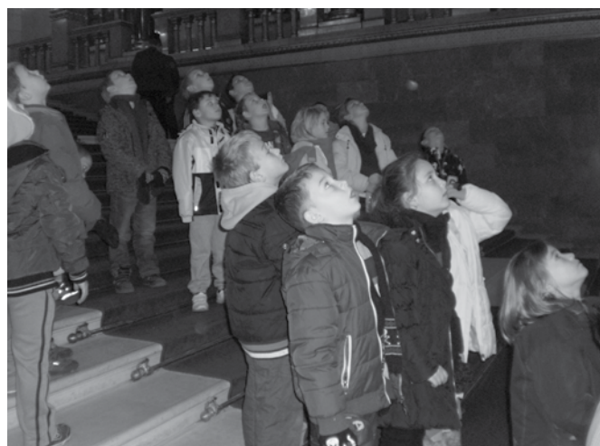
Látogatás a parlamentben