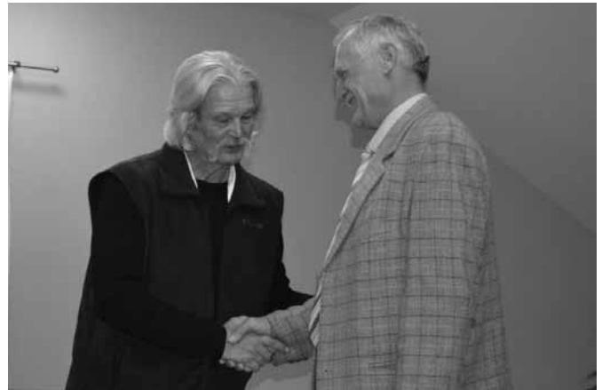
Egy nagyszerű előadás záróakkordja a köszönet