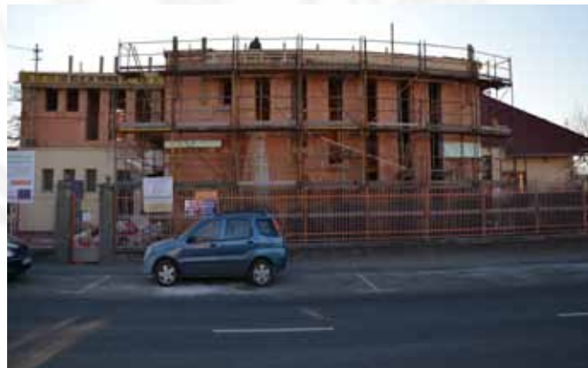
Jó ütemben halad az óvodabővítés

Az első alkalommal elutasított óvodabővítésre benyújtott pályázatunk a második fordulóban sikeres volt, mely-