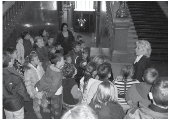
Látogatás a parlamentben