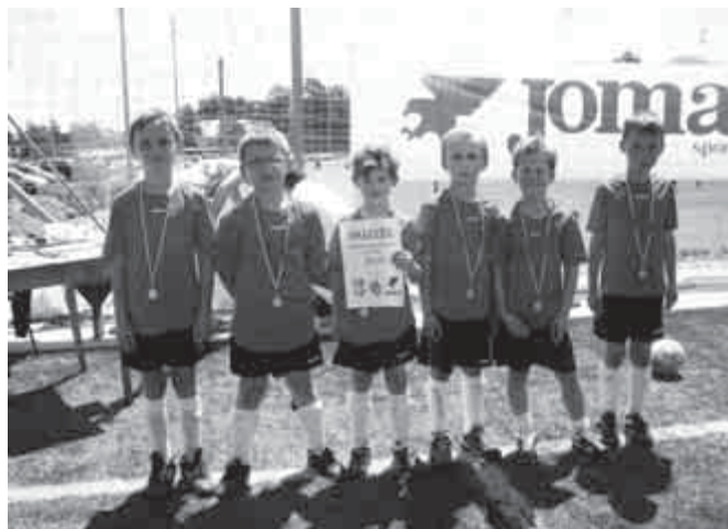
Juniális Kupa – U7-es csapat