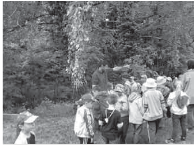
Diósjenői kirándulás – a tanösvényen