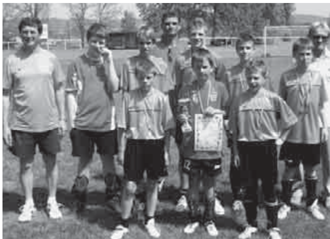
Majális Labdarúgó Kupa

IV. korcsoport: Szöd–Szokolya 0:4, Szöd–Földváry 1:1, Szöd–Visegrád 1:3 Gól: Bubb 2