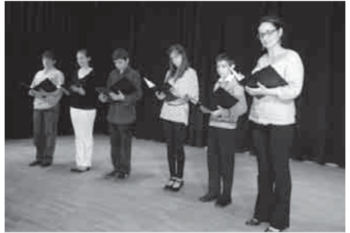
A hunyadiakkal szlovák népballadát olvassunk