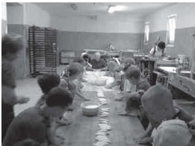
Diósjenői kirándulás – a Marton Pékségben

gidősebb fára, a bokrokra... Sok ismeretet hallhattunk az erdő élővilágáról, a fák, növények fejlődéséről. Ezután jól felszerelt játszótéren hosszabb játék következett. Nagy élmény volt a kisállatok simogatása. Láthattunk újszülött nyuszikat, kiskecskét, galambokat, bárányt. Tele élményekkel érkezünk haza.