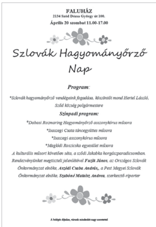
A II. Szlovák Hagyományőrző Nap plakátja