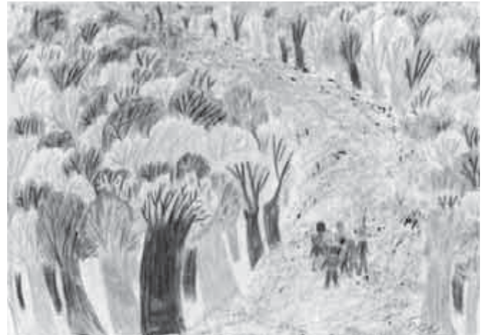
Erdei iskola – Hárs Róza rajza