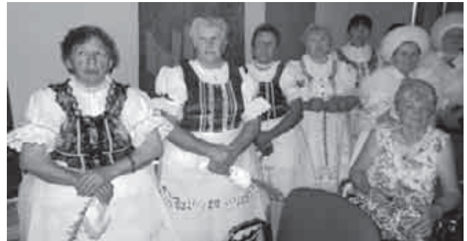
Sáriai bevetésre készen