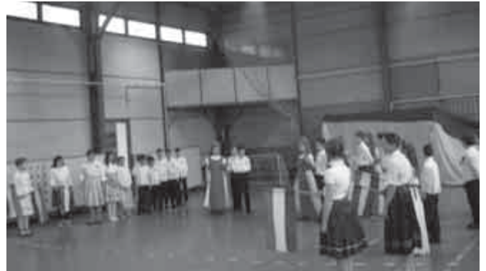
Március 15-i megemlékezés

A mai naptól feledésbe merülnek azok a percek, amikor összeszidtunk benneteket a szemtelésért, lustaságért, de megmaradnak azok a pillanatok, amelyeknek együtt