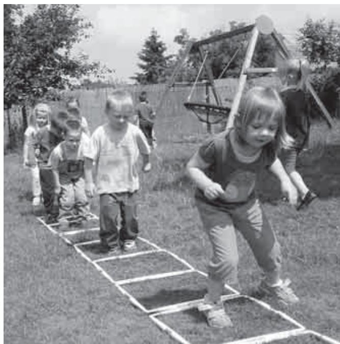
Játék a sportlétrával