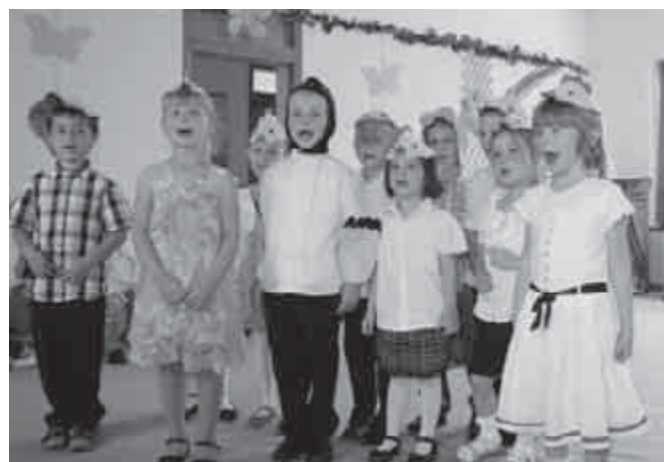
A Pillangó csoport évzáró előadása