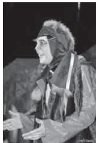
Gyereknepi színházi előadás a Faluházban (további képek a színes hátsó borítón találhatóak)