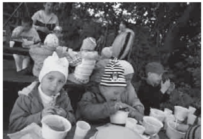
A Pillangó csoport kirándulása a Nyéki Lovasudvarban