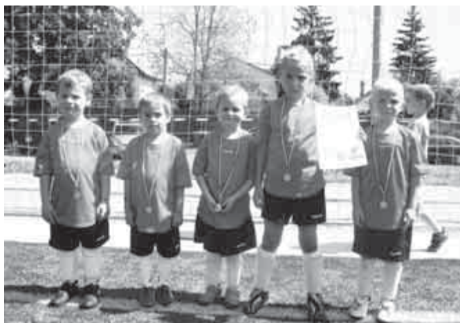
Juniális Kupa – U6-os csapat

esik egy kis mozgás, sportolás, valami más, kikapcsolódás a mindennapi darálóból. Az életkorban is nagy a szórás a csapatban. Van, aki harmincas éveit kezdi, és van, aki a nyugdíj előtt áll. Bármelyik korosztályba tartozol, és van kedved játszani velünk, gyere el! Ha már kézilabdáztál, ha csak szeretnéd kipróbálni, vagy ha csak mozgásra vágysz a friss levegőn, de egyedül nincs hozzá kedved. Gyere el, mi szívesen fogadunk! Keddenként az iskola udvarán 18.00-19.00-ig vár egy jó csapat!