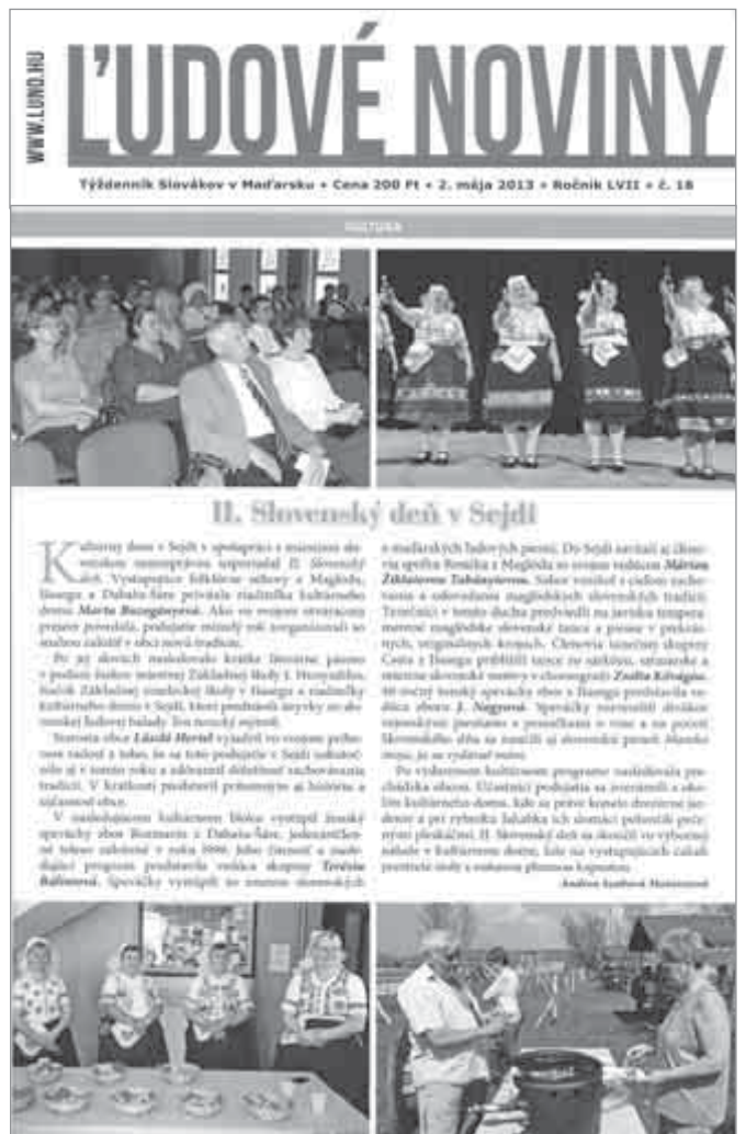
A magyarországi szlovákok hetilapja, a L'udove Noviny is képes beszámolót közölt szlovák hagyományőrző napunkról