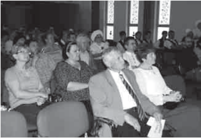
A nézőtérén feszült a figyelem