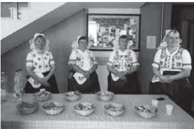
Fogadjuk a vendégainket