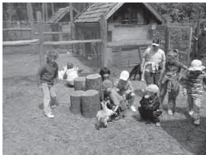
Diósjenői kirándulás – ismerkedés a kisállatokkal

Látogatásunkkor a farkasok éppen etetés után voltak. Jó lehetőség kínálkozott arra, hogy megbeszéljük a ragadozó állatok életmódját. Tudatosítottuk a gyermekekben, hogy ezek az állatok nem gonoszak, hanem így élnek, így táplálkoznak. Nagy sikert aratott körükben a sok mosómedve, strucc, varjú is. A kilátóból remekül szénézhattunk, megnéztük merre