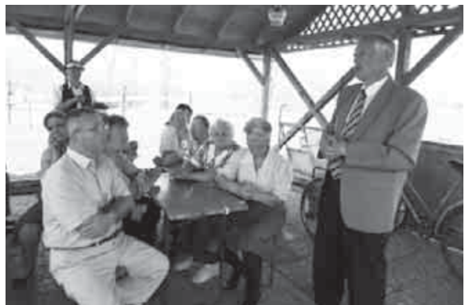
Polgármester úr Szódról mesél