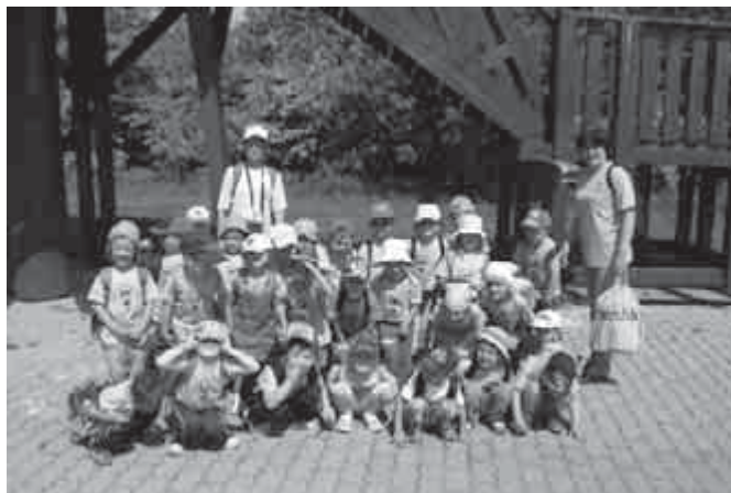
A Süni csoport látogatása a verezegyházi medveotthonban