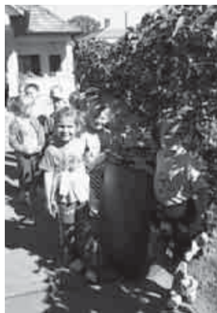
Hordónyi szőlőt szedtünk

Igen meglepődtünk, mert nagyon jó gyerekek jöttek hozzánk, és nem győztünk csodálkozni régi társaink picit unokáit felismerve. Az óvó néniktől nagyon kedves, hogy arra tanítják unokáinkat, hogy „vendégségbe üres kézzel nem megyünk”, de igen megkönnyebültünk, amikor a csomagból egy kézzel készített szép ajándék került elő. Mindig örömmel tölt el, ha ránézek és eszembe jut a számunkra is felejtethetetlen, kicsit rendhagyó