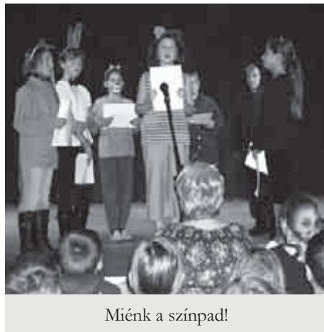
Miénk a színpad!

A minden évben hagyományosan megrendezett Miénk a színpad! idén is nagy sikert aratott mind a nézők, mind a fellépők körében. Többféle produkciót élvezhetett az igen vegyes korosztályú nézőközönség. A gyerekek izgalommal, de széles mosollyal élték bele magukat az éppen aktuá-