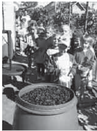
Sorban álltunk vödreinkkel

Igen meglepődtünk, mert nagyon jó gyerekek jöttek hozzánk, és nem győztünk csodálkozni régi társaink picit unokáit felismerve. Az óvó néniktől nagyon kedves, hogy arra tanítják unokáinkat, hogy „vendégségbe üres kézzel nem megyünk”, de igen megkönnyebültünk, amikor a csomagból egy kézzel készített szép ajándék került elő. Mindig örömmel tölt el, ha ránézek és eszembe jut a számunkra is felejtethetetlen, kicsit rendhagyó