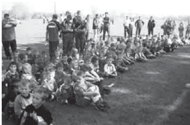
Október 23. ünnepi labdarúgás Sződ