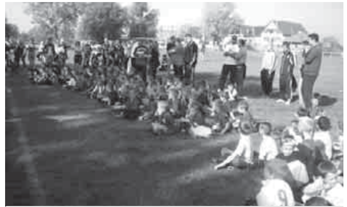
Október 23. ünnepi labdarúgás Szód

Csapatunk kirukkolt, sajnos a remek játék ellenére kikaptunk