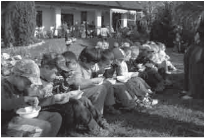
Hatvan éhes pocak