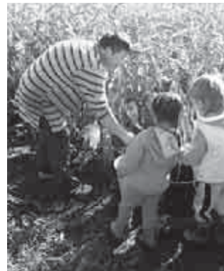
Ani néni magyaráz

néni kertjébe értünk, már szépen sütött a Nap. Megismertettük a gyerekekkel, hol kell letörni a növényről a kukori-