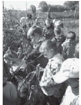
Törjük a kukoricát

Nekünk természetes, bár mégis furcsa dolog került lencsevégre... Hogyan fér meg óvodánkban a modern Lego és egy népi játék: a kukoricacső-tekerő verseny? Egyszerűen, ahogyan az a képen is látszik. Mosolygós gyerekek játszanak ezzel is, azzal is.