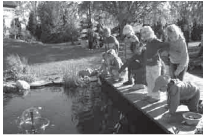
Kihajolni veszélyes..., de izgalmas