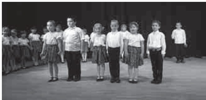
Ovisok köszöntik az időseket