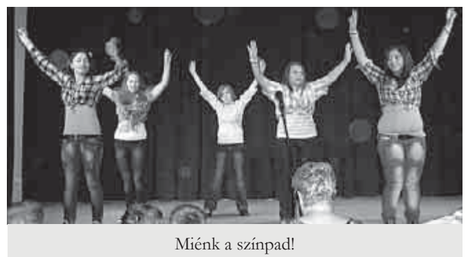
Miénk a színpad!