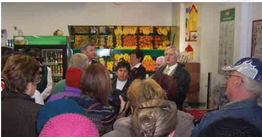
A Coop áruházának megnyitásával a község fontos új állomásához érkezett

Az Oktatási Minisztérium döntése, hogy a 3000 fő alatti települések iskoláinak üzemeltetését az állam veszi át, 3000 fő feletti lakosságszám esetén az iskolák üzemeltetése továbbra is az önkormányzatok feladata. A 3000–5000 közötti lélekszámú településeknek lehetőségük van arra, hogy az üzemeltetés jogát felkínálják az állam részére. Ebben az esetben az államkincstár megvizsgálja az érintett önkormányzatok költségvetését, és annak figyelembevételével