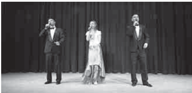
„Kellene ma éjjel egy kis hacacaré...”