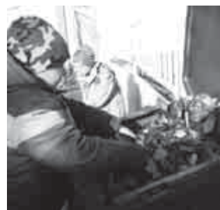
Az összegyűjtött leveleket nem égetjük el, hanem komposztáljuk, jövőre jó lesz a kert trágyázásához