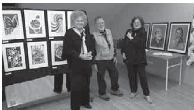
Gálosné Szűcs Emília kiállítása