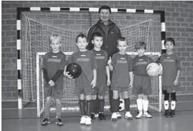
Football Factor és Aquaworld kupa