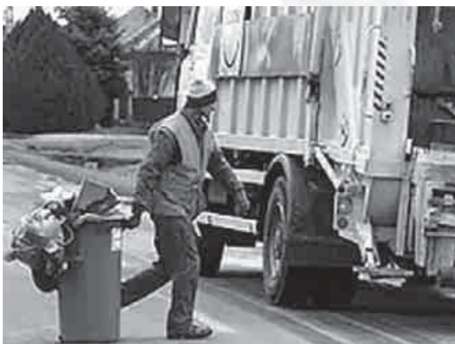
Nem a Remondis szállítja a szemetet 2013-tól