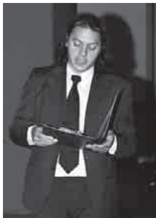
Erdélyi Balázs ünnepi beszédet mond

A szimpátia és a szeretet egyéni megnyilatkozása volt, amikor a Szovjetunióban egy orosz nő elsőszülött leányát Rákosi Mátyás után Mátyásnak nevezte el.