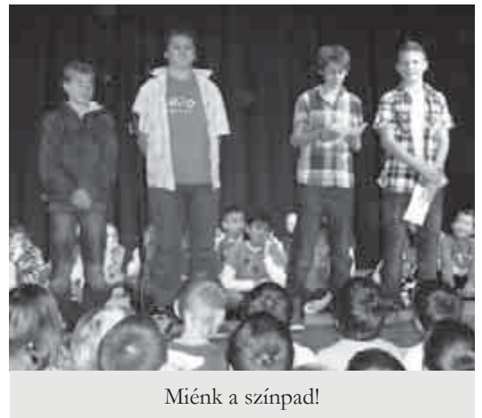
Miénk a színpad!