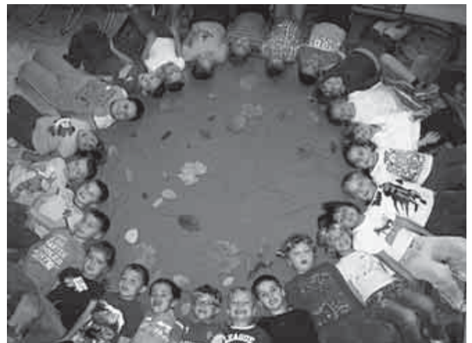
Mind jól éreztük magunkat a szavalóversenyen