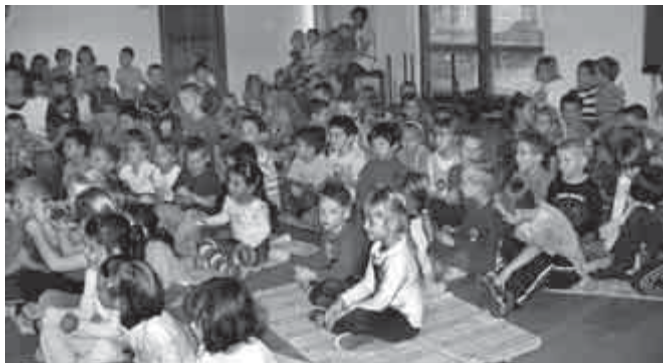
Százhusznál is többen voltunk

kedvet kapott a zenéléshez, és felnőttként viszontláthatjuk őt is, például egy zenekar élén.