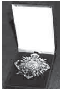
Emlékérem a kultúráért gyémántokkal

legszerencésebb rabjainak. 1947 végén került a Szovjetunióba, amikor az egész hatalmas országban szünőben volt az iszonyatos éhínség. Hosszú évekig együtt raboskodott olyan magyarokkal, akik átéltek ezeket a borzalmakat. Akik jelesre vizsgáltak emberi tartásból, áldozatvállalásból, összefogásból. Akik példát mutattak sok nemzet hasonló sorsú fiainak és rajtuk keresztül az egész világnak. Az orosz politikai foglyok nem csak az orosz nyelvvel ismertették meg, hanem az orosz irodalommal is. 40 éve fordít orosz verseket amatőrként, szerelemből. Az oroszok így vélekednek róla: „Ki ez a csodabogár, akit majdnem beletaposunk a betonba, akit majdnem megöltünk, akit hét évig kínoztunk, s aki ahelyett, hogy meggyűlölt volna bennünket, elkezdte klasszikusainkat fordítani?”