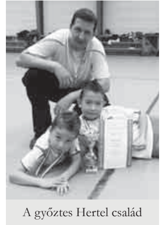
A győztes Hertel család