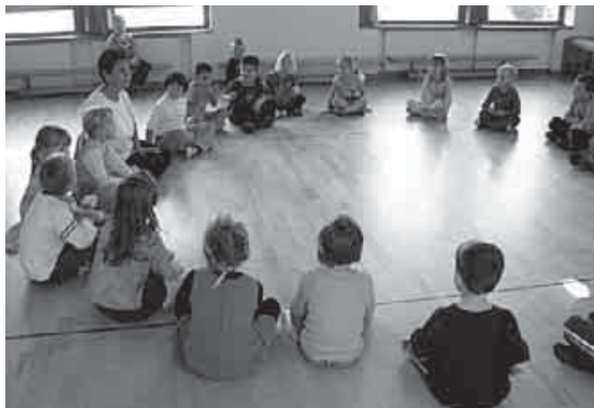
Így értjük meg jobban egymást is, magunkat is

nak, felszabadultan társalognak, segítik egymást egy-egy képzeletbeli akadályon, vagy épp vakon bízva, azaz csukott szemmel követik egymást a cél felé.