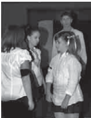
Október 23-ai ünnepség

November 5. – Reggel a harc javában folyt. Bekapcsoltuk a rádiót – szólt már. Azt mondta: hogy a szovjet csa-