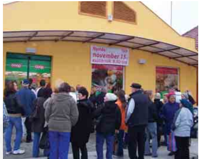
A Coop áruház megnyitása