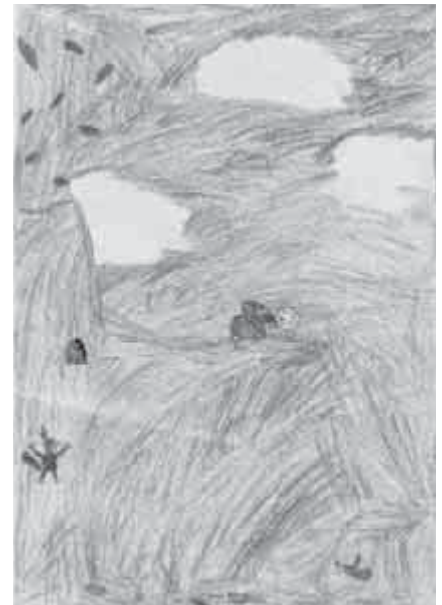
Csórkőr Barnabás 4. osztályos tanuló rajza