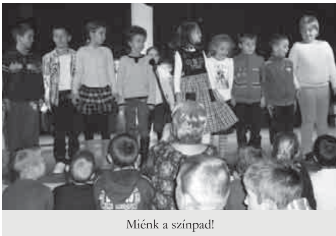
Miénk a színpad!