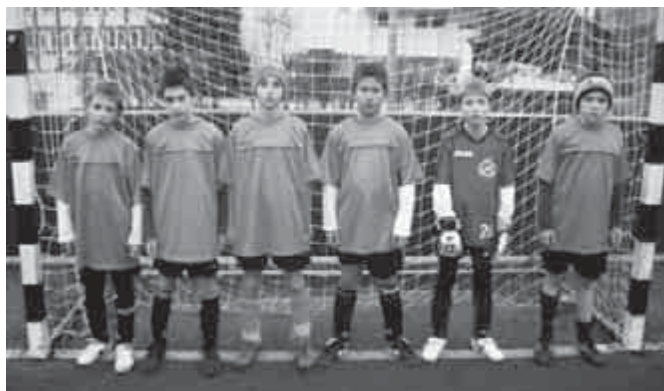
Bravo Torna Budapest