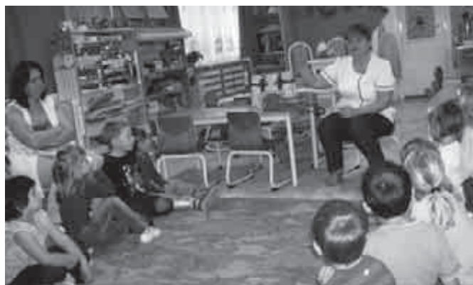
Így már nem lesz annyira félelmetes hely a rendelő

Amikor a Méhecske csoportban meglátta a zöldségekkel teli kosarat, nem kellett ecsetelnünk: nekünk elsősorban a gyümölcs és a zöldség a „barátunk”.