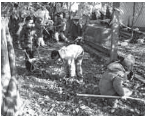
Rendet teszünk a fák alatt

Sajnos a komposztálónkból még nem tudtuk földet szedni, de jó úton haladunk.