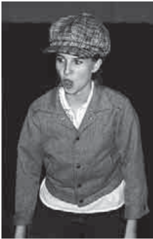
Október 23-ai ünnepség

November 1. – Elmentünk anyukámmal kicsit szétnézni. Kimentünk a Blaha Lujza térre. A Szabad Nép kapuját fegyveres katonák őrzik. Előtte 2 villamoskocsi volt. Láttam a két kiégett autót. A parknál az Igazság című napilapot árulták. Vettünk is egyet. Az Akácfa utcában egy páncélszeker-roncon sok ember áll. Távolságban 2 fiatal ember a Sztálin-szobor utolsó darabját veri szét. A Szabad Nép székházának a felírásából csak ennyi látszik: ...a Nép. Az égen igen nagy zajjal egy helikopter repült. A Körút és a Népszínház utca sarkán egy össze-vissza tört villamoskocsi volt. A hirdetőoszlopokon kis rajzok voltak ruszki haza aláírással. Otthon rolifogót játszottam. Este a rádió közölte, hogy újabb szovjet csapatok érkeznek Budapestre. Nagy Imre kéri ezek visszavonását.