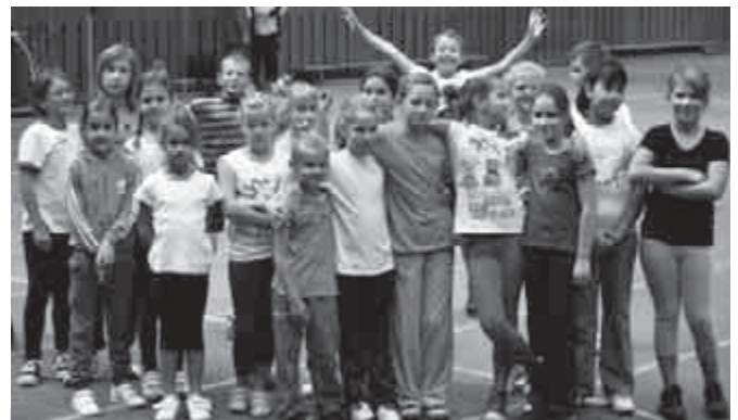
Kölyökatlétika a TF-en