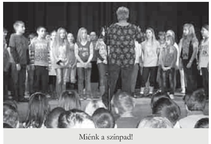
Miénk a színpad!

lis szerepükbe. Láthatunk táncot, meserészletet, poénos darabokat. Egy ilyen vicces hangvételű műsorszámmal készültek a harmadik osztályosok