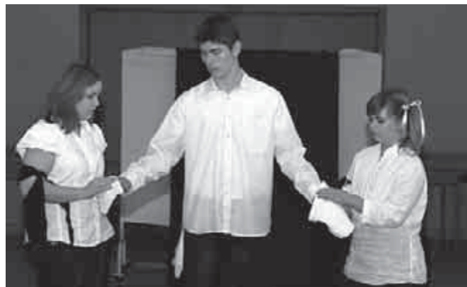
Október 23-ai ünnepség