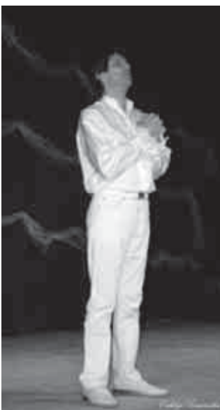
Pelsőczy László színművész fohász

1989 óta ünnepeljük a magyar kultúra napját, mert hogy a Nemzeti Himnuszunk tisztázását 1823-ban Kölcsey Ferenc ezen a napon fejezte be, és természetes, hogy az a fohász, az az ima a Himnuszban testesül meg, hogy ennek a napnak az évfordulóján mindig meg kell állnunk és ünnepelnünk kell a kultúrát. A kultúra jelenthet egyetemes értékeket, mint az emberiség, a humanizmus, az együttműködő-képesség, a tolerancia, a másokra való odafigyelés, de a kultúra magában hordja mindazokat a nemzeti értékeket, amely értékek nélkül üres lenne a mindennapunk, amely értékeket sokszor olyannyira magunkban bemoszunk, hogy észre se vesszük, mert hogy ez természetes kell legyen számunkra, hogy a hagyományaink bennünk élnek. A kultúra magában foglalja azokat a helyi értékeket, amelyekre Önök itt büszkéek, amiért szódiaknak tudják mondani magukat, a mélyen Önökben rejtőző dallamokat, mozdulatokat, viseleteket.