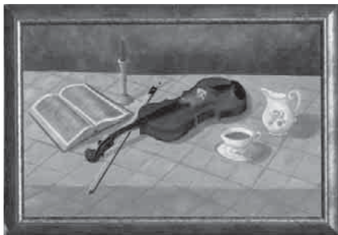
„Csendélet” – dr. Kalmár Géza munkája