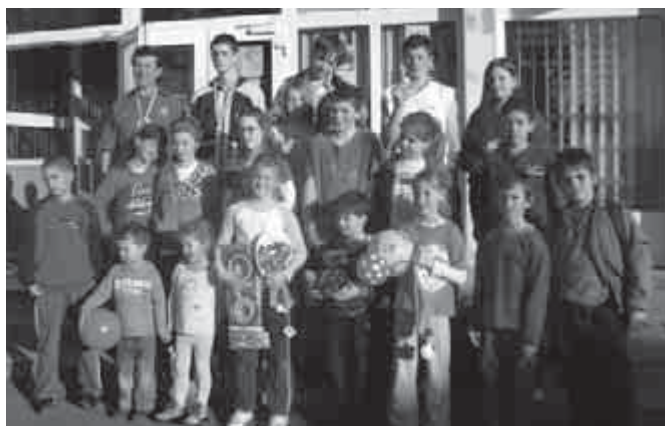
Az utcai futóverseny résztvevői

A XXII. kerületi Nagytétényi AC Villám Focisuli és Futsal Club U6-os és U7-es kispályás labdarúgó tornán öt-öt csapat vett részt. Ezen a tornán mindenki nyert, de lássuk csapatainkat! Győzelmi szándékkal lépett mind a két gárda a pályára, valamennyien átéreztek a torna jelentőségét és nagyszerű csapatként működtek. A támadók mindent megtettek, hogy betaláljanak, védekezésnél pedig távol tartottuk kapunktól az ellenfelet és győztünk.