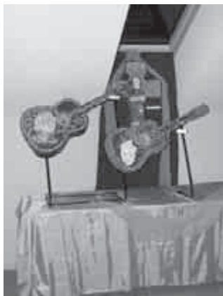
Kardos Tibor munkája