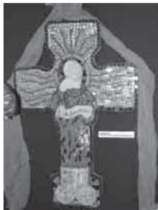
„Szent Benedek” Kardos Tibor munkája