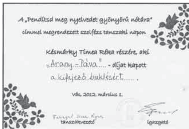
Az Arany-Páva-díjak és tulajdonosaik