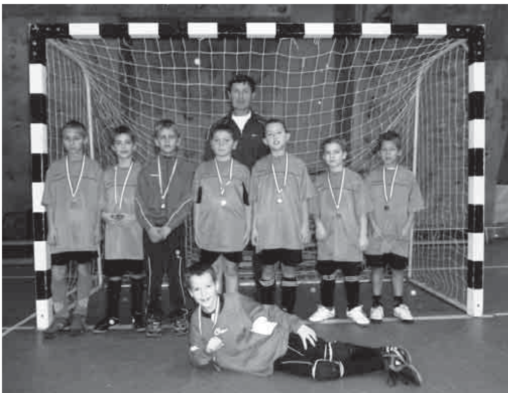
A II. Pokorny Emléktornán induló csapatunk

A hagyományos évertékelő gálán, az MLSZ Pest Megyei Sportigazgatóság 21 pont-