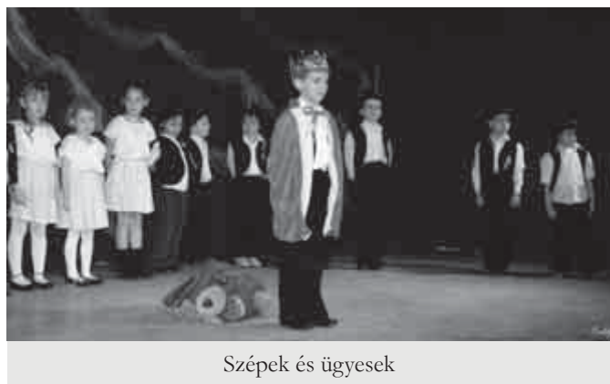
Szépek és ügyesek