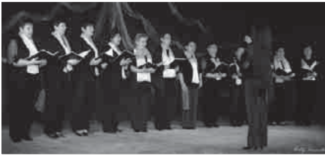
A bátorkesziek kórusa