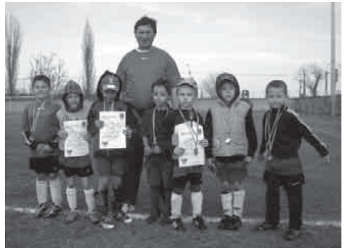
U7-es labdarúgó csapatunk

Az állás: 1. Dunakeszi Kinizsi, 2. Göd SE, 3. Letkés, 4. Szöd 1., 5. Szöd 2., 6. Szendehegy FC