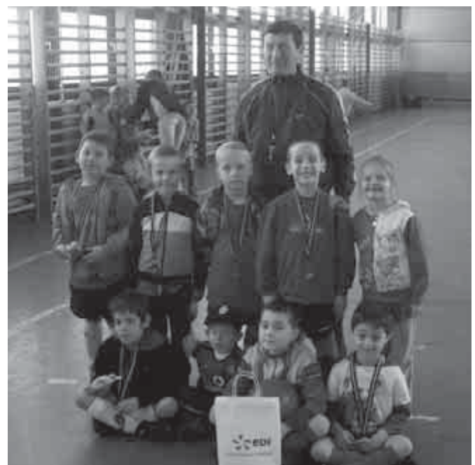
U7-es labdarúgó csapatunk