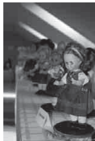
A csodálatos babák

rű napon, a magyar kultúra napján, a felvidéki Bátorkeszji üzenetét hozom. Kölcsynek számos követője volt a magyar irodalomban és a teljes magyar kultúrában. Hát hogyan is ne lett volna, amikor a