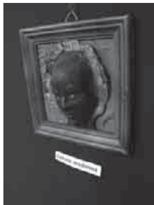
„Fekete Madonna” Bíró Ferenc munkája