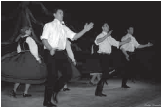
A Szódi Szita a kultúra napján