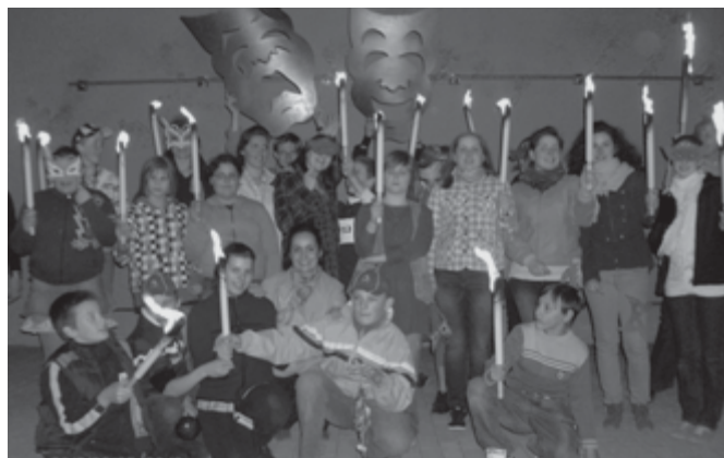
A színházért égnek a fáklyáink