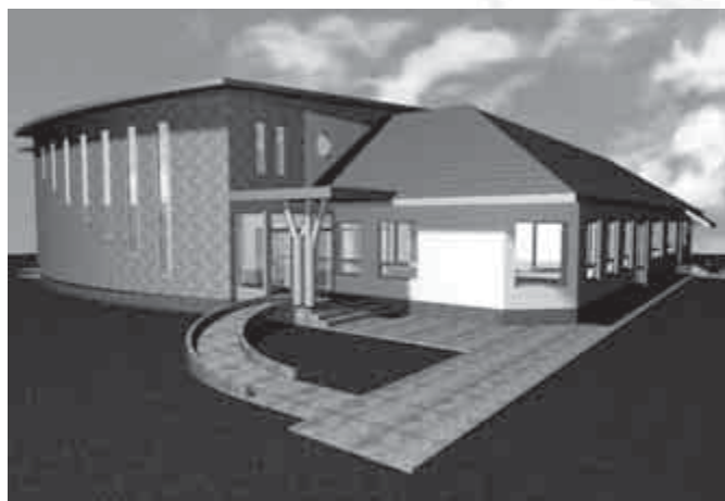
Az óvodabővítés látványtervei