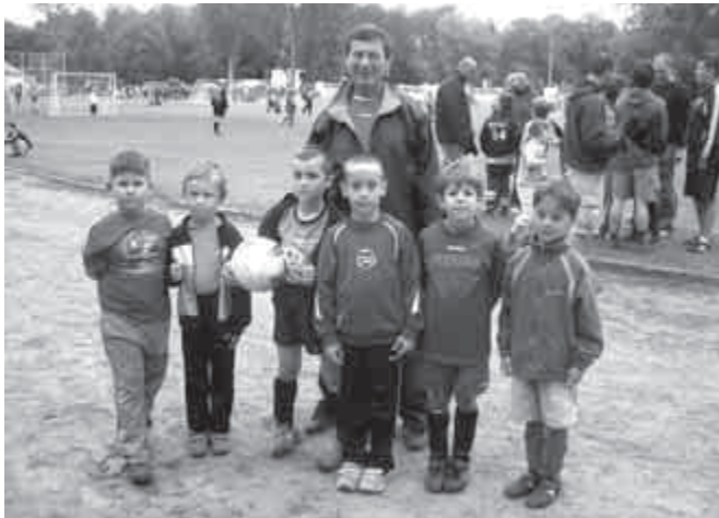
Fétis labdarúgás, Göd