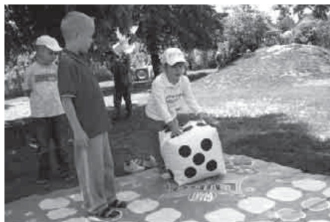
Ha végre itt a nyár...