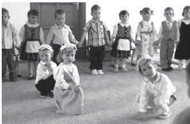
Anyák napi előadás a Csiga csoportban