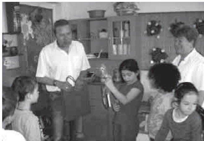
A DMRV Víz világnapi rajzpályázatának díjkiosztóján

ránk, de volt, aki vegyes érzelmekkel lépett ki a kapun (és persze nem a gyaloglás miatt).