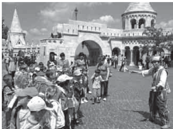
Év végi kirándulás Budán – a Halászbástyánál

Nagyon sok élménnyel eltelve, alaposan elfáradva érkeztünk haza. Ezt az élményparkot szívesen ajánljuk a szülőknek is, mert gyönyörű környezetben, jó körülmények között lehet a szabadidőt hasznosan eltölteni. Lehetőség van a gyermekek számára különböző kézműves technikák megismerésére is.