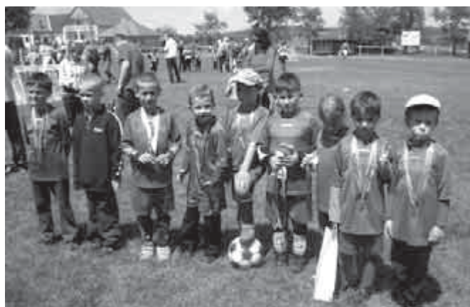
Pünkösdi ovis labdarúgócsapatunk

Pünkösdi hétfőjén a rossz idő ellenére tizenhárom csapat vett részt a hagyományos ünnepi tornán, és több százan kijöttek a foci pályára. Az időjárás már az első meccsen sem