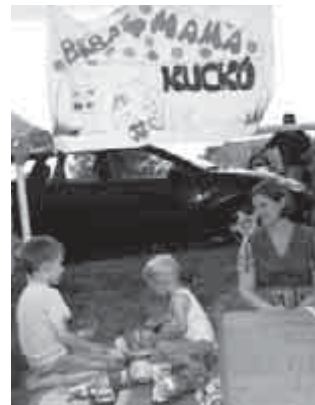
Baba-Mama Kuckó a gyermeknapon

beszélgettek és megosztották egymással tapasztalataikat. 16 órakor egy fergeteges salsa bemutatót láthattunk, 16.30-kor az apró népség ugribugrizott Hertel Szilvia játszodájában.