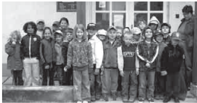
Fogászati szűrővizsgálaton jártak az óvodások

Esőre állt az idő, mikor fogászati szűrővizsgálatra indultunk. Többnyire lelkes, sétálni szerető gyermek mosolygott