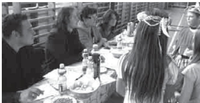
Mathias Rex Agy- és Lovagi Torna