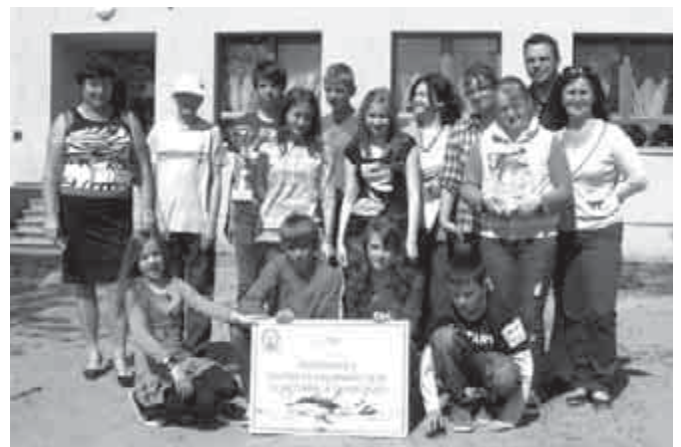
A Föld-napi vetélkedő nyertesei