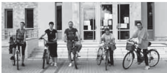
No Drog! – Startra készen

és más hivatalos szervek, továbbá néhány tiszteletreméltó egyén megszállott munkájára hagyatkozunk. A civil társadalom és minden egyes ember ügye, hogy megóvjuk jövőnket a drogok terjedésétől.