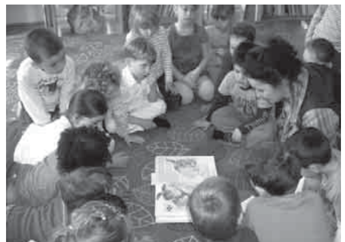
Feszült a figyelem