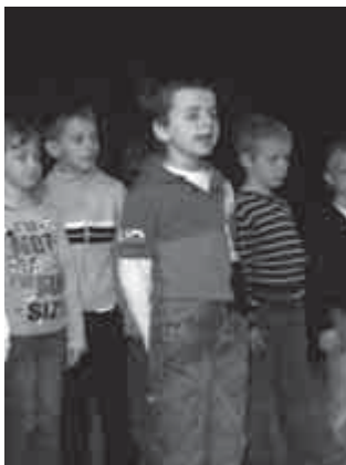
A költészet napján

Napokon keresztül lelkesen készültek óvodásaink a költészet napja alkalmából a Faluházban megrendezett versmondásra. A kisebbek közös verssel, mondókázással lepték meg a lelkes közönséget, a nagyobbak már párban vagy hármas-négyes csoportban szavaltak. Akik szeptembertől már iskolások lesznek, azok pedig büszkén, önállóan adták elő verseiket. Köszönjük a lehetőséget, hogy megmutathatták tudásukat az óvodások is, és a süteményt, amit megérdemelten, munkájukért kaptak.