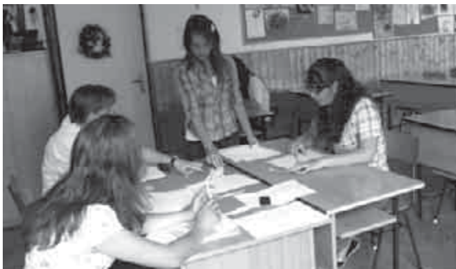
Év végi vizsga

During the exam, we choosed a topic. We had some minutes for writing about our topics. After that we had to tell the teacher about our topics. When we finished our exam, we waited for the marks and diplomas.