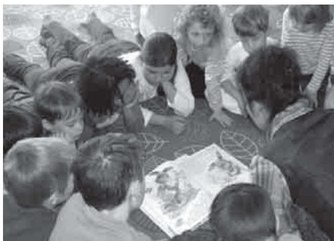
Márti néni története

Továbbra is szeretettel várjuk utazni szerető és úti élményeiket megosztó családok, egyének jelentkezését, akik szóbeli vagy fényképes élménybeszámolót tartanak az érdeklődőknek!