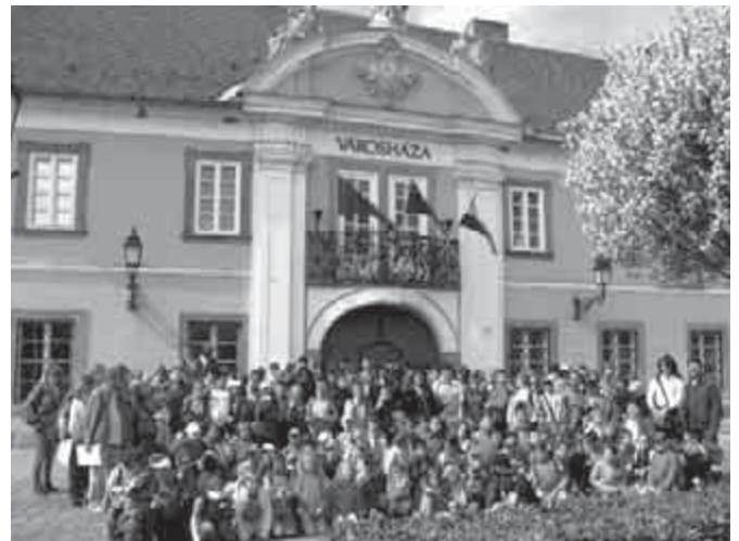
Váci Vagány Városjárás