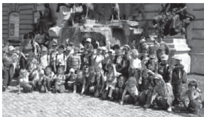
Év végi kirándulás Budán – a Mátyás-kútnál