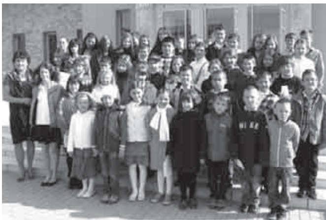
A költészet-napi szavalóverseny résztvevői