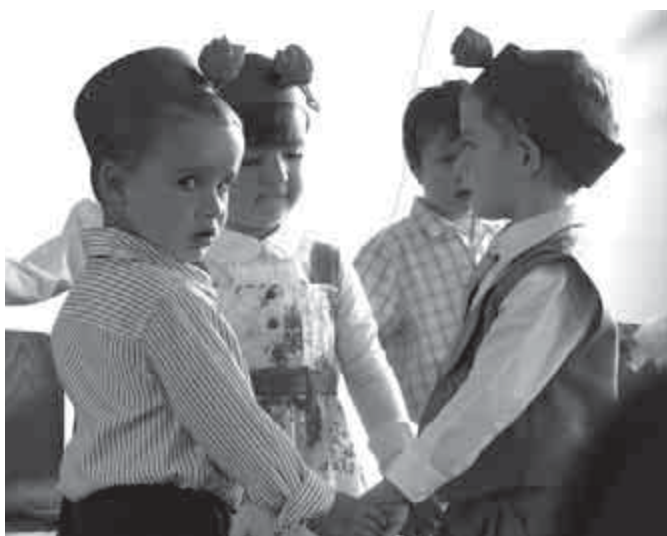
Anyák napi előadás a Csiga csoportban

lék marad, és nagyon jó érzéssel tölt el nap mint nap.