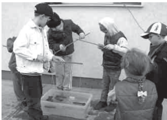
Népi játszóház az óvoda udvarán