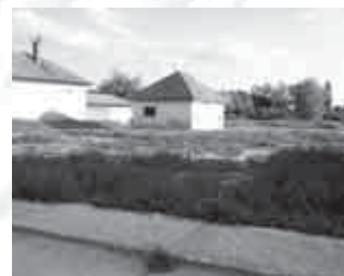
A volt presszó telkén még idén felépül az új COOP

A Gödöllői Coop vezérigazgató asszonyától érdeklődésemre azt a tájékoztatást kaptam, hogy a középső presszó helyén még ebben az évben szeretnék átadni az új Gödöllői Coop Áruházat. A vezérigazgató asszonynak az volt a kérése, hogy legyek segítségére az új élelmiszer áruház munkaerő-toborzásában. Önkormányzatunkhoz várjuk olyan