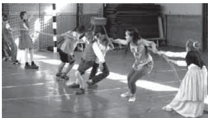
Mathias Rex Agy- és Lovagi Torna