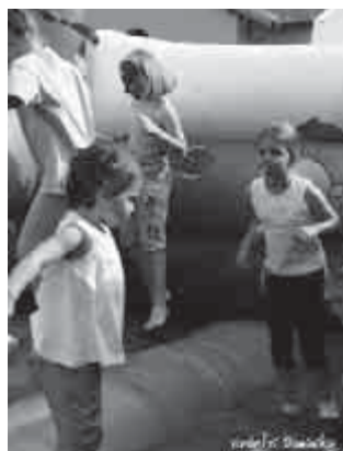
Ha végre itt a nyár

Eközben a focipályán már javában zajlottak az izgalmasabb programok. A futballpálya egyik felét a labdarúgók foglalták el, akik korosztály szerint rövidített meccseket játszottak egy-