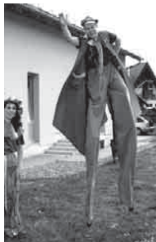
Innen föntről a felnőtt is gyerek