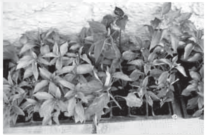
Paprikapalánták a rászorulóknak – felajánlásból