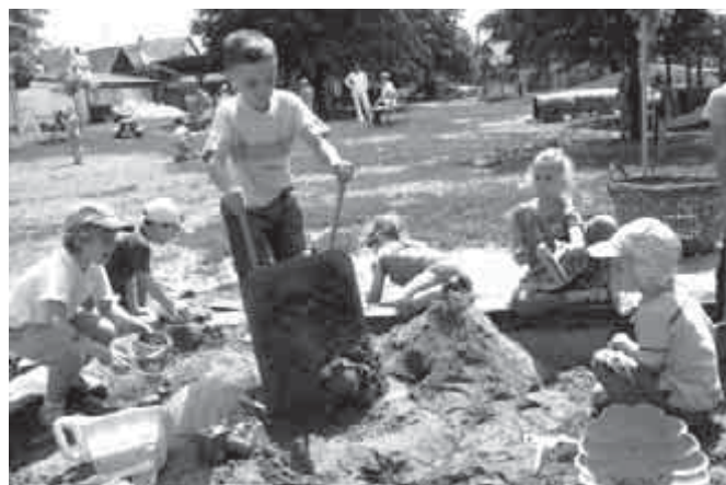
Ha végre itt a nyár...