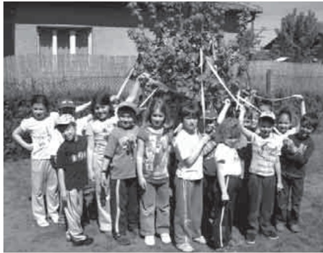
Májusfa-állítás az óvoda kertjében

A DMRV Zrt. Víz Világnapi Gyermekrajz-pályázatán óvodánk Katica csoportosai III. helyezést értek el. Jutalmunk: könyvtulvány és egy ajándécsomag (festék, ecset, színesceruza), melyet gyermekeink már birtokba is vehettek. Köszönjük a lehetőséget, hogy idén is megmutathattuk gyermekeink kreativitását.