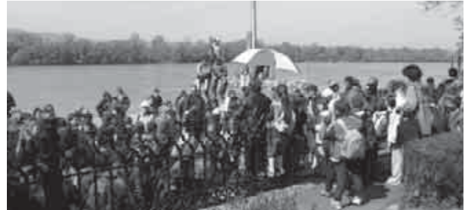
Váci Vagány Városjárás

Nagy várakozás előzte meg a középkori hangulatot idéző megmérettetést, amin a 3.