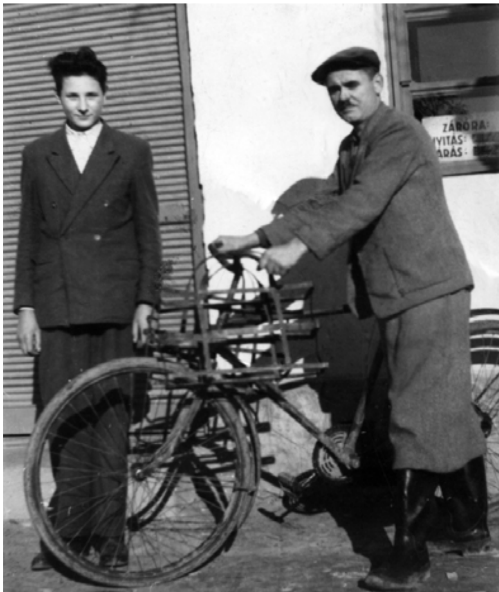
A Marschalek-féle kocsma előtt