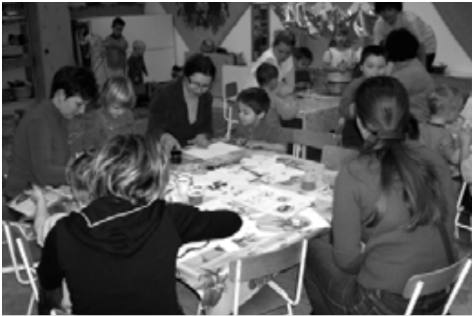
A Süni csoportban is lázasan folyik a munka

sodik otthonát, ahol minden napjait tölti. Ilyenkor mindenki nagy készülődéssel készíti kis bohócait, rajzolja, vágja, ragasztja, vagy épp a többi kis emléket. Nagyon kellemesek ezek az órák, hiszen egy nagycsalád alakul ki hirtelen egy olyan társasággal, akiknek reggel, illetve délután egy szervuszig van csak ideje. Ami még nagyon fontos: mikor otthon ránézünk az együtt készített