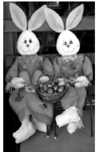
Kellemes húsvéti ünnepeket kívánnak az óvoda dolgozói

E húsvét ünnepnek Második reggelén Tudják azt már maguk, Miért jöttem ide én. Hamar bát előmbe Százszorszép leányok, Piros rózsavizem Hadd öntözsem rátok. Azt nyugodt szívvel Innen távozhatok, Emléksül nébány szép Piros tojást kapok!