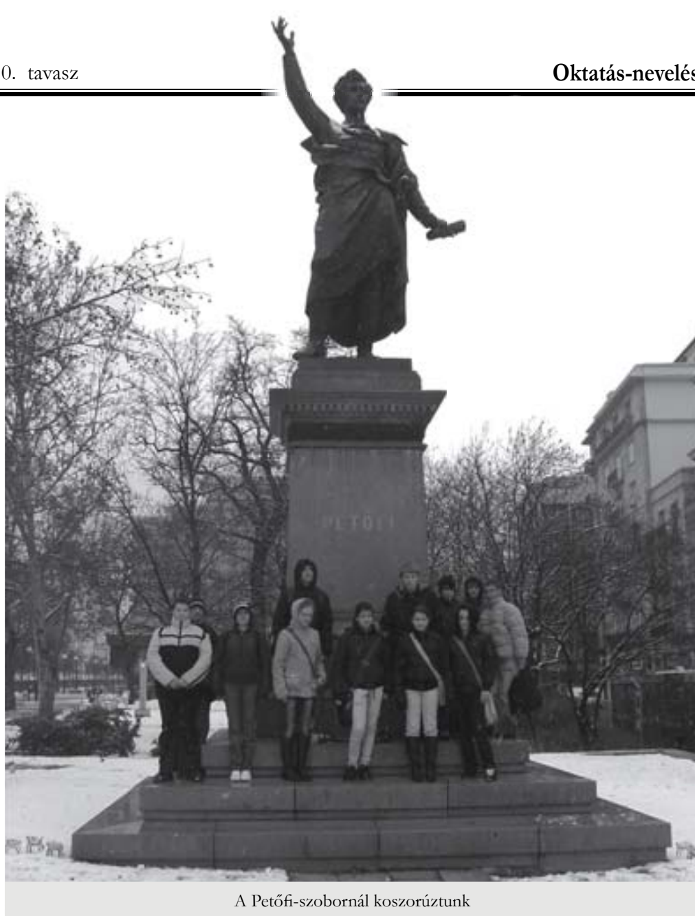
A Petőfi-szobornál koszorúztunk