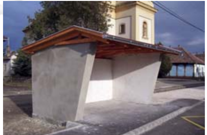
A műemléki környezetben felújítás alatt lévő buszváró