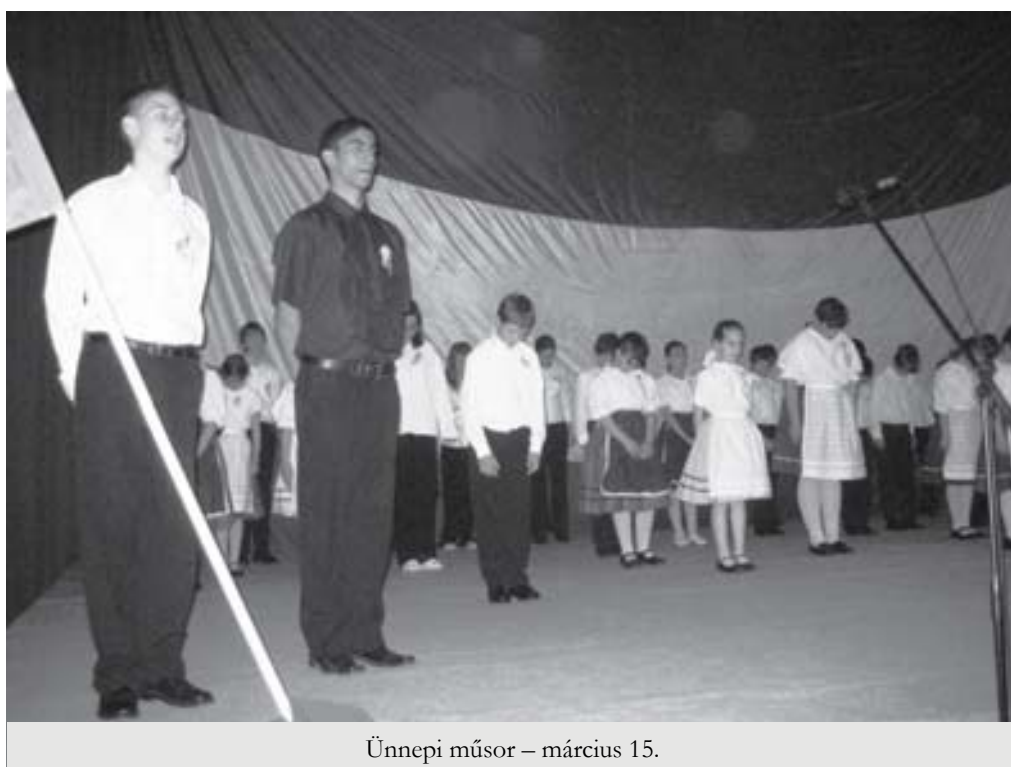
Ünnepi műsor – március 15.