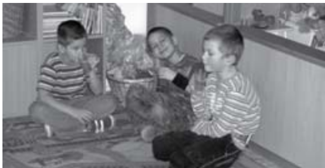
Mindenki iszik a mézes teából

Hagyományainkhoz híven ebben az évben is a kopjafánál ünnepeltük március 15-ét, a nemzeti ünnepünket, ebből az alkalomból az óvodások zászlókkal, virággal díszítették az emlékmű környékét.