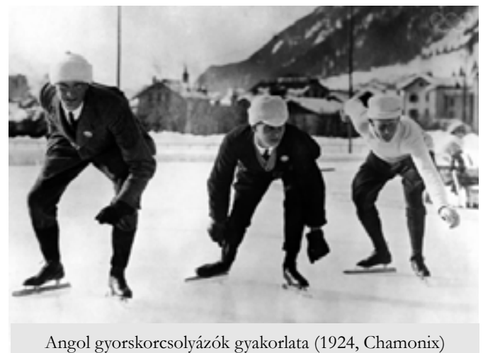
Angol gyorskorcsolyázók gyakorlata (1924, Chamonix)

Uller , a skandináv vadászisztenség az Edda-mondák szerint „állatok csontjain csúszott a síkos jégen”.