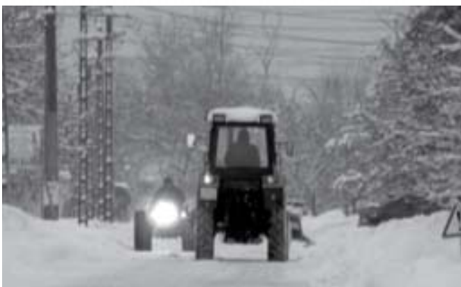
A csapadékos tél a belterületi utak tisztításánál fokozott feladatot jelentett

Önkormányzatunk előre tervezhető bevételei sajnos nem fedezik a működési kiadásainkat. A képviselő-testület úgy döntött, hogy az önkormányzat az egyéb, előre nem tervezhető bevételeit pályázati önrészként kívánja felhasználni nagyobb beruházások megvalósítása érdekében. Útépitésre ebben az évben a költségvetésben szerény ösz-