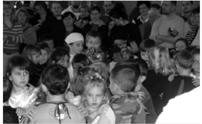
Királylányok, boszorkányok, kalózok ropták kéz a kézben

Nagy mulatság van itt ma, ezérféle maskara perdül-fordul, integet, búcsúztatja a telet.