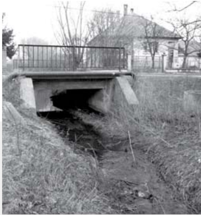
A Tece-patak jelenlegi állapota

Szödliget Község Önkormányzata a P+R parkoló megépítésére sikeres pályázatot nyújtott be. Szödliget és Sződ képviselő-testületei úgy döntöttek – mivel a beruházás mindkét község lakosságát érinti –, hogy a beruházás önrészt 50-50 %-ban közösen biztosítja. A munkálatok megkezdődtek, és a tavasz végére be is fejeződnek.