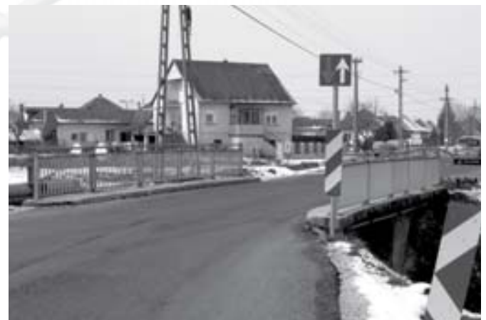
A sződi híd útszűkülete az átépítéssel meg fog szűnni