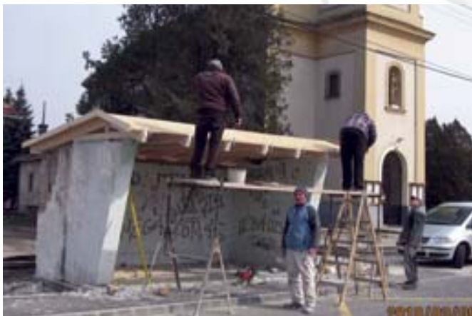
A műemléki környezetben felújítás alatt lévő buszváró

A Szódrákos-patak hídja mellett megépülő játszótér vonatkozásában nálam, vagy Volentics Gyulánál, a kommunikációs és sport bizottság elnökénél.