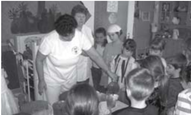
Csura néni elmeséli e népszokás történetét

A néphagyományőrzés keretein belül a Balázs-napot mézes teakortyolgatással ünnepeltük az óvodában.