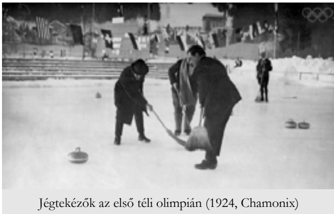
Jégtekézők az első téli olimpián (1924, Chamonix)