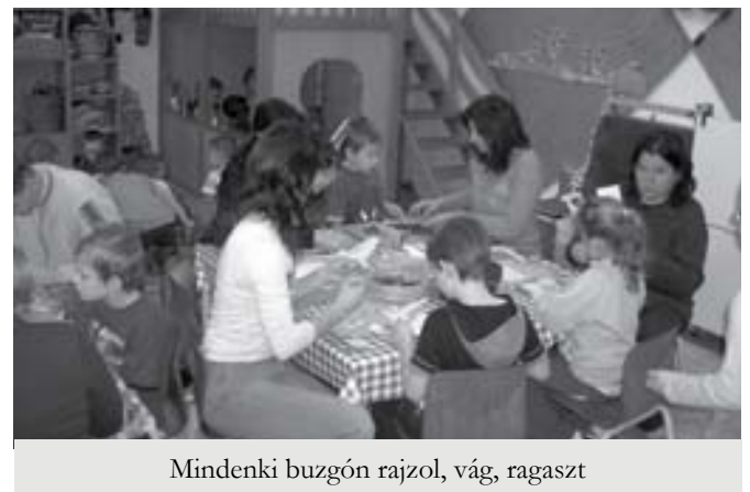
Mindenki buzgón rajzol, vág, ragaszt

Igazán nem tudni pontosan ki várta jobban: a szülő, aki először is egy órácskára újra gyermek lehet, és másodsorban, de nem utolsó sorban láthatja, és picit részese lehet gyermeke mindennapjainak, vagy a gyermek, aki megmutathatja má-