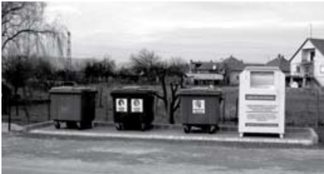
A ruhagyűjtő konténerek a szelektív hulladékgyűjtő szigetekre kerültek

helyet jelölt meg a konténerek elhelyezésére: egyet a Dózsa György út és József Attila út sarkánál található gyűjtőszigeten, egy másikat pedig a butik-sor melletti területen.