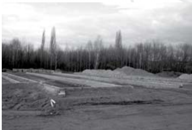
Épül a P+R parkoló

A Magyar Vöröskereszt Pest Megyei Szervezete megkereste önkormányzatunkat, hogy a község területén használt-ruhagyűjtő konténert helyezhessen el. A képviselő-testület két