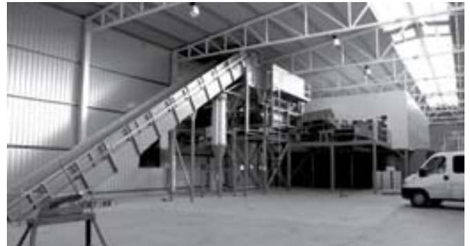
A hulladéklerakó szelektáló gépsora

Várhatóan 2010 áprilisában átadják az Észak-kelet Pest és Nógrád Megyei Regionális Hulladékgazdálkodási és Környezetvédelmi Önkormányzati Társulás tulajdonában lévő kerepesi hulladéklerakó és ártalmatlanító telephelyet. A csörögi hulladéklerakó bezárása után, a kerepesi hulladéklerakó megnyitása a Remondis Kft. a község kommunális hulladékát a dunakeszi hulladéklerakóba szállítja. A kerepesi hulladéklerakó az uniós szabványoknak megfelelően kezeli és ártalmatlanítja a kommunális hulladékot. A korszerű hulladék-lerakásnak és -ártalmatlanításnak jelentős költségvonzata van, emiatt a hulladékbegyűjtés szolgáltatási díja várhatóan Sződön is növekedni fog.