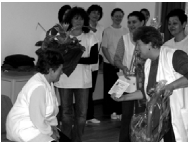
Egy kis emlék