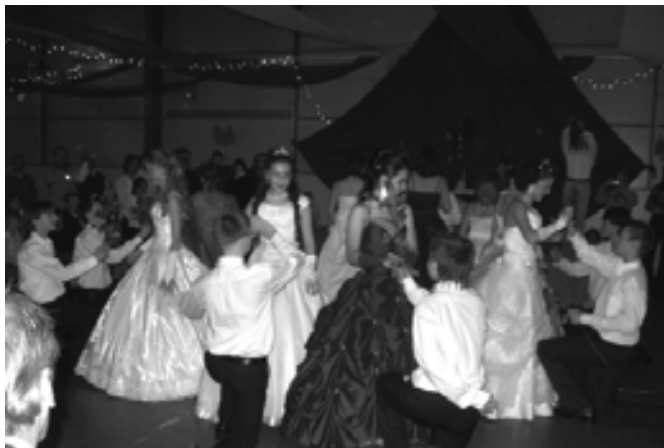
A végzős diákok keringőtánc

A kérdések alapvető ismeretek alkalmazását kívánták, nem egészen a mindennapi szavak szintjén, illetve egy kicsit mérte tájékozottságukat,