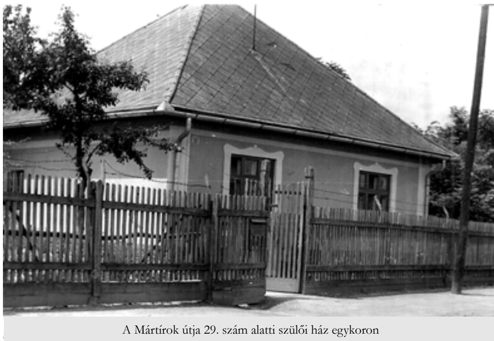
A Mártírok útja 29. szám alatti szülői ház egykoron