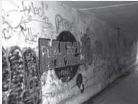
Az aluljáró. Önök használták?

Negyvenkét éve épült meg a Sződ-Szödligeti vasútállomáson a két peront összekötő gyalogos aluljáró. Igazi funkcióját talán sohasem töltötte be, mivel a sződiek – balesetveszélyes módon – a buszjárrattól a kanyarodó úttesten át a sorompók mellett közelítet-