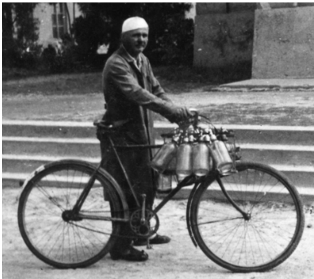
A templom előtt szállítás közben