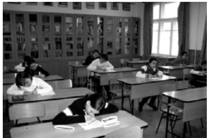
A verseny hevében