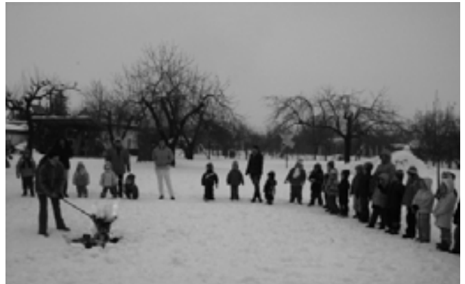
Ég a Kisze, lánggal ég

Virágok nyilni akarnak, Színt adni barna avarnak. Kisze bábu sajnálhatod, Te ezt már meg nem láthatod!