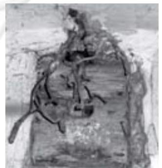
Az egykori világítóttest helye