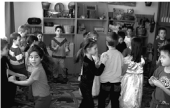
A hétfői bál után az oviban folytattuk a mulatozást

I dén már elkészült az óvodai szánkózódomb, és a gyerekek boldogan használták ki a téli napokat.