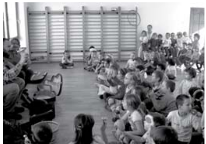
A gyerekek csörgővel kísérték az éneket

A MISZTRÁL együttes gyermeklemez-bemutató koncertje 2010. április 16-án 15 órakor kezdődik az óvoda udvarán. Mindenkit szeretettel várunk.