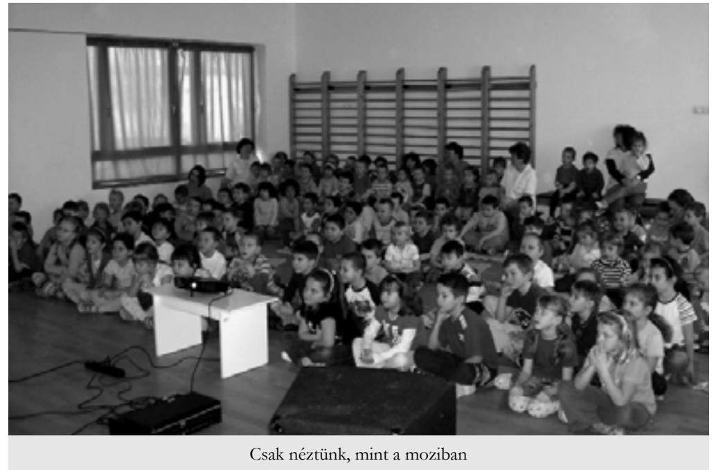
Csak néztünk, mint a moziban

Nevelési munkánk színesítésére új lehetőséget kínált a Váci ART Filmszínház. A hátralévő nevelési évben a Vuk, a Magyar népmesék sorozat és Halász Judit Csiribiri koncertfilmjét láthatják a gyerekek az óvodában.