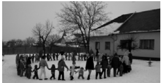
Közös erővel újtuk a telet