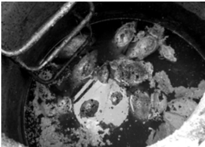
Ilyen is volt – haltetemek az átemelőben