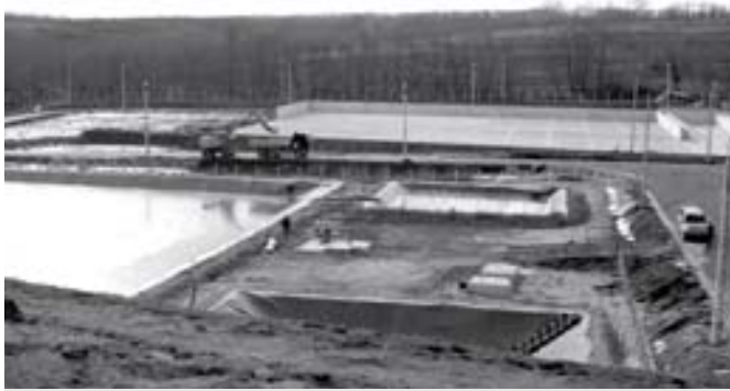
Még üres a kerepesi lerakó

szeg szerepel, mely kisebb újavításokra elegendő. Nevelek településrészen az eddig évekhez hasonlóan ebben az évben is tolólapos útegyengetéssel kívánunk javítani a közlekedési viszonyokon. 2009-ben a Tél és a Tavasz utca egy részén mart aszfaltot helyeztünk el. Amennyiben idén is lehetőségünk nyílik ilyen anyagot kedvezményesen beszerezni, a javításokat folytatjuk.