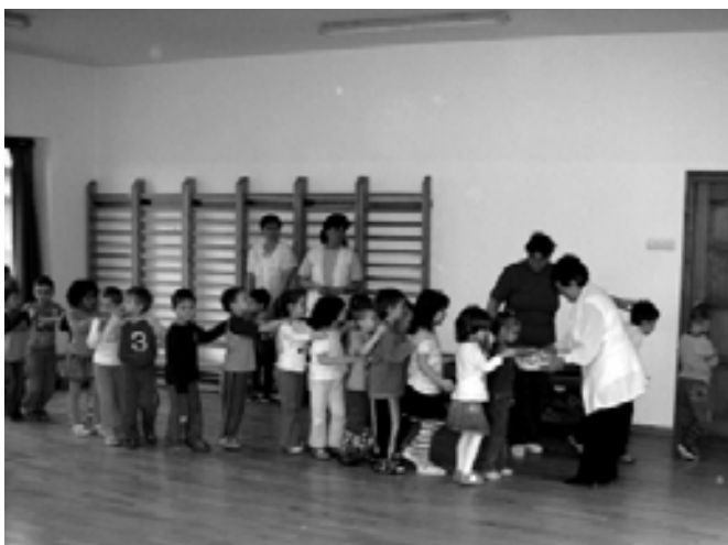
Marika néni soha nem jött üres kézzel