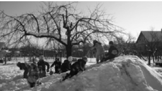
Téli örömek a szánkózódombon

I dén már elkészült az óvodai szánkózódomb, és a gyerekek boldogan használták ki a téli napokat.