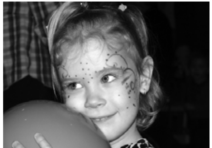
A vidámság kiült az arcokra