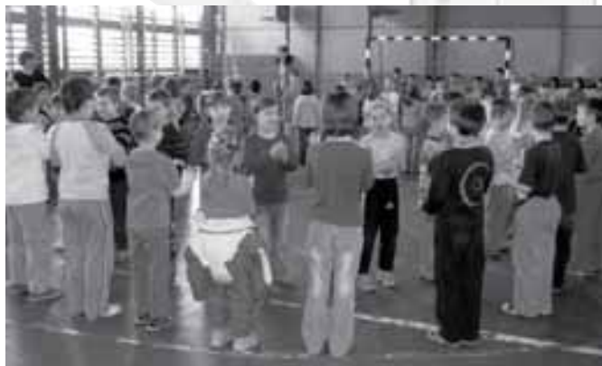
Mackó, mackó, ugorjál!

Óvodások fogadása intézményünkben – 2009.március 10.