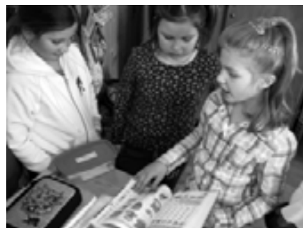
Én már tudok olvasni!