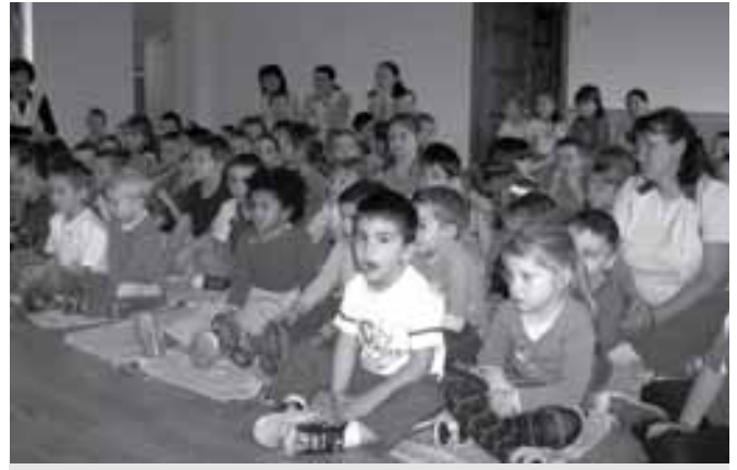
A dal a miénk

ken kísérték, a gyerekek pedig hol énekelve, hol tátott szájjal hallgatták.