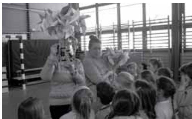
Nézzétek csak, mit kaptok!