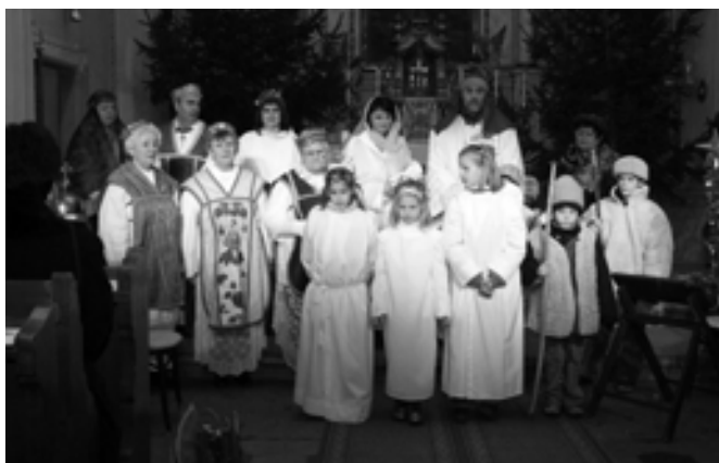
A karácsonykor bemutatott pásztorjáték szereplői