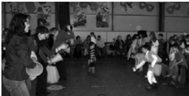
Szülők és gyermekek játéka