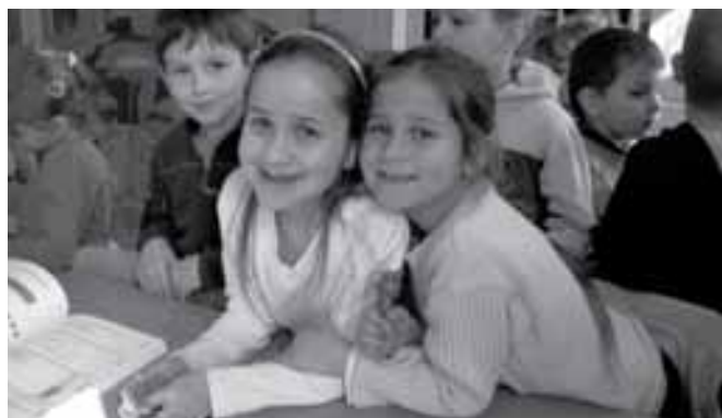
Testvérekém, nemsokára én is jövök!