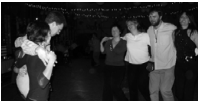
Hangulat a tetőfokon