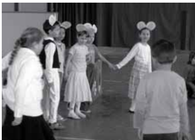
Másodikosok az Egérsaládban