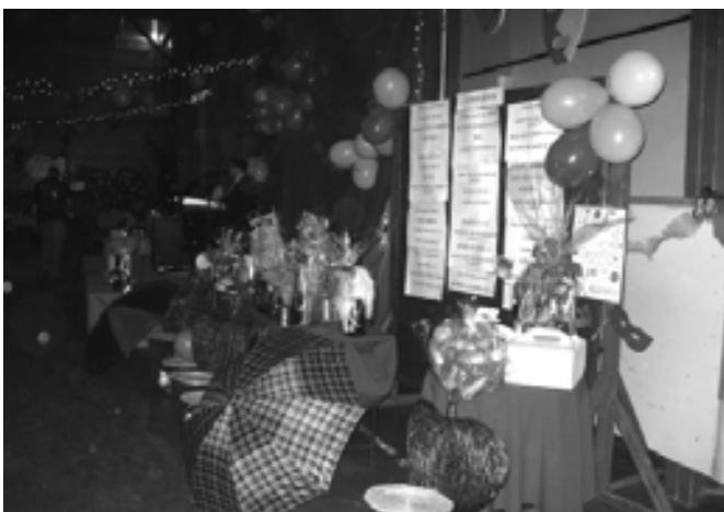
Ami szem-szájnak ingere