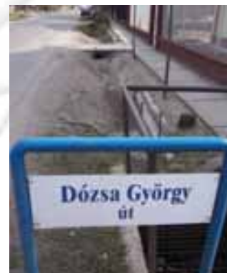
Nem a teljes Dózsa Gy. úton lesz betonbélés az árok

Három közül a belvíz-pályázaton sikerült eredmény elérnünk. A beruházás teljes összege 124.651.111,- forint, melyhez 90%-os támogatást kapunk, amelynek összege így 112.186.000,- forint. Az önkormányzati önrész 12.465.111,- forint. A kivitelezés még ebben az évben megkezdődik, és az új vízelvezető hálózat reményeink szerint átadásra is kerül. Az önrészt az önkormányzat a 2009. évi költségvetésében biztosította.