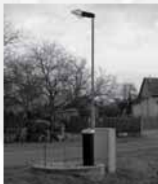
Szakértők vizsgálják a szennyvízkezelést

» A szennyvíztisztító telep környékén lakók közül többen jelezték, hogy a nyári időszakban többször kellemetlen szag érezhető a területen. Hogy a későbbi