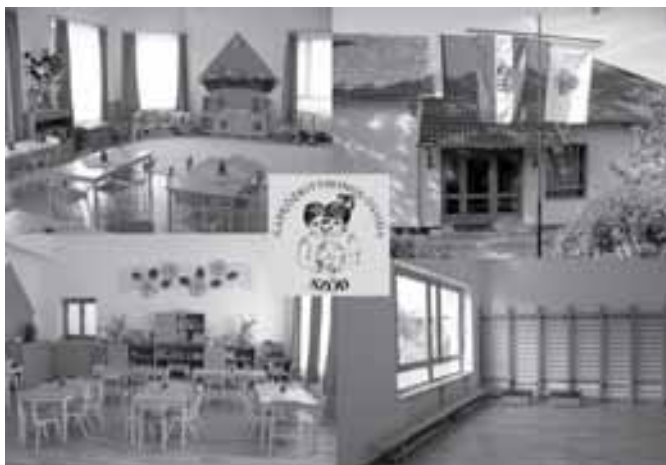
Az óvoda új szárnya

„Mi nem csak ígérünk, hanem teljesítettünk is.”