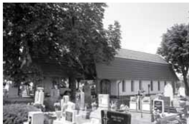
A bővített ravatalozó