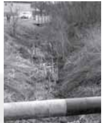
A Tece-patak kotrására is pályázni kell

mint minden olyan területre vonatkozóan, amely Sződ község fejlődését segíti elő.