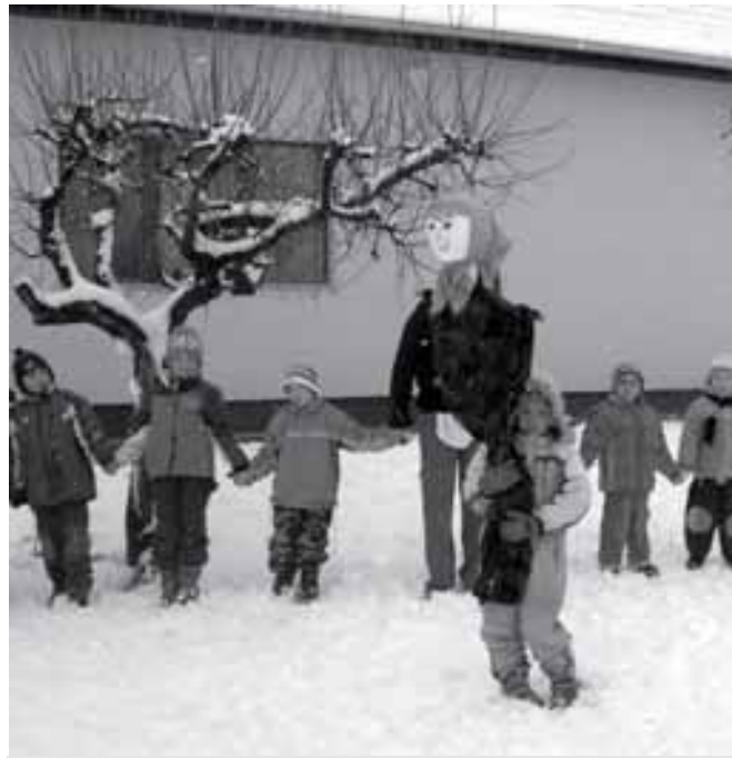
Viszik a Kiszét, várják a tavaszt

Kisze, kisze áldozat, Tűz emészt, nem kárhozát Emléked még bennünk él, Eltűntél már, mint a tél!