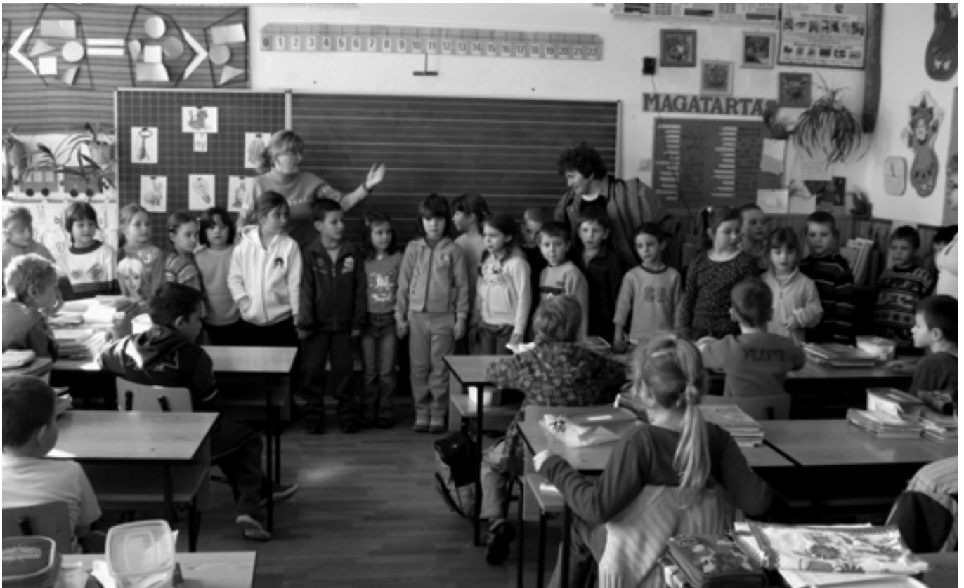
Mikor a tanító néni és az óvó néni együtt van