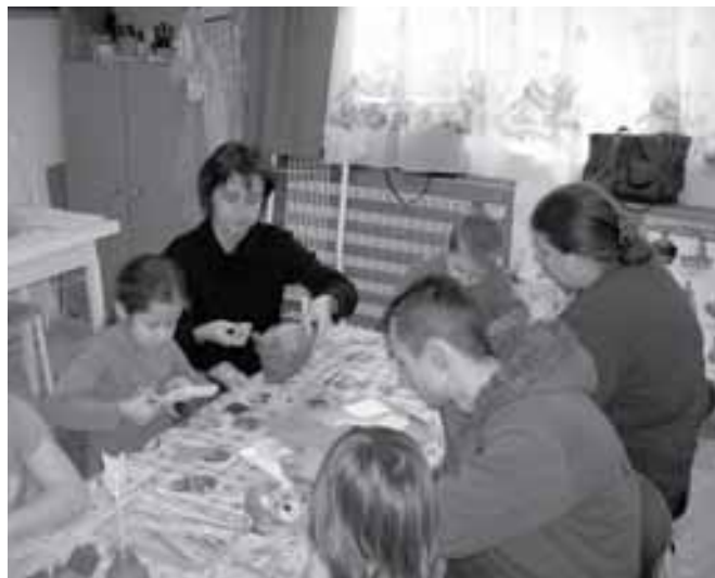
➡ Szülői segítséggel készülnek a maskarák ➡

Rendhagyó napra ébredtünk 2009. január 13-án. Az óvoda lehetőséget adott a szülőknek és gyerekeknek arra, hogy nyílt nap keretein belül együtt készüljünk a farsangra. Gyermekimmel frissen, vidáman érkezünk az óvodába. A kisebbik fiam Csig csoportos, megbeszéltük, hogy itt kezdjük a napot. Mikor beléptünk a terembe, jókedvű szülők, izgatott gyerekek kavalkádja fogadott. Nagy volt a nyüzsgés az asztalok körül. Vonzották a