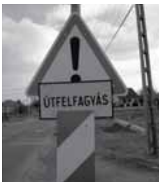
A kátyúkra nem a táblák jelentik a megoldást

» Reményeink szerint még ebben az évben elkészül a Dózsa György út felújítása az