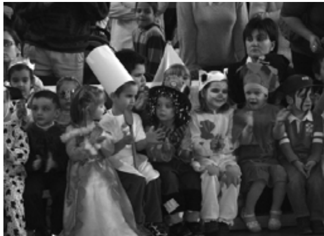
➤ Vígsg legyen! ➤