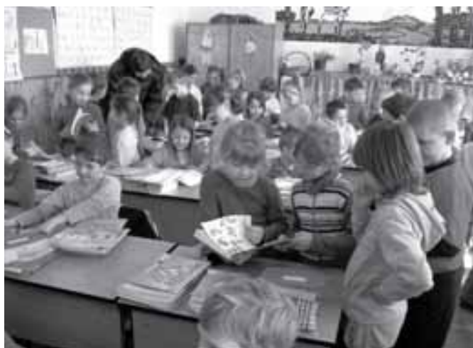
Ismerkedünk a tankönyvekkel