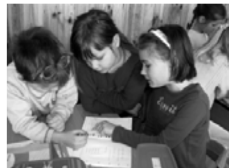
Ti is így fogtok számolni!