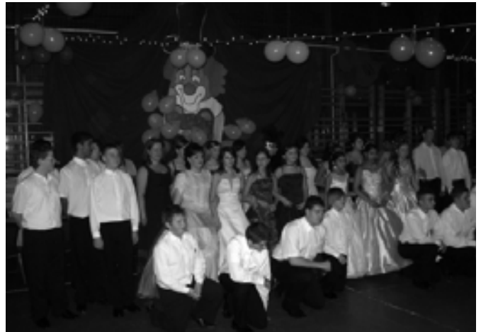
A nyitótánc nyolcadikos fellépői