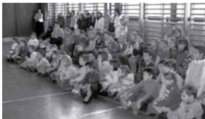
Micsoda nagy érdeklődés!