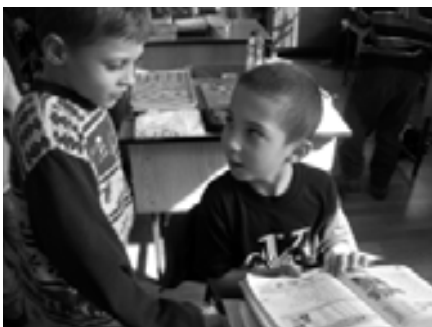
Látod, ezt fogod tanulni