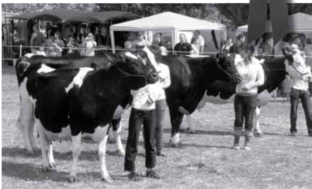
Az iskola tenyészetének példányai