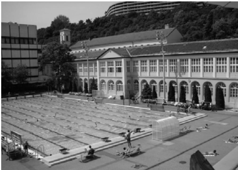
A Császár uszoda

ahol szerkesztőként dolgoztam. Itt a munkám során az összeszerelési rajzokból kellett kibontani a vasszerkezeti lakatosoknak a szerkezeti rajzokat. A kollégák közül szinte mindenki tanult, és én is úgy éreztem, hogy többre vágyom. A vezetők próbálkozásomat egy kézlegyintéssel intézték el, mondván: nem fognak felvenni, mivel nem jártam előkészítőre. A kételkedőknek nem lett igazuk, mivel felvettek a Budapesti Műszaki Egyetemre és 1975-ben épületgépész szakon itt szereztem első diplomámat. Folyamatosan kialvatlan voltam a heti háromszori, késő estébe hajló iskolai konzultáció és a munkahelyi feladatok ellátása miatt. Bár nem vagyok egy vándormadár típus, innen a Gyermekélelmezési Vállalathoz kerültem. Itt huszonhét évesen, friss diplomával műszaki vezető lettem. Főzőkonyhák fejlesztésével foglalkoztunk, és úgy éreztem, szaktudásom kevés, csupán a gépészeti ismeretek nem elegendőek a felelős döntések meghozatalához. Ismét