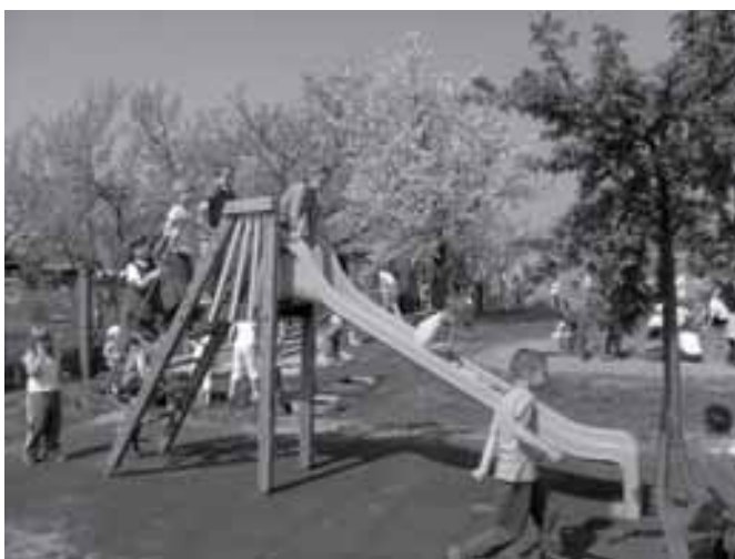
Elkészült az új csúszda