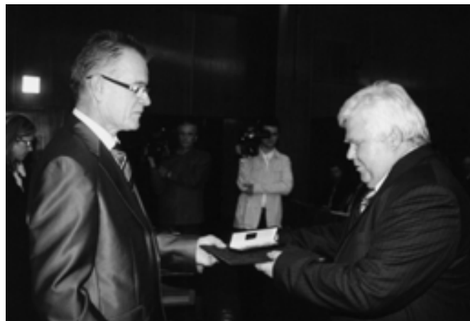
Gyenesi István önkormányzati miniszter gratulációja

A kétezer lakos fölötti önkormányzatoknál kötelező pénzügyi bizottság létrehozása. Ez Sződön sincs másként. Melyek a legfőbb feladatai az önkormányzat legfontosabb bizottságának, és mit takar az ügyrendi fogalom?