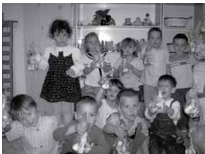
Húsvét a Süni csoportban