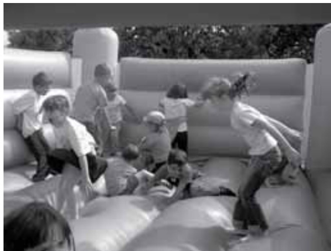
A Kölyökidő Szabadtéri Játsszóház meglepetése