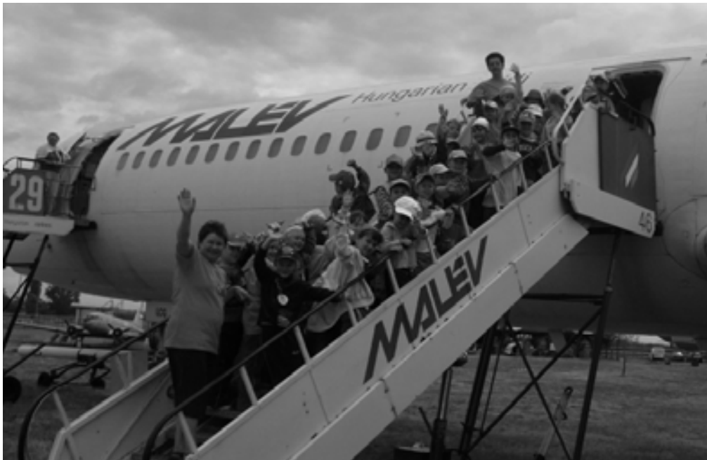
Felszálltunk... a repülőre