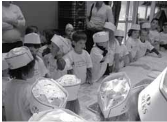
Készülnek a pályaművek a KRESZ-napra