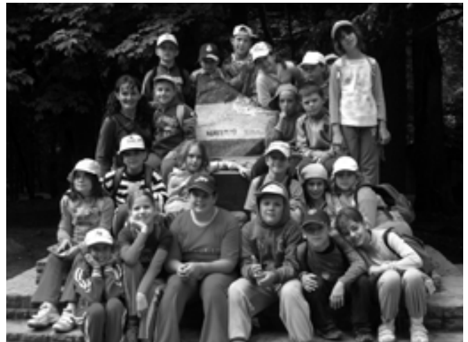
A világ tetején

úszó poloskát, láttunk gőtét, felmáztunk a fellegvárba, gyújtottunk tábortüzet, és természetesen nagyon jókat játszottunk.