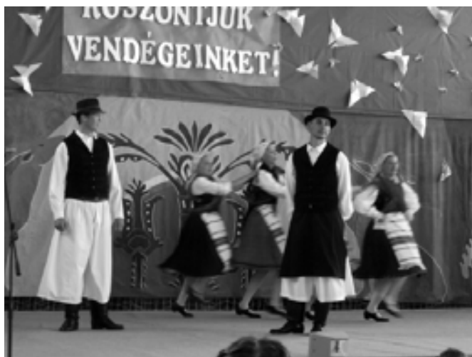
Szódi Szita Táncgyűttes