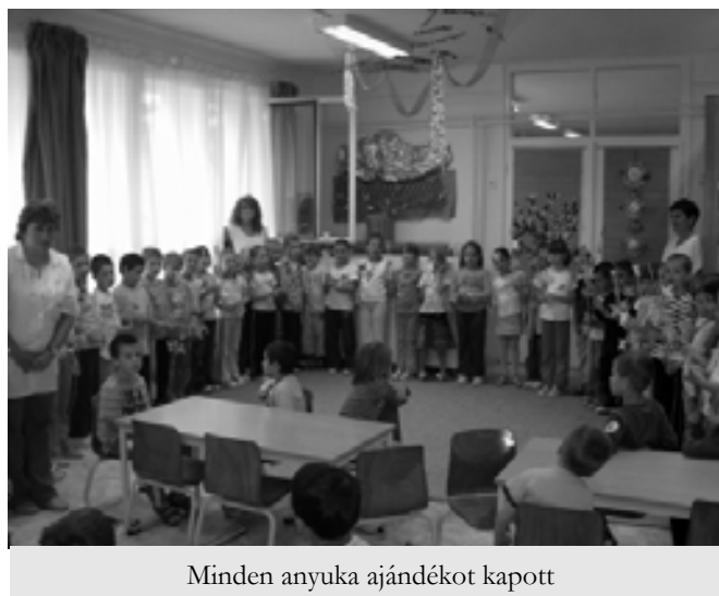
Minden anyuka ajándékot kapott

Az ünnepség tökéletesre sikerült. Különösen tetszett, hogy a szülőket is bevonták a játékba. Megható és meghitt pillanat volt, amikor kisfiam az ölemben ülve velem játszott el egyik kedvencét, a „sima út-göröngyös út”-at. Majd körjátékokat adtak elő. Felszabadultan, boldogan énekeltek, felcsendültek olyan gyermekdalok, amiket az utóbbi időben kisfiam otthon a kistestvéreinek tanítgatott. Nagyon élveztem az egész műsort. Kedves, megható, de mégis pörgős és színes volt.