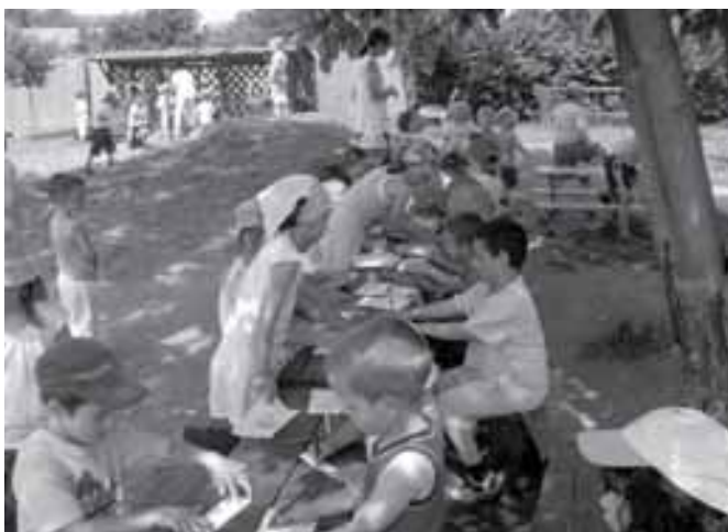
Készülnek a pályaművek a KRESZ-napra