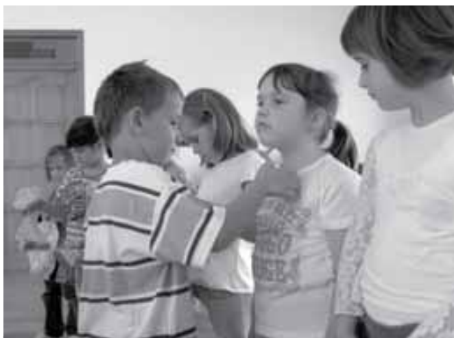
A lányok most sem hervadtak el

kedtek gyermeknap alkalmából a sződi gyerekeknek. Kirándulni indult óvodánk apraja-nagyja. Volt, aki buszra ült, aki vonatra szállt, és a