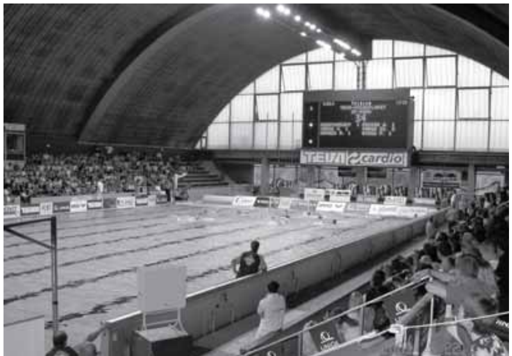
A Komjádi uszoda