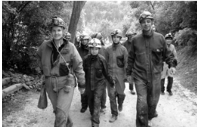
Úton a barlang felé teljes felszerelésben