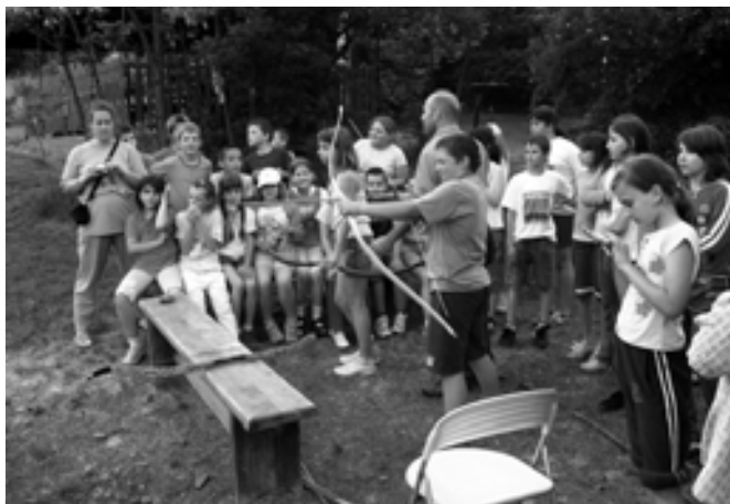
A jövő Tell Vilmosai