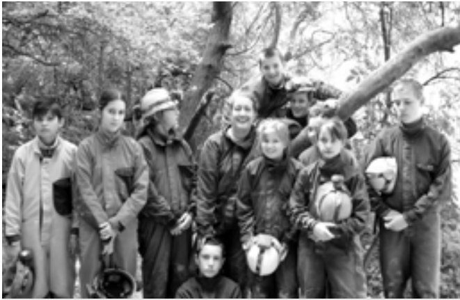
Jól szolgált a sisak és az overál