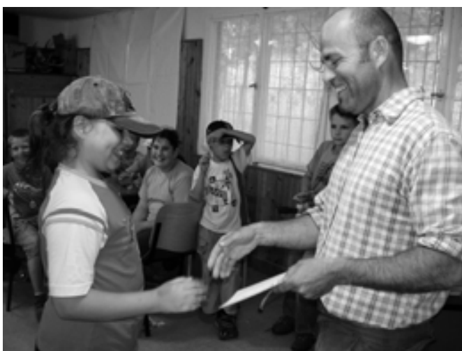
Erdei emléklap átvétele