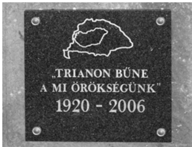
A sződi első világháborús emlékmű Trianoni emléktáblája