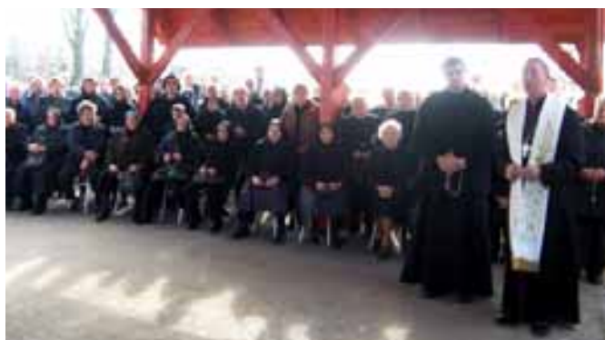
Zömmel az idősek jöttek el a szentelésre

totta a mindennapi életitmust. Harangoztak reggel, este, misék alkalmával, halálesetkor, egyházi és világi méltóságok érkezésekor. Harangszó közszöntötte a győztes csatából hazatért harcosokat és harangszó figyelmeztetett a közelgő ellenségre, vagy tűzvészre. A 18. században Sződön a közelgő jószágvészre is a templom Szent Vendel harangjával hívták fel a figyelmet.