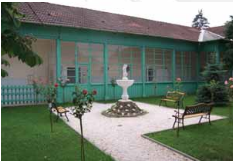
2008-ban újult meg a hivatal udvara