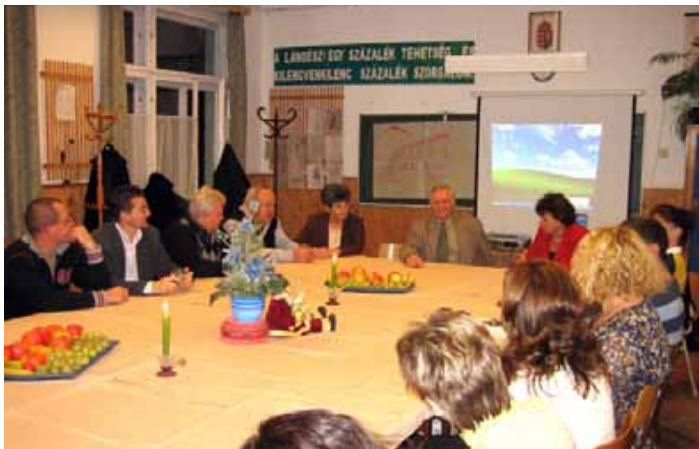
A képviselő-testület látogatása intézményünkben

Szóval ez egy varázsköpenyeg, akkor ezért nem adtad nekem.