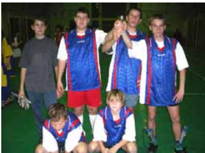
A sződi nyerők

A váci kistérségi Sportkoordinációs Bizottság 2008. évi utolsó sportrendezvényét szervezte meg november végén a váci sportcsarnokban és a Boronkay Gimnázium tornacsarnokában, négy korcsoportban huszonhat csapat részvételével. Öröm volt nézni, hogy milyen lendülettel és önbizalommal játszottak a Di-