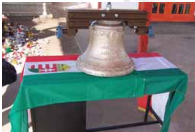
A temető lélekharangja

Tervezett beruházásaink egy részét sikerült megvalósítani.