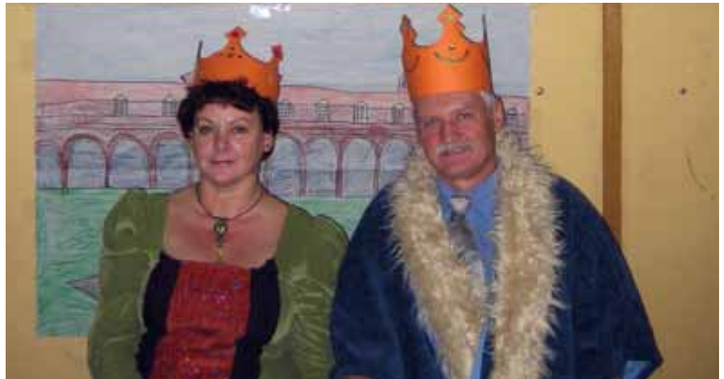
Beatrix királyné és Mátyás király valahonnan ismerősek

2008. október 10. - minden Hunyadis számára egyet je-