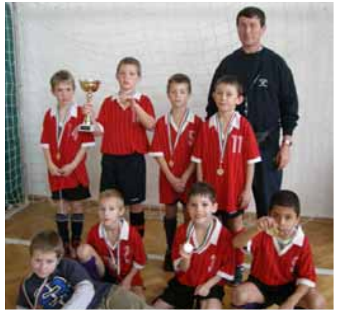
Az aranyérmes hunyadisok