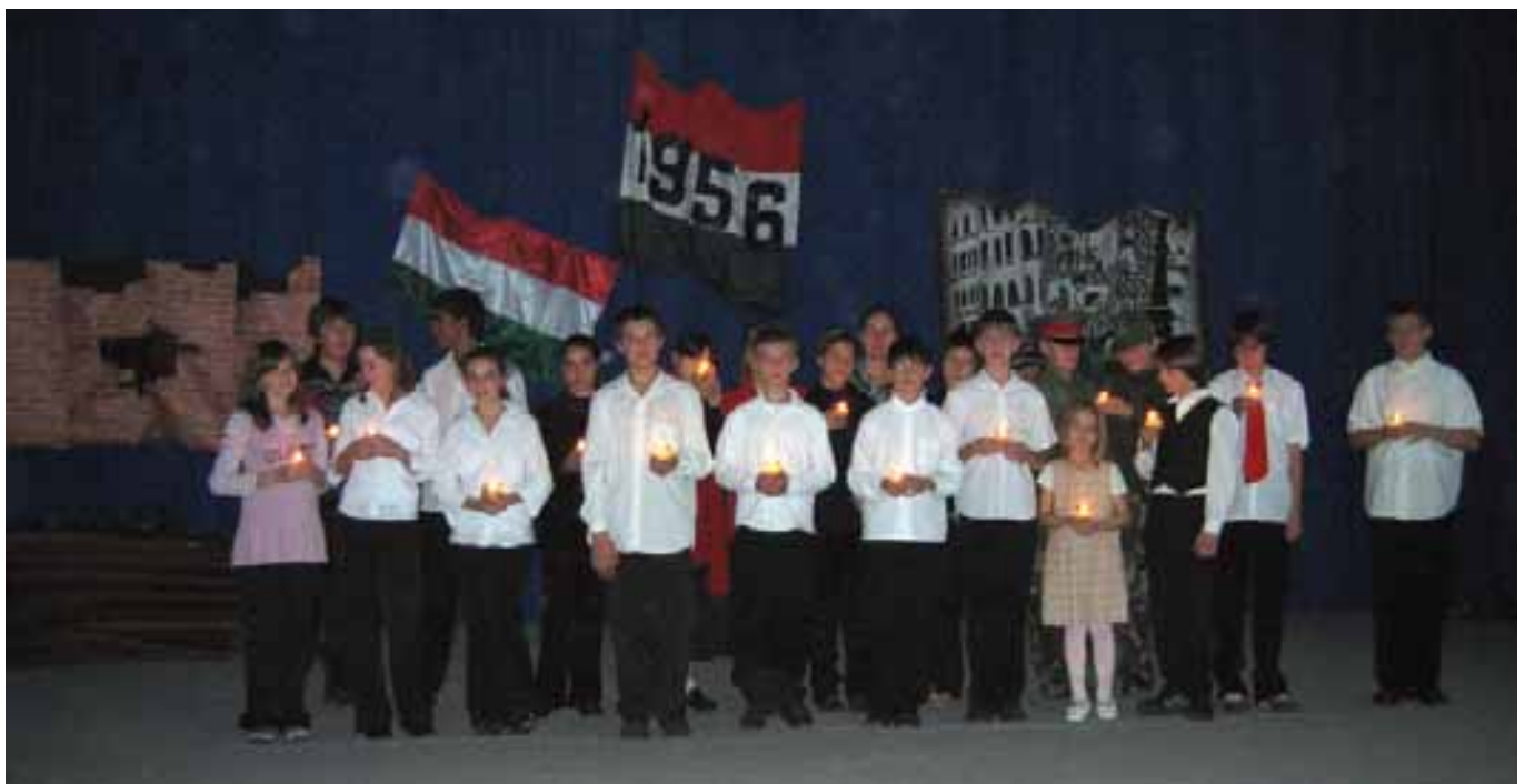
’56 forradalma élő emlék

Azok a szövidiek, akik időt, fáradságot nem kímélve megtisztelték jelenlétükkel a községi ünnepséget, a záróképben, gyertyával a kezükben álló gyermekek arcáról leolvashatták, hogy hozzájuk érkezett – nemcsak – a dal, hanem az emlékezés üzenete is: