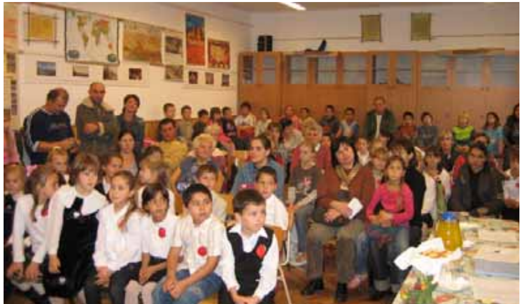
A szavalóverseny nézői

Ezen a napon nemcsak a gyerekek kaptak ajándékot,