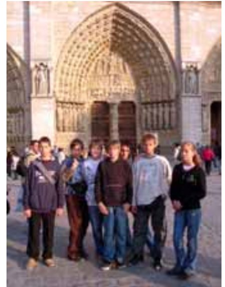
Az angliai út állomásai képekben

indultunk, élményekkel gazdagodva hazafelé.