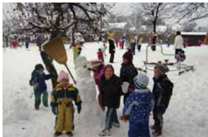
Az első hónap örültek az ovisok