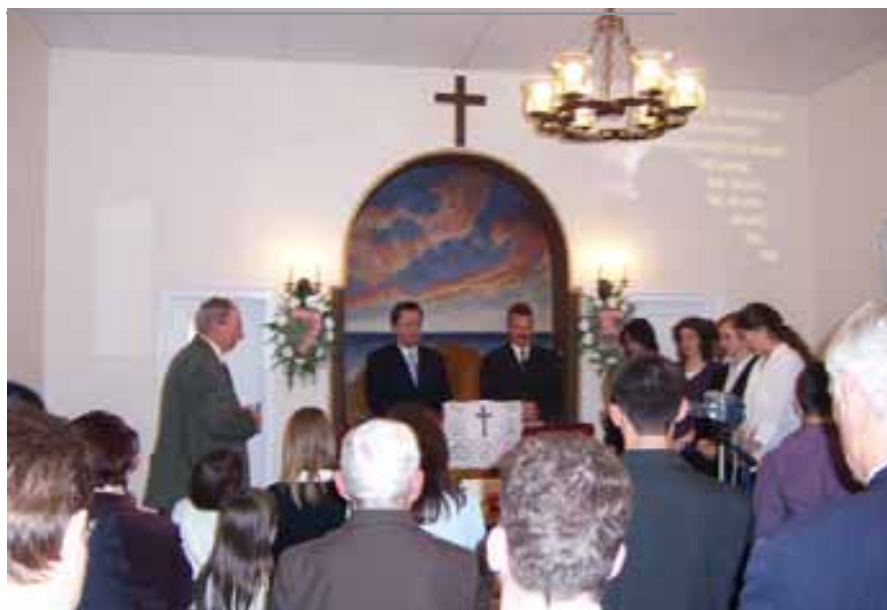
Ünnepésre gyűltek össze