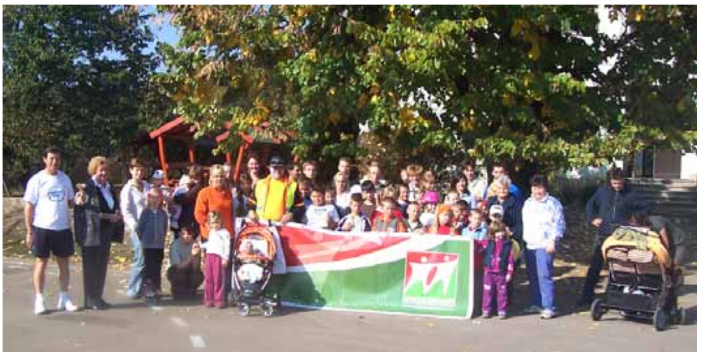
A résztvevők és kísérőik az iskola udvarán