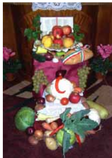
Az Úr ajándékai