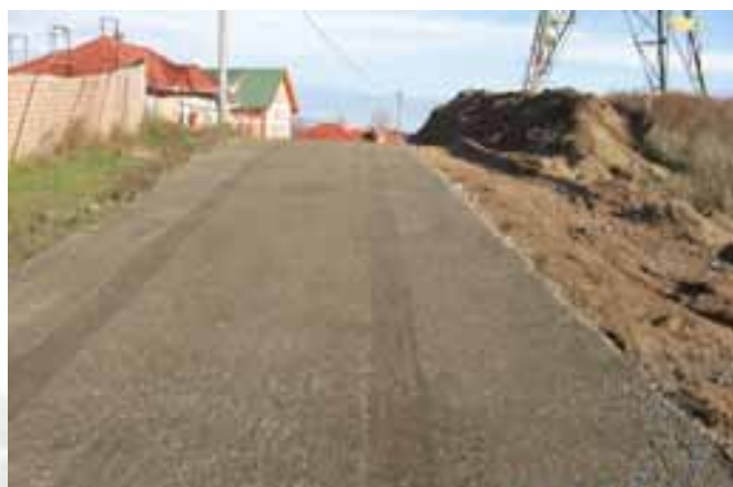
Ismét növekedett az aszfaltozott utcák száma