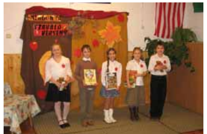
A szavalóverseny legjobbjai