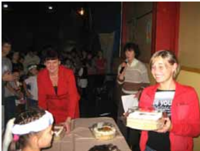
Képek a reneszánsz zárónapról (fent és lent)