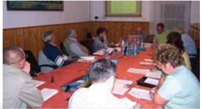
Feszített tempójú volt az év végi hajrá a képviselő-testületi üléseken