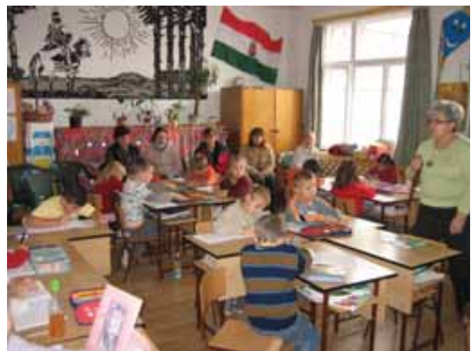
Óvodás gyermekek szüleinek látogatása

Falun élünk, így intézményünk nem csak a közokta-