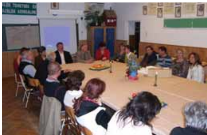
Oldott volt a légkör az iskolában is

November hónapban a képviselő-testület tagjai kérésére informális megbeszélés történt az óvodai és az iskolai tantestületekkel. Az aktuális kérdéseken túl oktatási kérdésekről és intézményfejlesztési elképzelésekről esett szó.