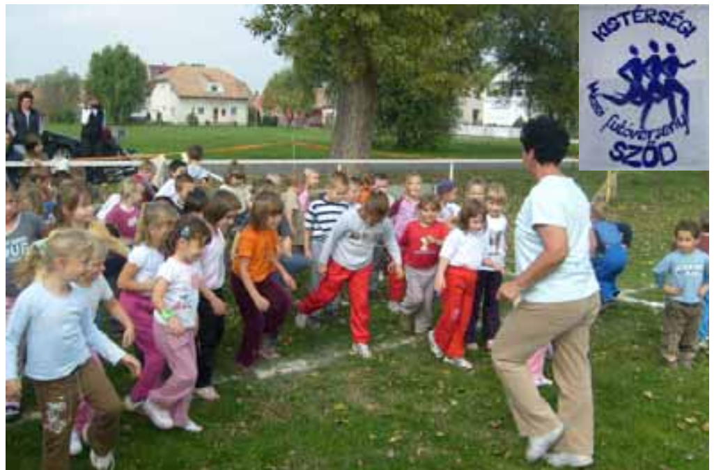
Startra készen a kicsik