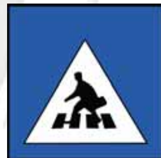
2009-ben alakítják ki a gyalogátkelőket

A Dózsa György út felújítási terveit a Közútkezelő Kht. még ebben az évben elkészítette, az út tervezőjénél az önkormányzat 1 millió forintért megrendelte a Dózsa György úti óvoda és iskola előtt gyalogátkelőhelyek terveit. A