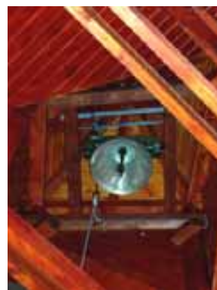
Helyére került a harang

A harang félreverésnek a régi időkben volt jelentősége. Ilyekor a harangokat nem szokványosan szólaltatták meg, hanem többször rendszertelenül megszakították. A múltban nagy jelentőséggel bírt a híradásnak ez a módja. Az élet modernizálása a harangok félreverését szinte teljesen háttérbe szorította. A lélekharang megszólalásának hírközlő jelentőségét pedig a kórházi halál gyakorisága szorította háttérbe. A temetőben található lélekharangnak az a feladata, hogy a ravatalozótól