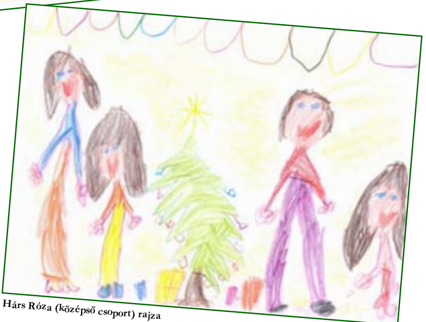
Hárs Róza (középső csoport) rajza