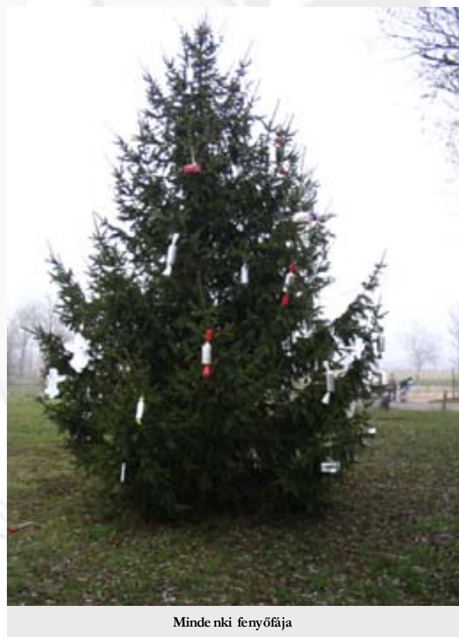
Minde nki fenyőfája

A képviselő-testület sikerként könyveli el, hogy választási ígéreteinek megfelelően, teljes