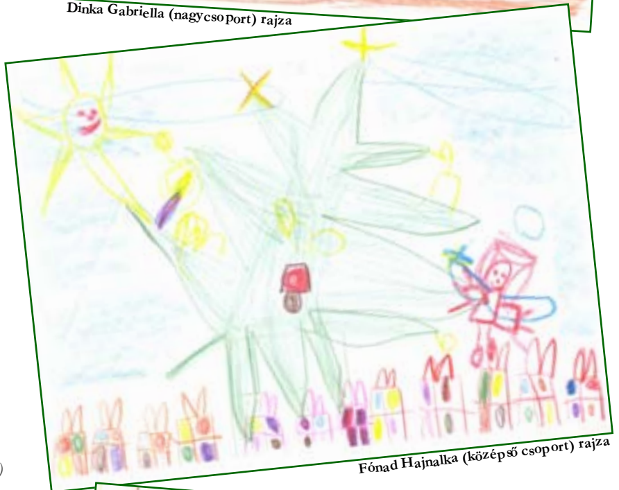
Fónad Hajnalka (középső csoport) rajza