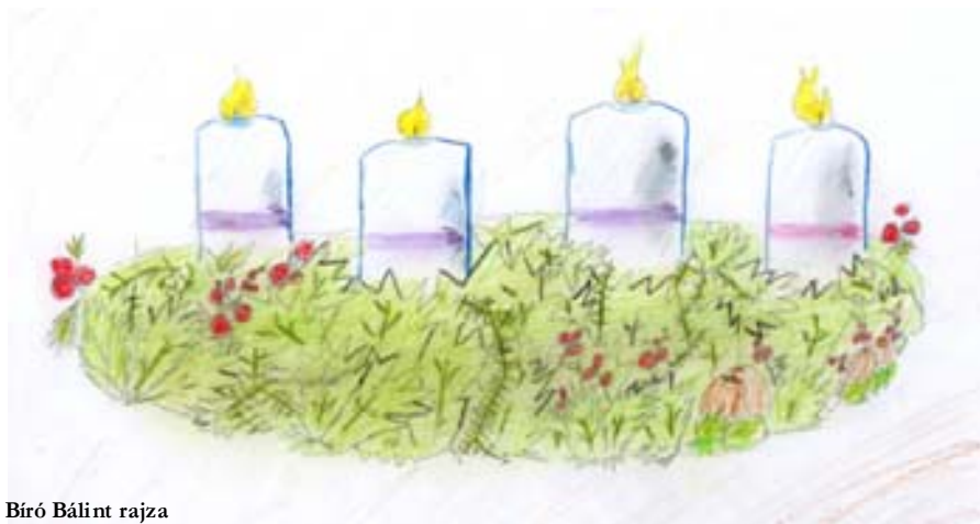
Bíró Bálint rajza

Óhajtozom el a Magasságba, Nagy a csúfság ideleinn, De van Karácsony, Karácsony, Istenem, én Istenem S ember-vágy küldte Krisztusunkat. Két gerlicét vagy galamb-fiókját, Két szívet adnék oda, Hogyha megint vissza-jönné A Léleknek mosolya S szeretettel járnánk jászolhoz. Krisztus kívánata, Megtartóé, Lázong át a szívemen, Mert Karácsony lesz, Karácsony, Istenem, én Istenem, Valaha be szebbeket tudtál. Óhajtozom el a Magasságba Gyermekségemben kötött Mindén szűzséges jussommal, Mert az emberek között Nem így ígértetett, hogy éljek. Követelem a bódító álmot, Karácsonyt, Krisztus-jarat, Amivel csak hűtetettek, Amit csak hinni szabad, Csúfság helyett a Magasságot. Lábainknak eligazítását Kérem én szerelmesen, Karácsony jöjjön, Karácsony És százjézusi seben Nyiladózzék ékes bokréta.