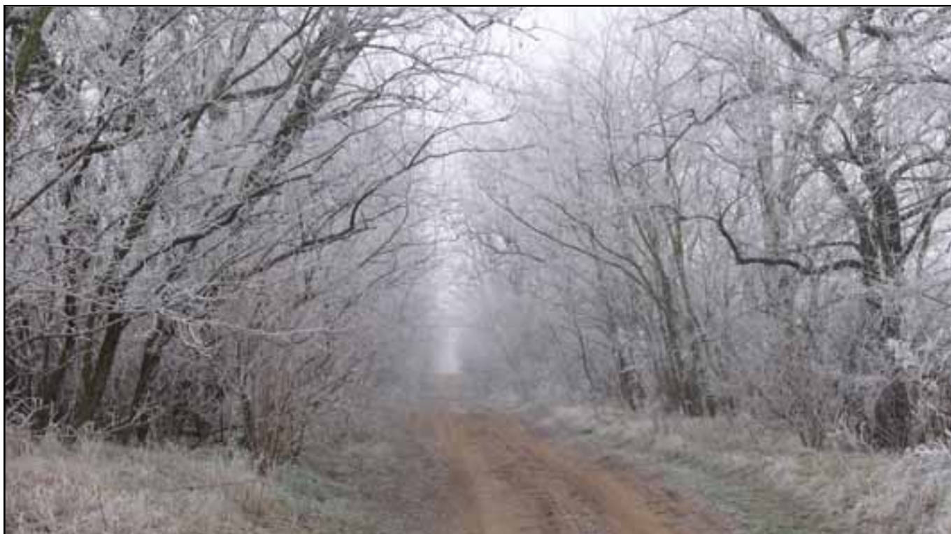
Decemberi pillanatkép