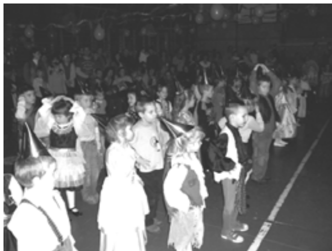
Óvodai farsang (készítette: Volentics Gyula)