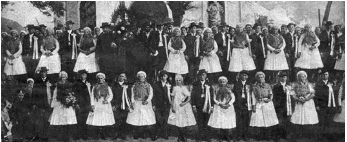
Az 1935. november 11-én Sződön házassult 19 pár adatai