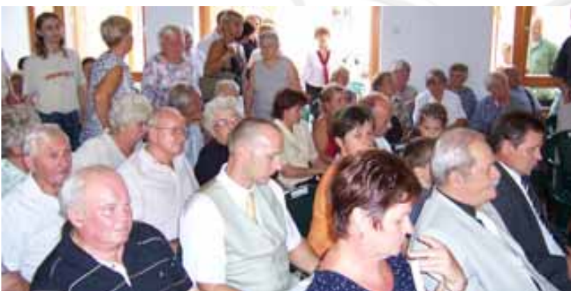
Sokan voltak kíváncsiak az új épületre és az ünnepi műsorra