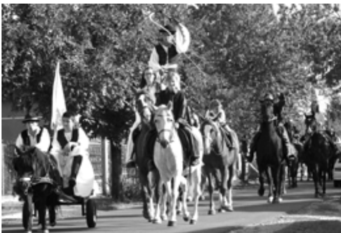
Bejártuk az egész falut