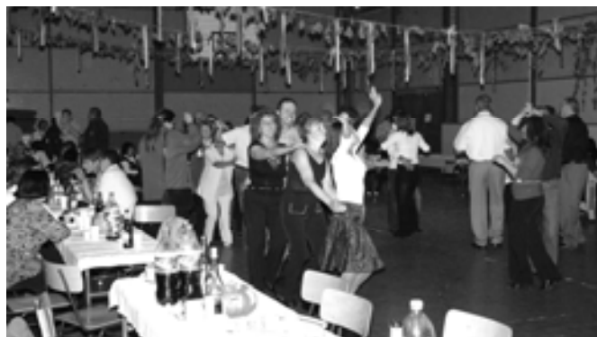
Az esti bál koronázta meg a napot I.