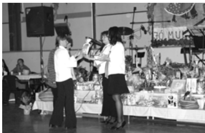
Értékes tombolanyeremények voltak a bálon

A Csupafül Közalapítvány már kilenc éve működik eredményesen. Évről-évre egyre több 1 %-