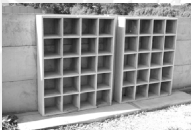
Az urnafal is elkészült