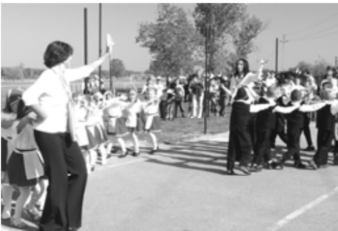
Táncolnak az ovisok I.