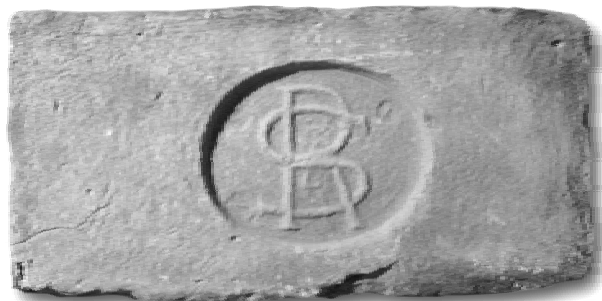
A sződrákosi téglá