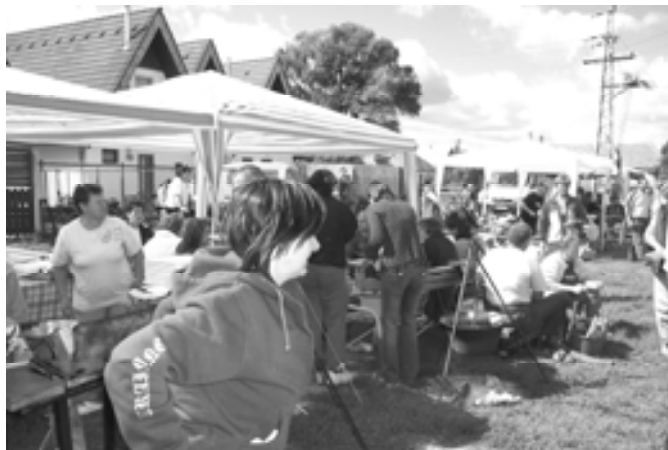
A főzőversenyre ismét megtelt a faluközpont