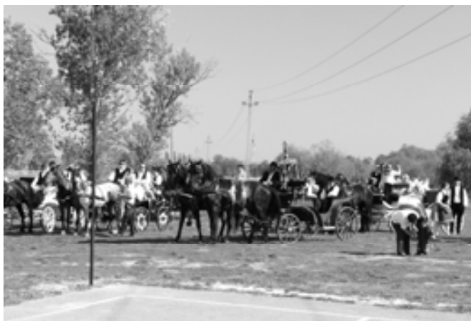
Sokan gyűltünk össze