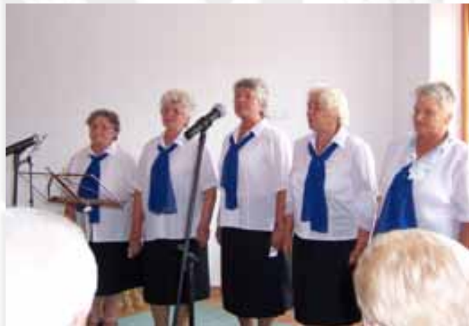
A Szódi Hagyományőrzők is felléptek