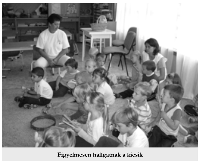
Figyelmesen hallgatnak a kicsik