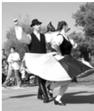
Szódi Szita Táncegyüttes I.