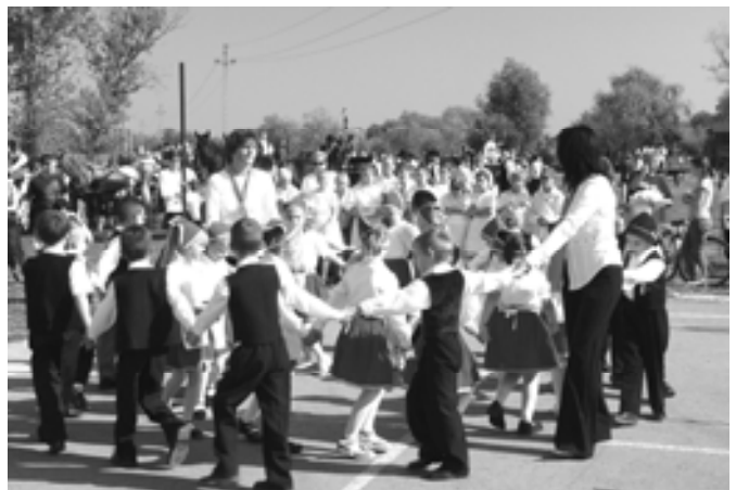
Táncolnak az ovisok II.