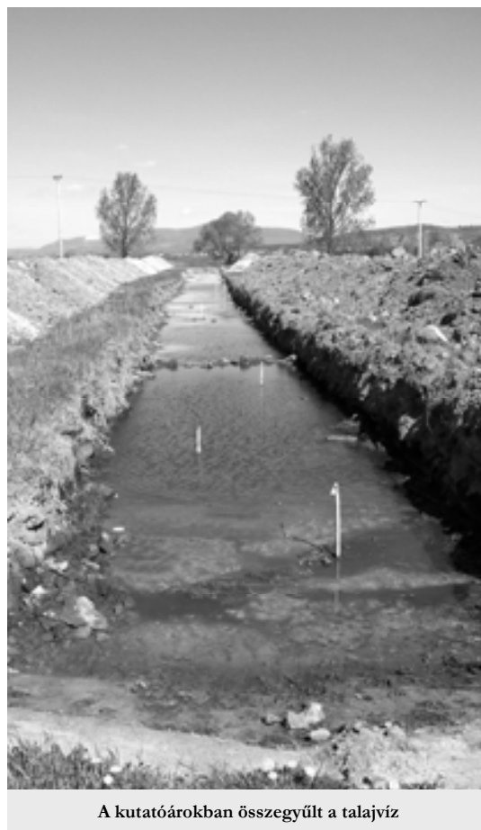
A kutatóárokban összegyűlt a talajvíz