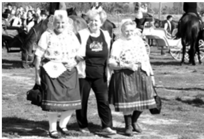
A Szódi Hagományőrzők