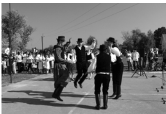
Szódi Szita Táncegyüttes II.