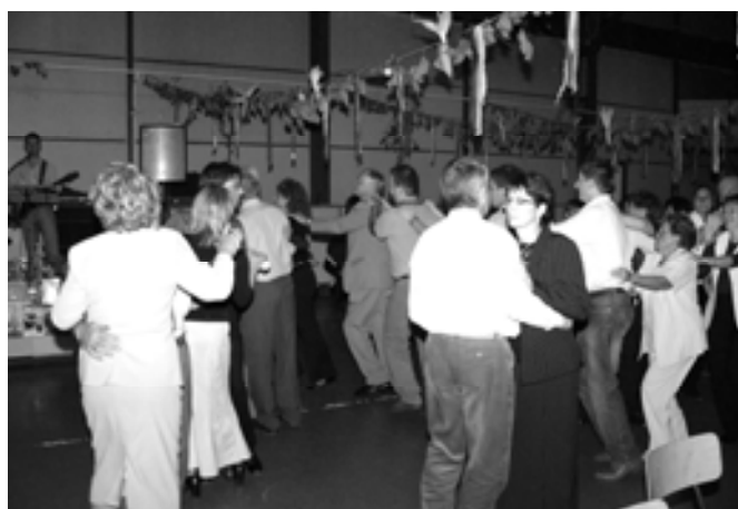
Az esti bál koronázta meg a napot II.