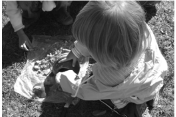
Készülnek a töklámpások II.