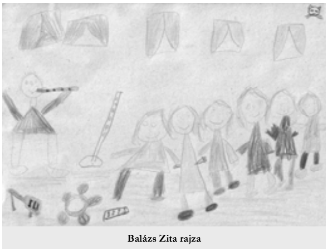
Balázs Zita rajza