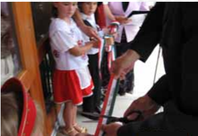
A szalag átvágás ceremóniája