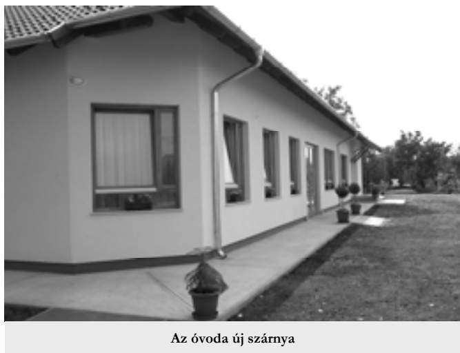
Az óvoda új szárnya

2007. augusztus 1-jén megkezdődött óvodánk 2007/2008-as nevelési éve.