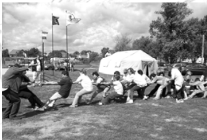
Nyúlik a kötél