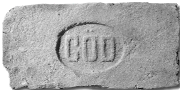
A gödi téglá