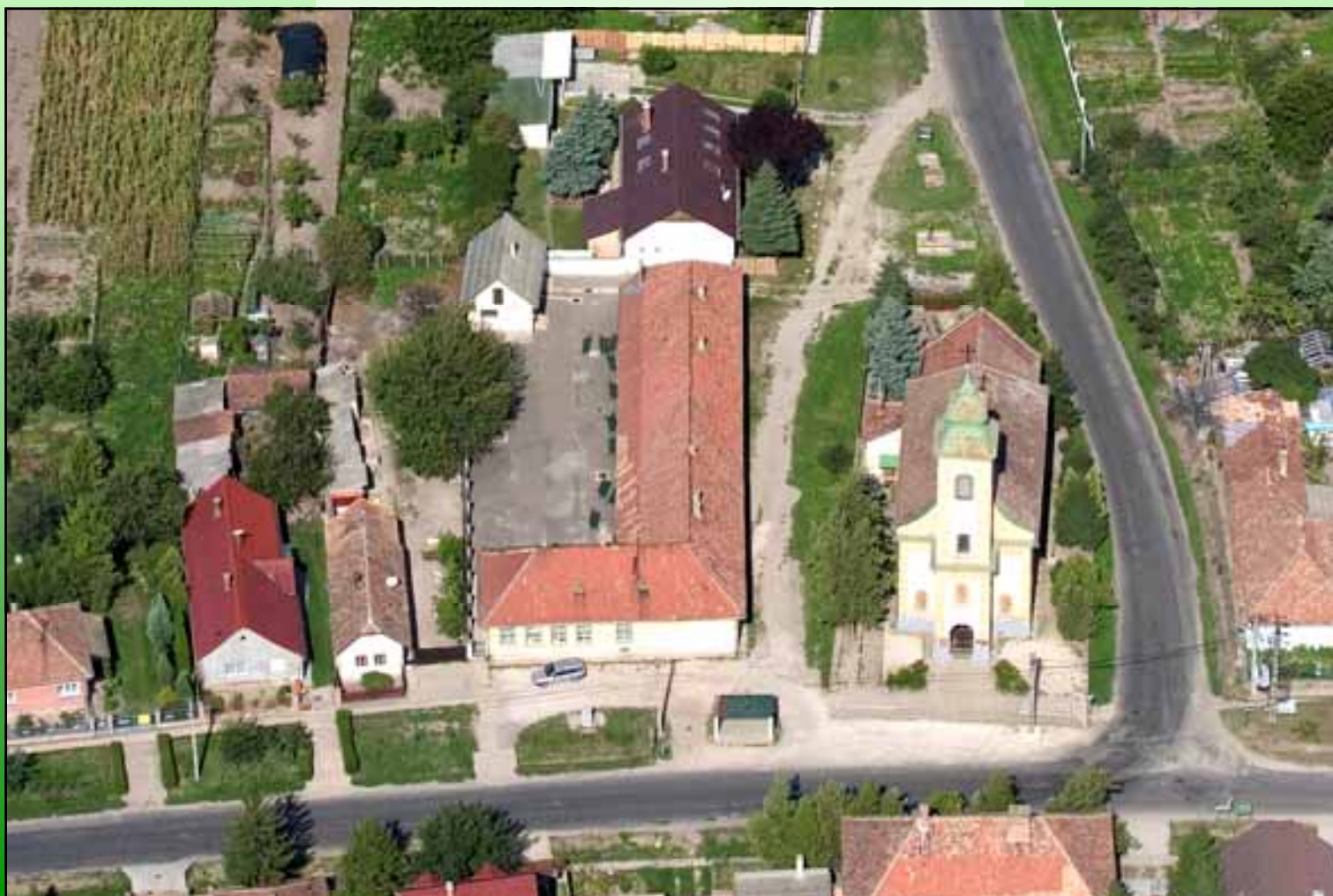
A volt kántor-tanítói lakás, iskola, templom