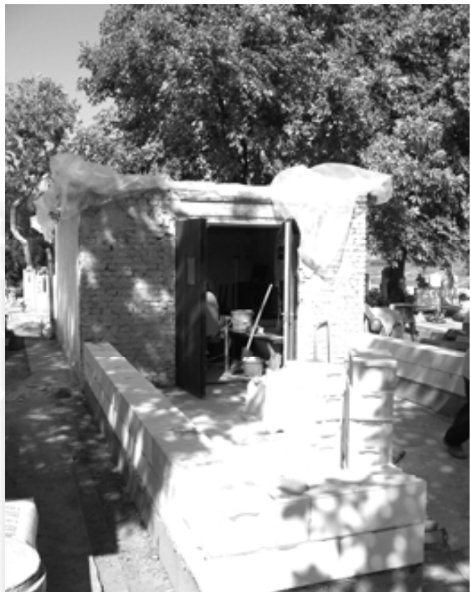
Ravatalozó bővítés I.