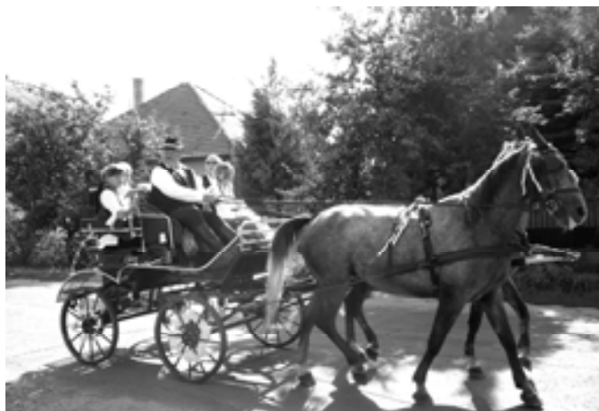
Csattogott az ostor

néni sokat foglalkoztak a gyerekekkel, aminek meg is lett az eredménye, hisz' profikat megszégyenítő műsort adtak elő! Tapsviharral üdvözölte a közönség a produkciót. Őket az idősebb korosztály követte, akik szintén nagy sikert arattak. Az előadás után ismét