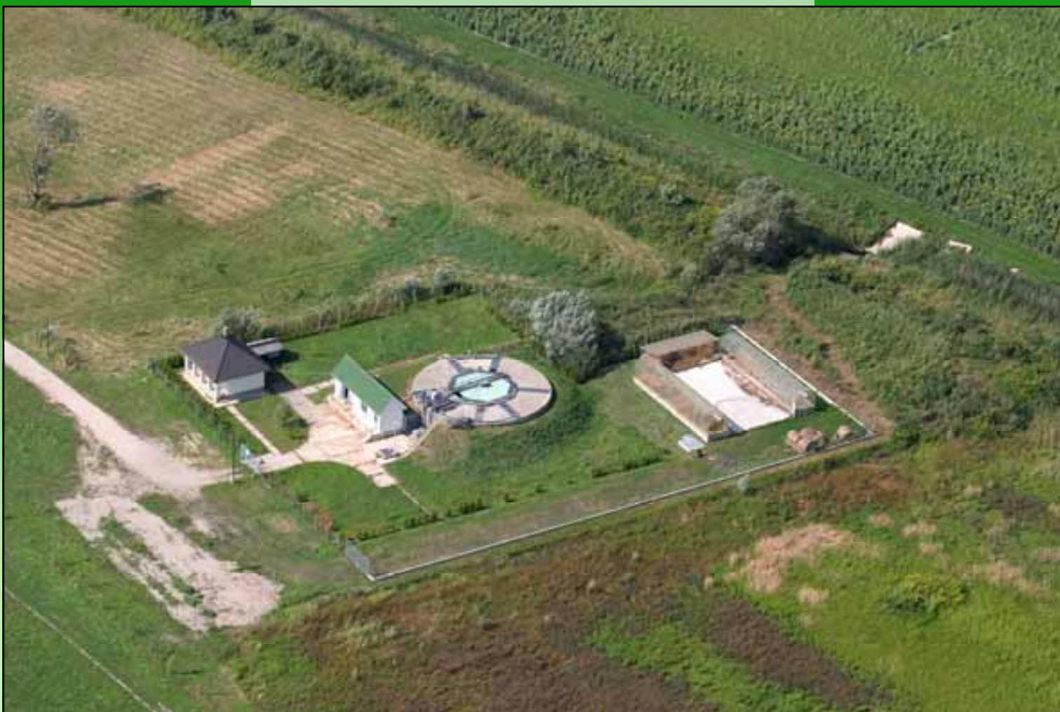
A szennyvíztisztító- és szennyvíziszapkomposztáló-telep