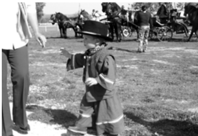
A falu legkisebb csikósa