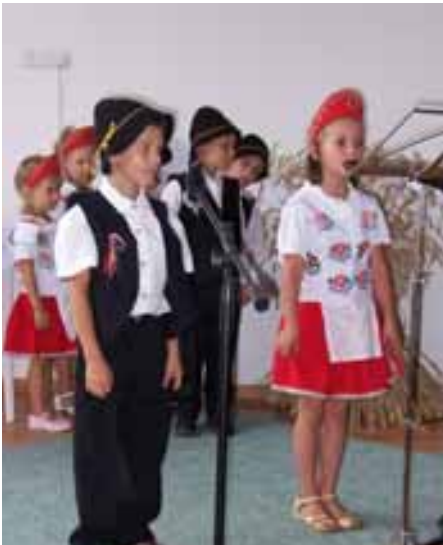
Az óvodások műsorral készültek