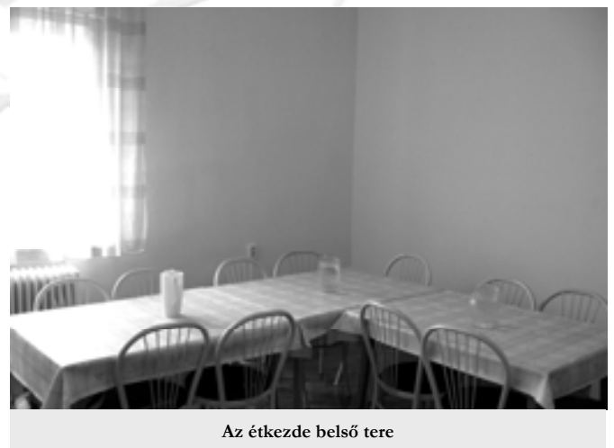
Az étkeзде belső tere

Szintén megoldás született az eddig nagy problémát jelentő utazással, a csörögi gyermekek szállításával kapcsolatban. 2007. szeptember 1-től a csörögi óvodás és iskolaköteles gyermekek utaztatását iskolabusz biztosítja.