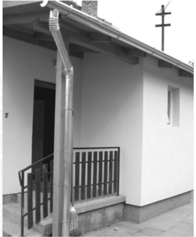
Az új iskolai étkeзде épülete

A régi iskolaépület végleges bezárása miatt más helyet kellett biztosítani az iskolai étkeztetés számára is. Szerencsénkre az orvosi lakás megüresedett, így ideiglenes jelleggel – más lehetőség híján – az