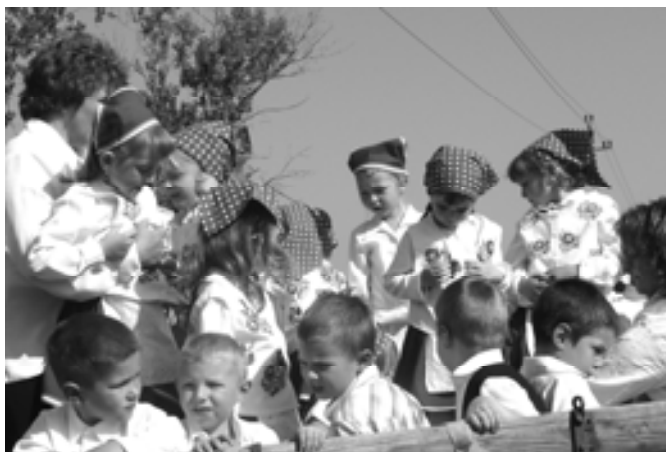
Van még hely a kocsin?