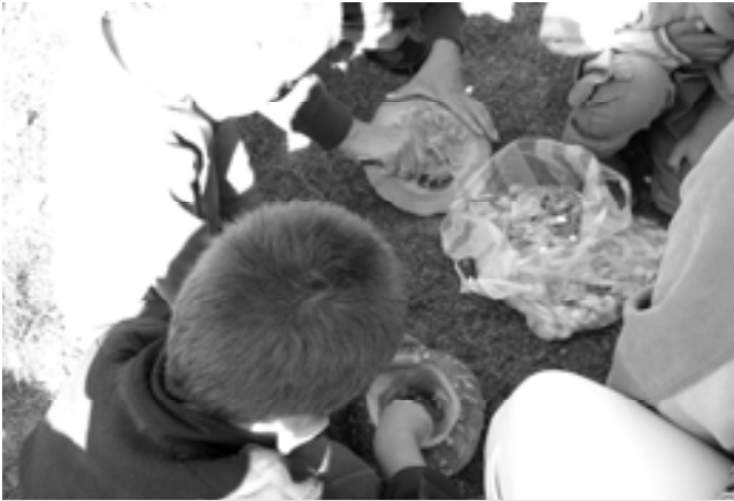
Készülnek a töklámpások I.