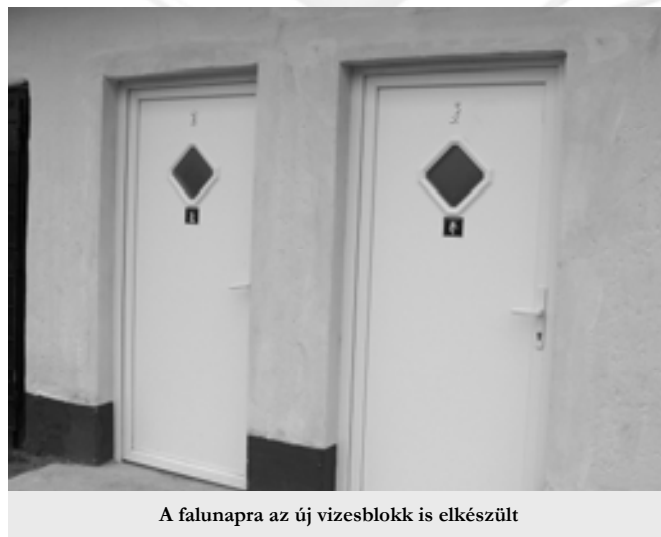
A falunapra az új vizesblokk is elkészült

A képviselő-testület döntött arról, hogy a sportpályánál található, rendkívül rossz állapotban lévő WC-t elbontatja, és ideiglenes jelleggel – ameddig az új faluház nem épül fel – a sportöltözőben alakít ki női és férfi WC-eket. A beruházás 1.560.000 forintba került.