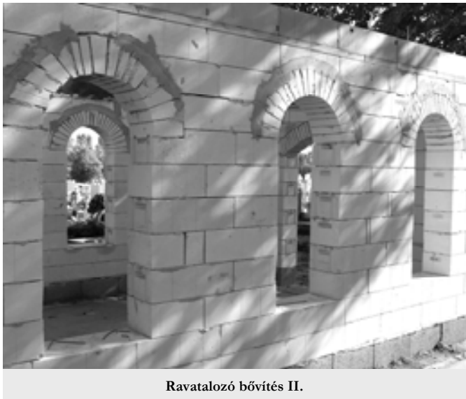
Ravatalozó bővítés II.

se. Az épület kivitelezési költsége 11 millió forint, melynek 60%-t pályázaton sikerült elnyernünk. Ebben az évben mindenképpen tető kerül az épület fölé. Amennyiben az