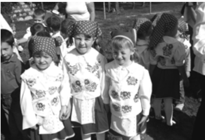
Három a kislány