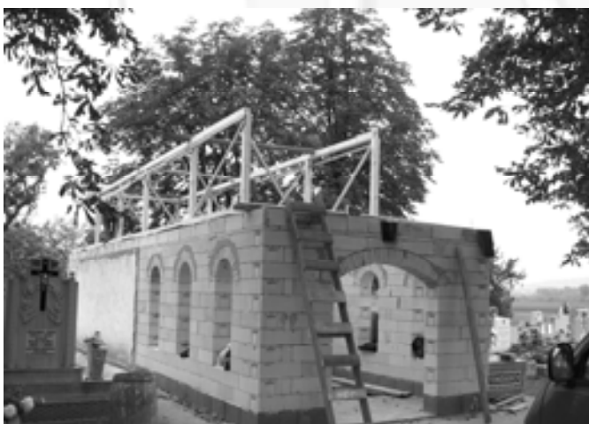
Ravatalozó bővítés III.