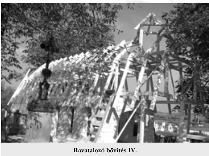
Ravatalozó bővítés IV.