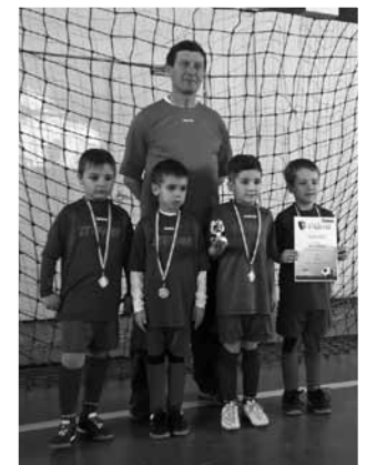
A 2. helyezett U7- es csapat

Gólszerzők: Hóbor 13, Bak és Szabó 6- 6, illetve Kurucz 1