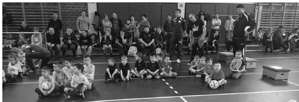
Újévi Kupa, Gödöllő

Szöd - Dömsöd 4 : 1 Szöd - Lőrinc UFC 9 : 0 Szöd - MFS 1 : 3 Szöd - Gödöllő 2 : 3