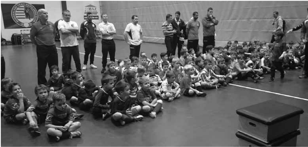
Téli Kupa, Budakalász

Szód – FTC 2 : 3 Szód – Mogyoród 3 : 3 Szód – Erdőkertes 4 : 2 Gólszerzők: Hóbor 10, Szabó 8, Bak 4, Tamási 3, illetve Kurucz és Mójzer 2 - 2