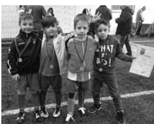
A 2009- es csapat

patok az ellenfelek, ám önbizalommal és fegyelmekkel futballoztunk. A pályán mindenki jól teljesített és küzdött, a tudásnak megfelelő eredmények születtek: