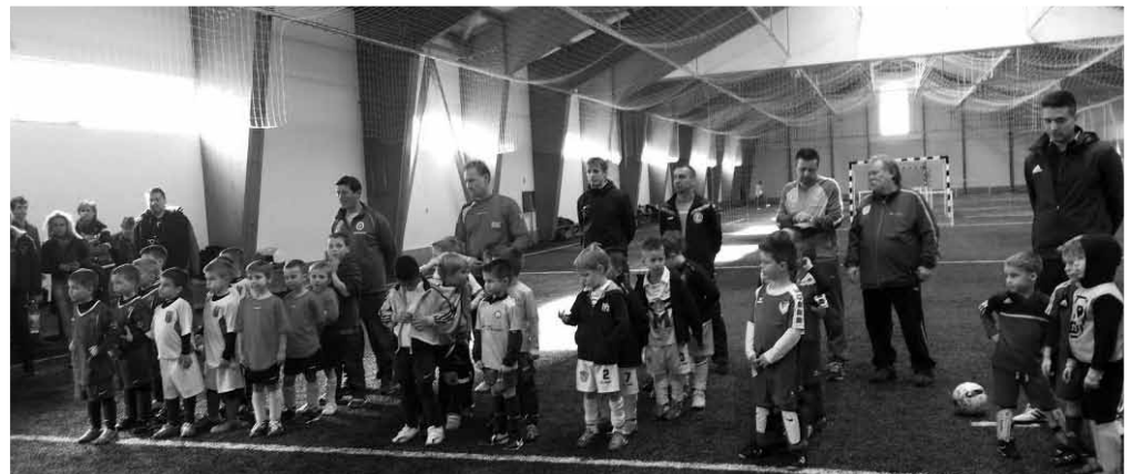
A 2010- es gárda

Szód – Szombathely 5 : 4 Szód – Paks 3 : 1 Gólszerzők: Hóbor 6, Szabó 5, Kurucz és Mójzer 2- 2