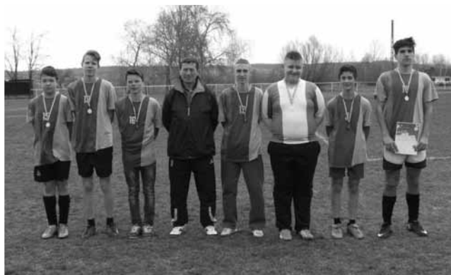
A IV. korcsoportos csapat

A csapatnak nem jött ki minden lépés, nem láttunk kiemelkedő teljesítményt és a