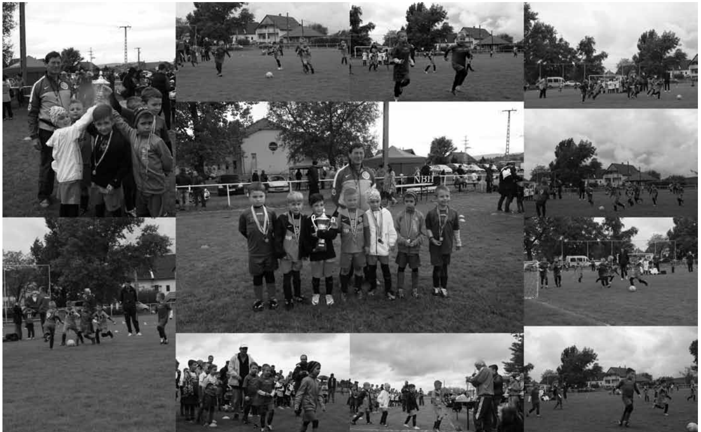
Pünkösdi Kupa, Sződ

Szöd- FTC 1. 4 : 7 Szöd- FTC 2. 4 : 6 Szöd - Törökbálint 14 : 1 Szöd - FTC 1. 3 : 4 Szöd - FTC 2. 4 : 4 Szöd- Törökbálint 8 : 4 Gólszerzők: Hóbor 16, Mojzer