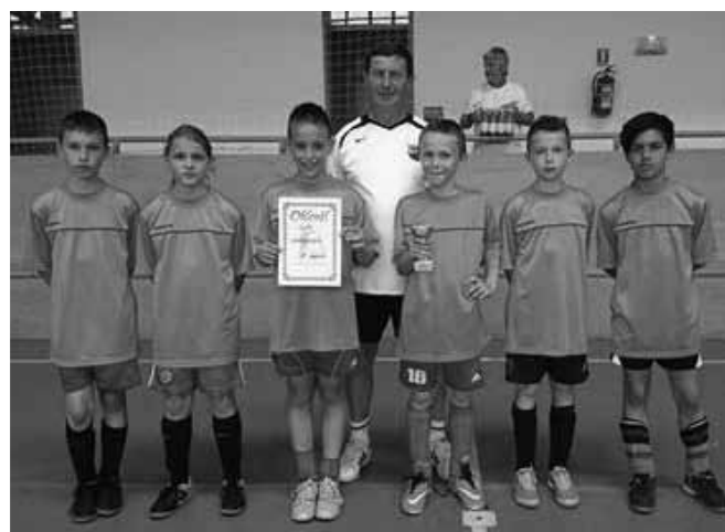
Gyermeknap i teremfoci

Heroikus küzdelem jellemezte idegenben csapatunk játékát, akik egyszerű játékkal győztek és jutottak tovább a megyei területi bajnokságra.