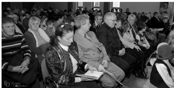
Teltházás Kultúra nap