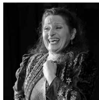
Tokody Ilona operaénekes

• Tokody Ilona Kossuth és Liszt Ferenc-díjas operaénekes (szoprán), érdemes és kiváló művész, a Hallhatatlank Társulatának örökös tagja. Európa és Amerika számos nagyvárosában és operaházában vendégszerepelt. Partnere volt Plácido Domingo és José Carrerasznak. 1992-ben egyik legemlékezetesebb fel-