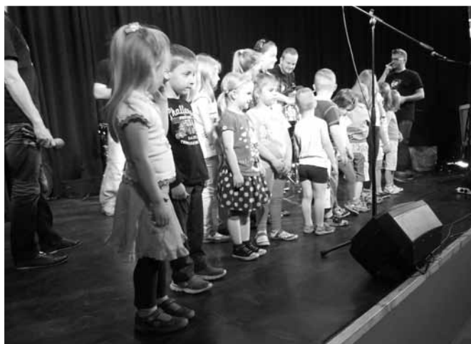
Szódi gyerekek a Talambával

A 2007. év fontos állomás volt az Ütőegyüttes életében, mivel ekkor Gödöllő város kiemelt művészeti csoportja lett, és elkészült az első önálló lemeze, melynek címe: Okamale. A Talamba 2009-ben 10. születésnapja alkalmából elkészítette Babel című albumát, melyet ez év márciusában a legújabb Crossover Live című CD - je követt.