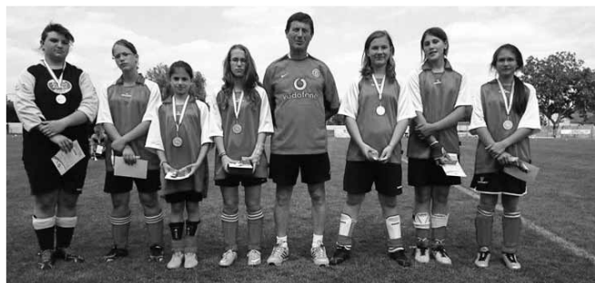
A lelkes leánycsapat Vecsésen