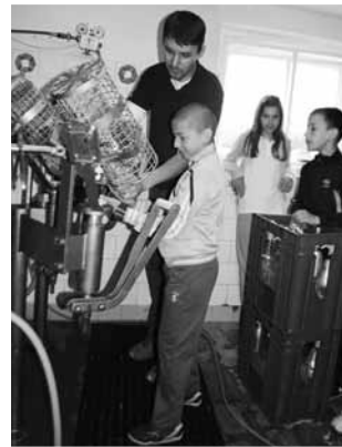
Az egyik Hungarikumunk: a szikvíz