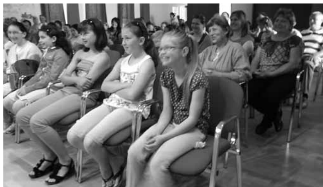
Mókás gyermeknap koncert