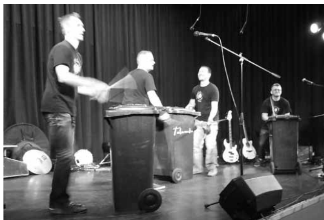
Tombol a Talamba

Csodaszép napra éberdtünk április 30-án. Tündöklő napsütés köszöntött bennünket a szódi Faluházban, boldog gyerekek, kipihent szülők, segítő karitás csoport és kedves óvodapedagógusok társaságában. Az idén nem színházi produkciót, hanem egy csodálatos interaktív hangszerbemutató koncertet kaptak ajándékban a szódi gyermekek. A fellépő zenekar a Talamba együttes volt, aki népszerűségével, tehetségével elkápráztatta a gyermekeket, szülőket egyaránt.