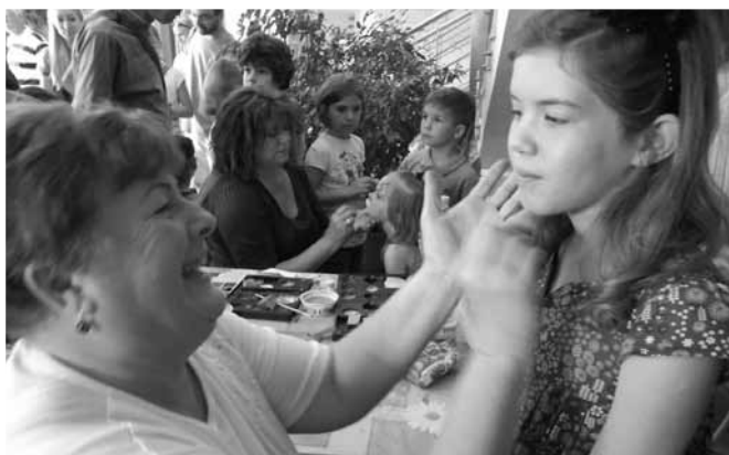
Az óvoda vezető és munkatársai a szódi gyermeknap meghatározó segítségei