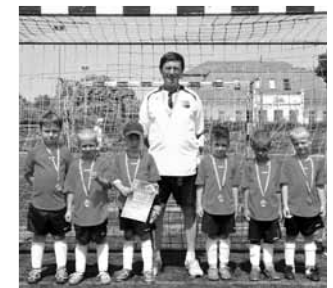
Az U6- os gárda kánikulai melegben elérte a célját

Forró júniusi napon, a tavaszi szezon utolsó tornáján szerepeltünk Gödöllőn amelyen sok rangos csapat mérte össze erejét. A 35 fokos melegben kifejezetten magas színvonalú meccsetek láthatnak a helyszínen látogatók. Az U7- es csapat magabiztos győzelemmel rajtolt, azonban a további csoportmérkőzéseken szoros küzdelemben alul maradtunk. Így csoport harmadikként a 9- 12. helyért folytatott csatában már nem találtunk legyőzőre és a 9. helyen végeztünk