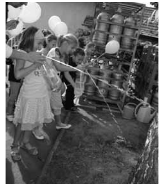
A gyerekek ismerkednek a szódi szikvízüzemmel

zűzem meglátogatása, az ősze tervezett méhészeti bemutató, a sportpályára tervezett selymásműbemutató valamint a projekt zárórendezvénye: az élőzenés táncfalalkozó és táncház is. Ezek mindegyikéhez a szódi iskola és a Faluház biztosítja a