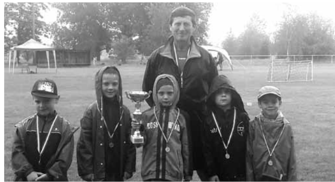
Pünkösdi Kupa- a bravúros U7- es csapat