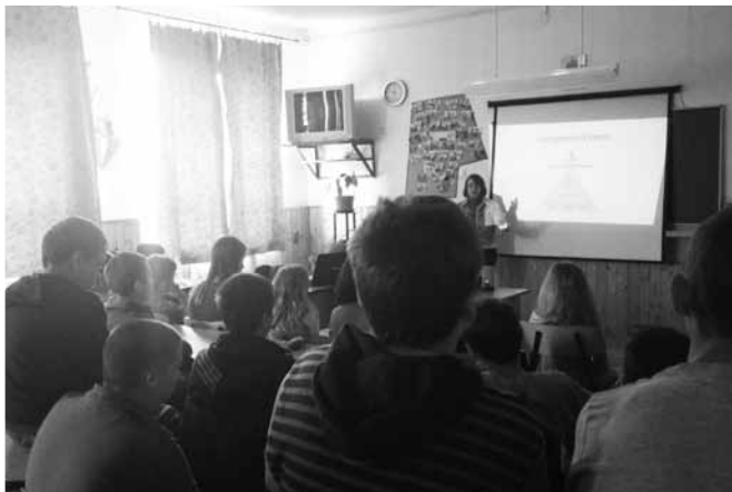
Az iskolában már megtartottuk az előadásokat a Hungarikumokról