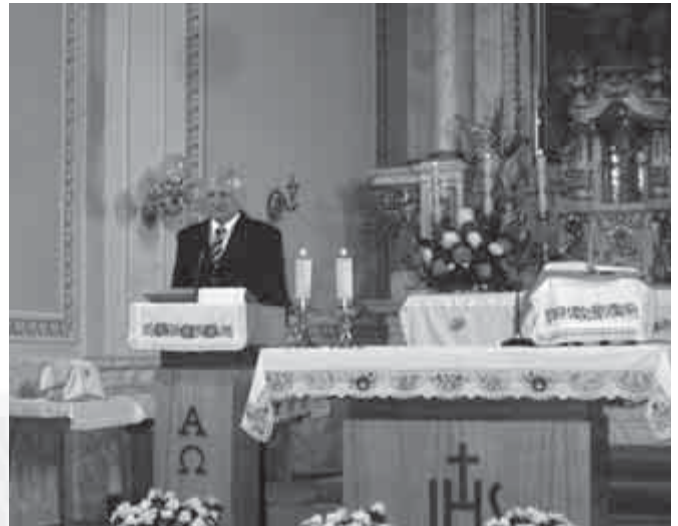
A megemlékezést ezúttal nem szabadtéren tartottuk

Az ünnepet a II. világháborút követően, a kommunista hatalom átvétel után szimbolikus tartalma miatt betiltották, s csak a rendszerváltás után került ismét vissza a köztudatba. Az országgyűlés 2001. június 19. napján fogadta el a magyar hősök emlékének megörökítéséről és a magyar hősök emlékünnepéről szóló törvényt. Ennek értelmében minden év májusának utolsó vasárnapján emlékezünk az elmúlt ezredév magyar hőseire, akik életüket adták a hazáért. Az emléknap