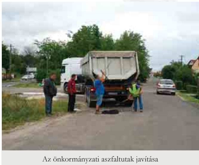
Az önkormányzati aszfaltutak javítása

Ahogy már lapunk előző számában is leírtam, az önkormányzat a hulladék elszállításával kapcsolatban keretszerződést tud kötni, amelynek során megpróbálja a község számára legkedvezőbb díjat elérni. Ez a törekvés magyarázza, miért csak 2014-től kötünk a Zöld Híd Kft.-vel szerződést. Az önkormányzatnak nincs lehetősége arra, és a költségvetése sem nyújt rá fedezetet, hogy a szociálisan rászorulóknak részére egy bizonyos kereten felül további támogatást biztosítson. Az ASA az olcsóbb, 60 literes hulladékgyűjtő edényzetből összesen 50 darab használatát hagyta jóvá. Amikor a kedvezőbb árú, 60 literes edényzetet igénylőket az önkormányzathoz irányítja, abban a tudatban teszi, hogy az önkormányzat határozza meg az igénybevevők körét. Az önkormányzatnak nincs lehetősége arra, hogy ötvennél több igény jogosultságát megállapítsa, hiszen az ASA a jelenlegi szerződésünk értelmében ennél több 60 literes edényt nem fogad el. Mindezek ellenére egyesek újra és újra próbálják bizonygatni, hogy hetente 60 liternél több hulladékot nem helyeznek ki. Ezt mi nem is vonjuk kétségbe, azonban ötvennél több 60 literes edényt csak akkor tudnánk használatba adni, ha a szerződésben szereplő 120 és 240 literes edényzetekre vonatkozó árat megváltoztatnánk. Az ASA ugyanis az egész éves beszámított hulladék súlyának figyelembevételével határozta meg a különböző méretű edényzetekre vonatkozó szolgáltatási díjakat, ezért több 60 literes edény használata esetén újra