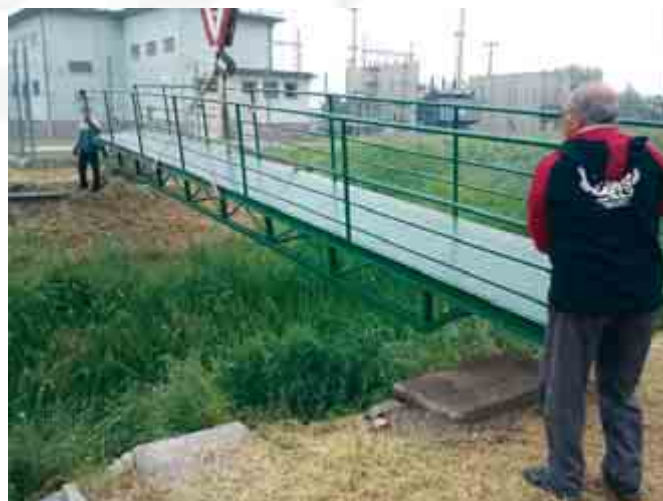
Balesetmegelőzési céllal új gyalogoshidat építettünk a Hartyán-patak fölél