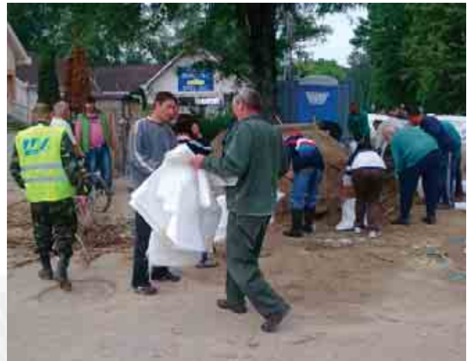
A polgármesteri hivatal is segített az árvízi védekezésben