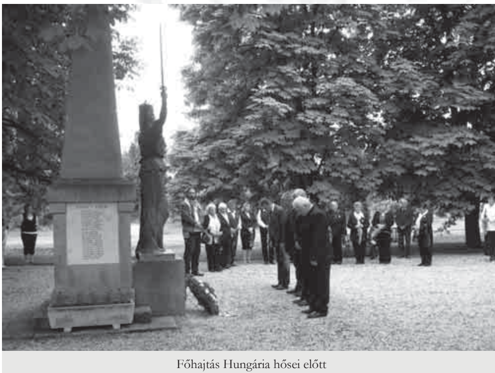
Főhajtság Hungária hősei előtt

„A nemzeti összefogás, a haza iránt érzett szeretet, és egymás méltóságának tisztelete hozhat nyugható, békés jövőt Magyarországnak számára.”