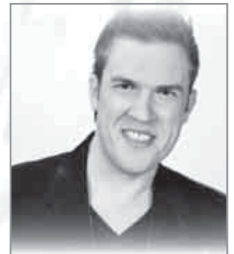
A szeptember 7-ei (szombat) falunap sztárvendége KASZA TIBOR (Crystal együttes) lesz