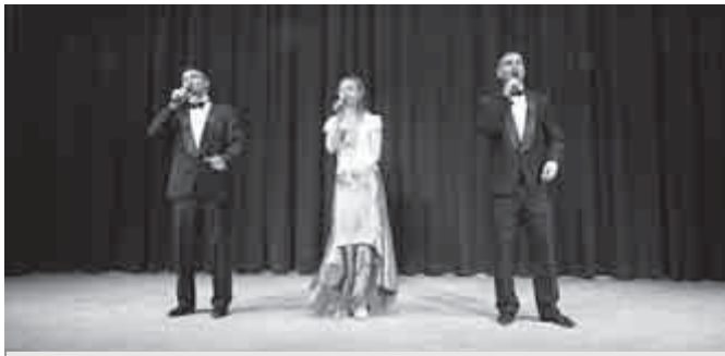
„Kellene ma éjjel egy kis hacacaré...”