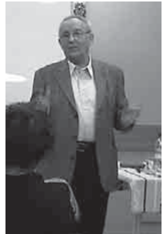
Vekerdy Tamás a szödi Faluházban

Visszaidéztük a nagy, együtt élő család életét, melyben a dédmama volt az, aki a legegyszerűbb módon nyugtatta meg síró unokáját: testi érintéssel, simogatással, duruzsolással. Amikor nem a tévé volt az eszköz, hogy a gyermek egyedül nyugtassa meg önmagát. A mese fontossága, melyet szájról szájra adunk tovább, remélem, még sokáig megmarad. Mesével a gyermek képzelete szárnyra kel, és átéli a tör-