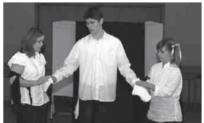
Október 23-ai ünnepség