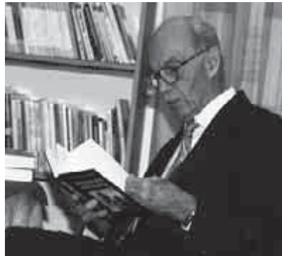
Galgóczy Árpád műfordító

Galgóczy Árpád költő, műfordító, egyike volt a Gulág