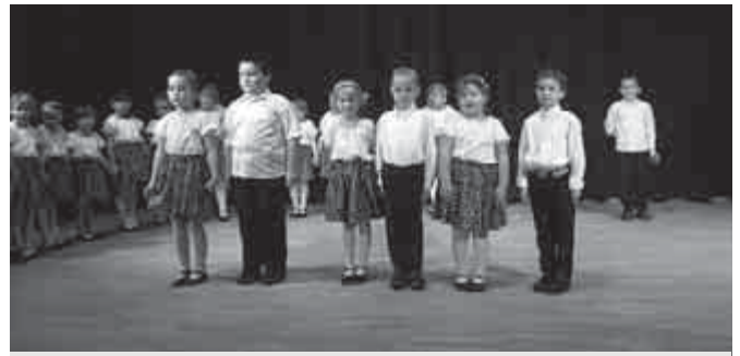
Ovisok köszöntik az időseket