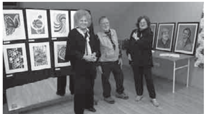
Gálosné Szűcs Emília kiállítása