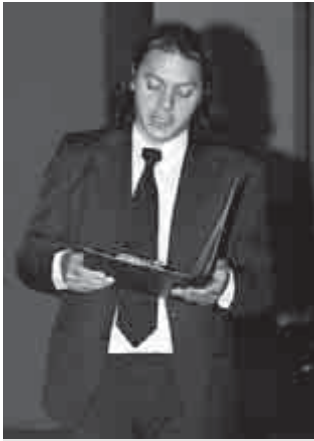
Erdélyi Balázs ünnepi beszédet mond

A szimpátia és a szeretet egyéni megnyilatkozása volt, amikor a Szovjetunióban egy orosz nő elsőszülött leányát Rákosi Mátyás után Mátyásnak nevezte el.