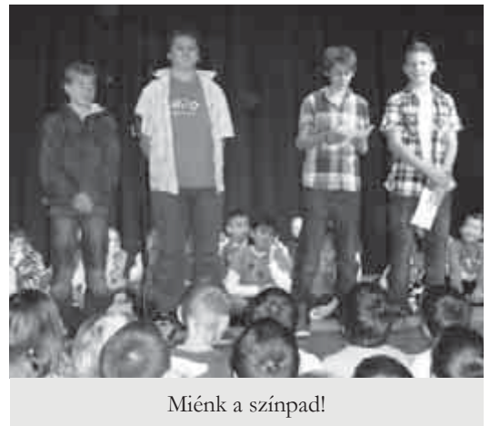
Miénk a színpad!