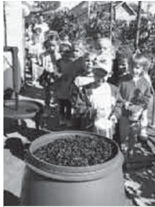
Sorban álltunk vödreinkkel

Igen meglepődtünk, mert nagyon jó gyerekek jöttek hozzánk, és nem győztünk csodálkozni régi társaink picit unokáit felismerve. Az óvó néniktől nagyon kedves, hogy arra tanítják unokáinkat, hogy „vendégségbe üres kézzel nem megyünk”, de igen megkönnyebültünk, amikor a csomagból egy kézzel készített szép ajándék került elő. Mindig örömmel tölt el, ha ránézek és eszembe jut a számunkra is felejtethetetlen, kicsit rendhagyó