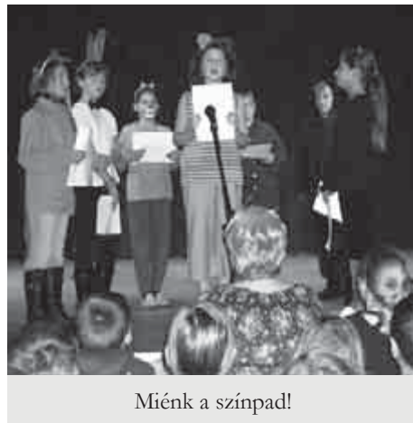
Miénk a színpad!

A minden évben hagyományosan megrendezett Miénk a színpad! idén is nagy sikert aratott mind a nézők, mind a fellépők körében. Többféle produkciót élvezhetett az igen vegyes korosztályú nézőközönség. A gyerekek izgalommal, de széles mosollyal élték bele magukat az éppen aktuá-