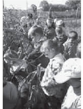
Törjük a kukoricát

Nekünk természetes, bár mégis furcsa dolog került lencsevégre... Hogyan fér meg óvodánkban a modern Lego és egy népi játék: a kukoricacső-tekerő verseny? Egyszerűen, ahogyan az a képen is látszik. Mosolygós gyerekek játszanak ezzel is, azzal is.