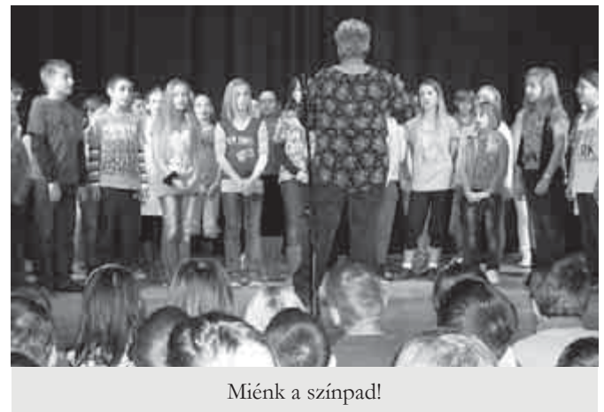
Miénk a színpad!

lis szerepükbe. Láthatunk táncot, meserészletet, poénos darabokat. Egy ilyen vicces hangvételű műsorszámmal készültek a harmadik osztályosok