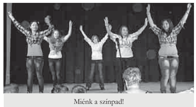
Miénk a színpad!