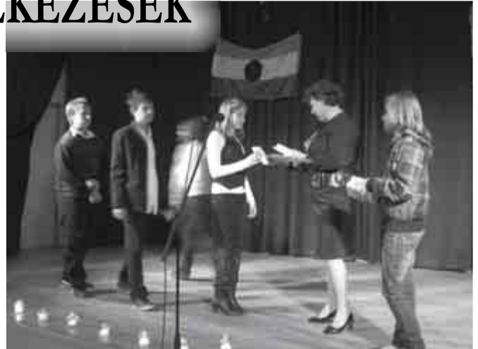
Október 23. – Megemlékezés a faluházban ↑↓