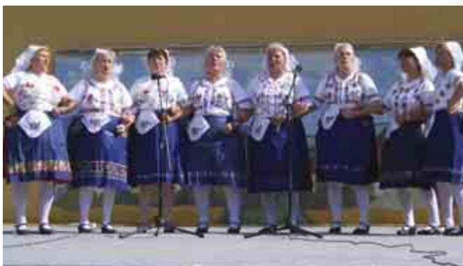
A Faluház szabadtéri színpadának a Falunapon volt a főpróbája

A 2010 novemberében átadott Faluház beváltotta a hozzáfűzött reményeket. A község lakói szívesen és rendszeresen látogatják az intézményt, klubszobái a hét minden napján foglaltak. Különböző szakörök, foglalkozások biztosítják a szabadidő hasznos eltöltését a község lakói számára.