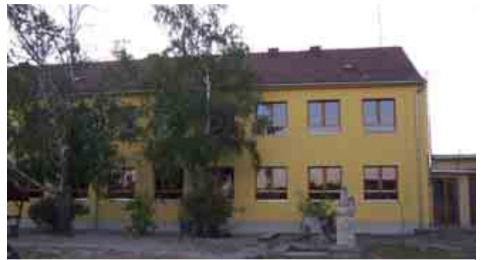
Augusztusban fejeződött be az iskola épületenergetikai korszerűsítése

A képviselő-testület energetikai pályázat benyújtása mellett döntött annak érdekében, hogy az intézményeink villamos energia költségét csökkentse napelemek felszerelésével. A pályázatíróval egyeztetünk, és végül úgy döntöttünk,