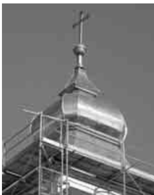
A képviselő-testület szorgalmazta a kupola rézborítását