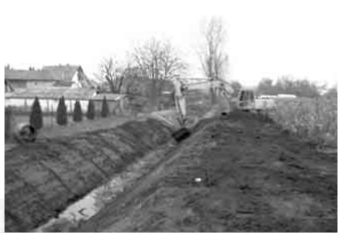
Jól halad a Tece-patak rekonstrukciója