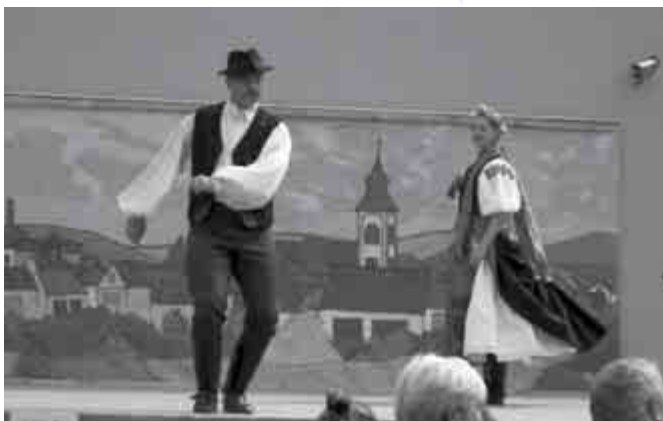
A támogatott helyi szervezetek részvételével zajlott a Falunap

A képviselő-testület 2011. november 24. napján megtartott képviselő-testületi ülésén tárgyalta meg a 2012. évi költségvetési koncepciót. Az előző évekhez hasonlóan legfontosabb feladatának az önkormányzat intézményeinek zavartalan működését tartja, és ennek figyelembevételével alapította meg fejlesztési elképzeléseit.