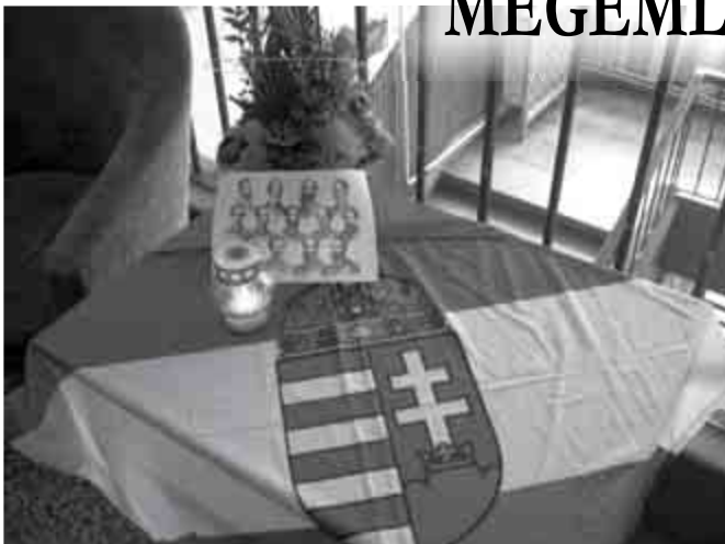
↑↓ Október 6. – Iskolai megemlékezés