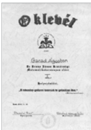
Garad Ágoston oklevele