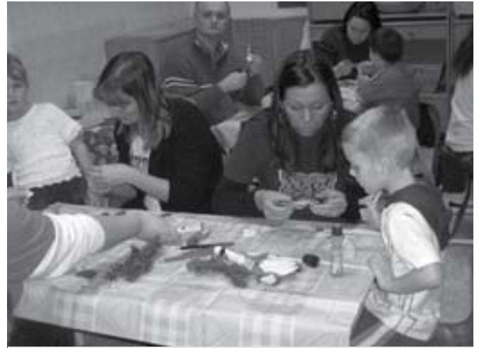
A közös „munka” öröme

Nagyon kíváncsi vagyok, hogy farsang előtt mit készítettünk majd.