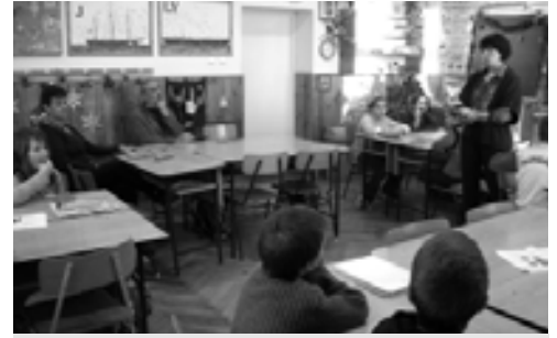
IPR tanácsadó az iskolában