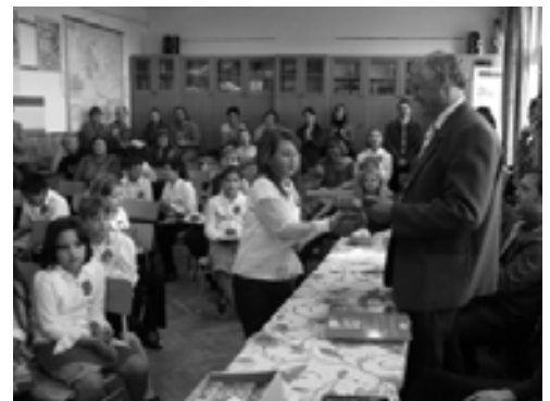
Mindenki kapott jutalmat