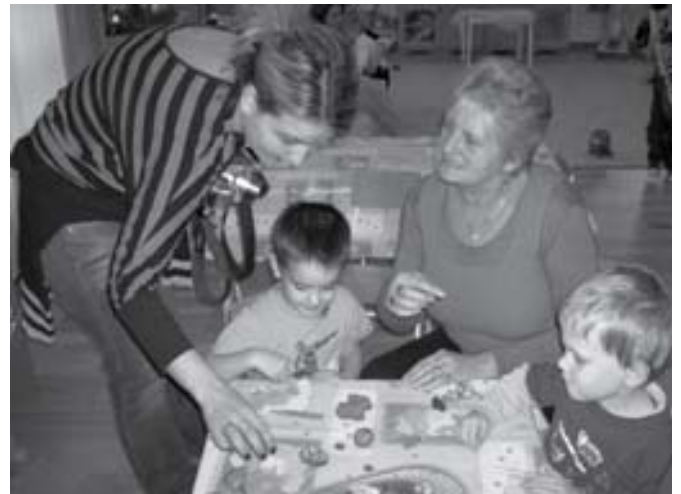
Több szem többet lát