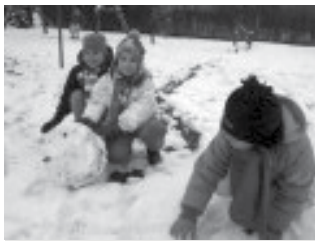
Vörös az orra, a füle ég...

De puba a fehér dunna bói! Még felborolni is jaj de jó! Vörös az orra, a füle ég, Szuszog a Jankó, de húzza még.