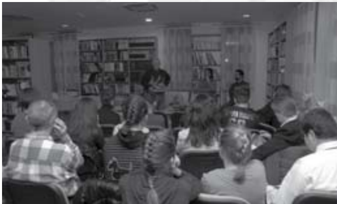
Művészek és műkedvelők az új könyvtárban

Köszönet a tanároknak, kik fellelkesítették diákjaikat, s így talán egy kicsit közelebb kerülhettek azokhoz a emberekhez, akik munkásságát csak tankönyvekből ismerhetik.