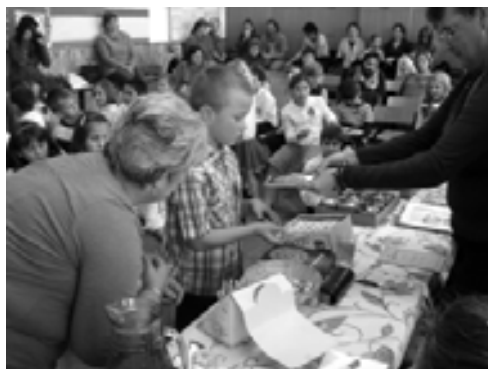
A zsűri értékelése