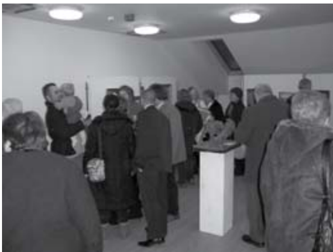
Az érdeklődővel megtelt az alkalmi kiállítóterem