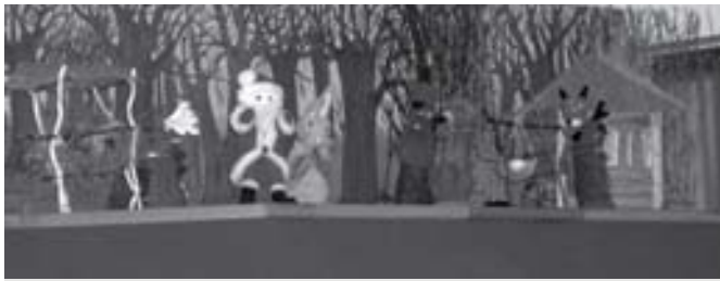
Csengőszóval, rénszarvas húzta szánon érkezett...

Az óvónői bábcsoport egy új mikulásos mesével kedveskedett az ünnep alkalmából.