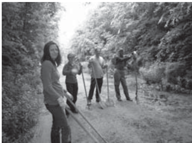
A résztvevők egy kisebb csoportja