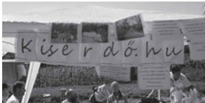
Kiserdő.hu lesz az egyesület neve

A www.szod.hu weboldalon folyamatosan tájékoztatjuk az érdeklődőket munkánkról, az egyesületi tagság lehetőségéről, valamint a www.kiserdo.hu weboldal elkészültéről.