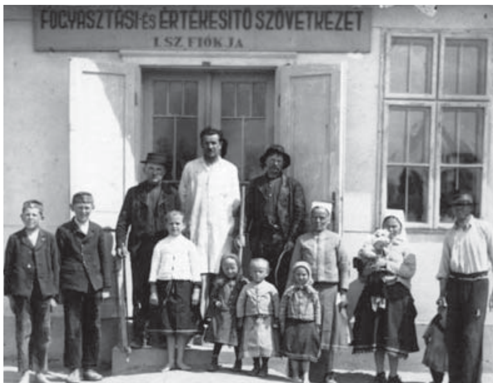
Fogyasztási és Értékesítő Szövetkezet I. sz. Fiókja

A korábban létezett szódi kocsmákkal kapcsolatban meg kell említeni a Juscsák-