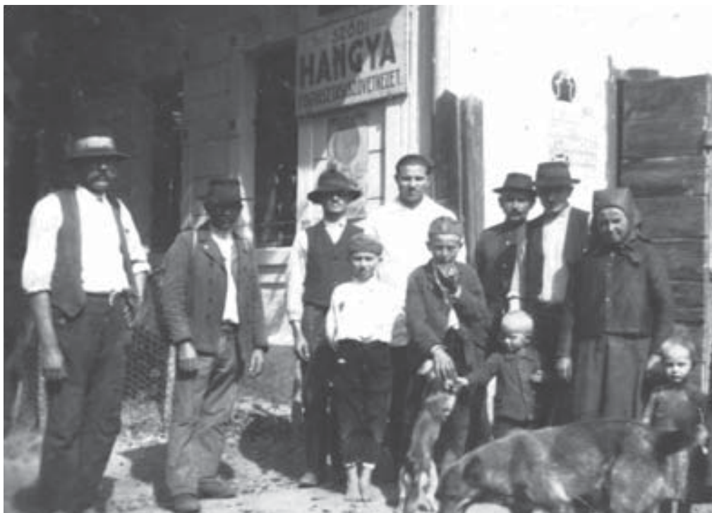
Szódi Hangya Fogyasztási Szövetkezet – bor, sör, pálinka