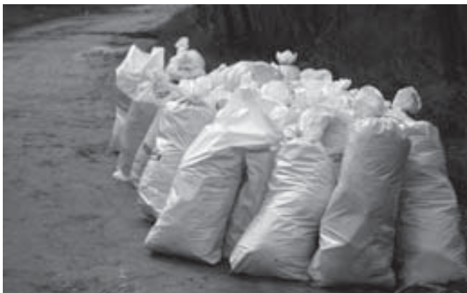
A szemétszüret eredménye