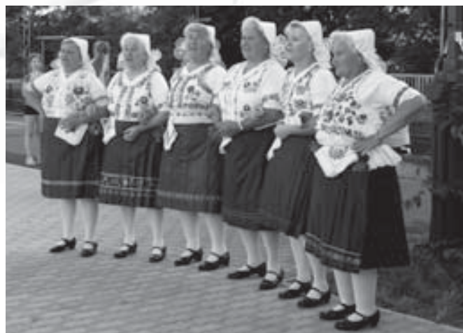
Az ünnepségen felléptek a sződi hagyományörzők is

Váci M. utca 29. Mártírok utca 31. Rátóti utca 11. Tél utca Rátóti utca 13.