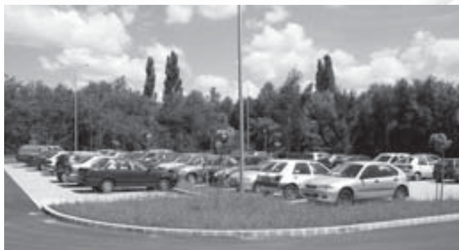
A parkoló megépülésével régi óhaj vált valóra