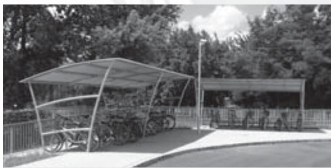
Fedett kerékpártároló is készült