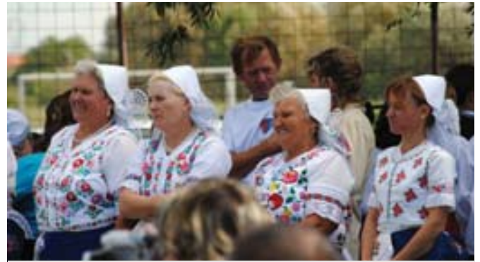
A Szódi Hagyományörző Klub közösségi díjat vehetett át