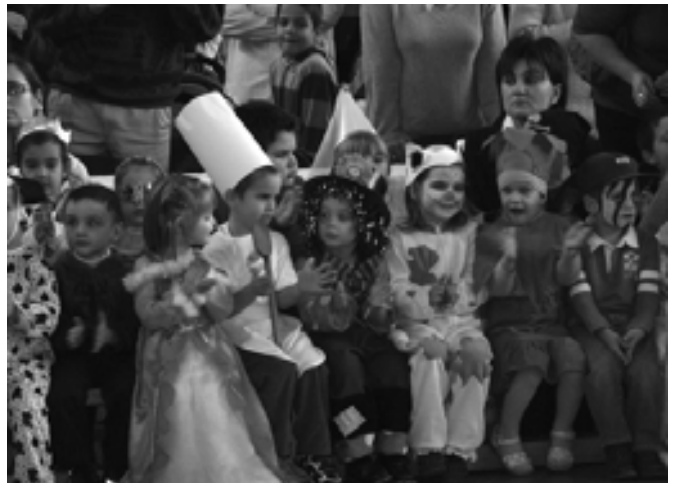
📍 Vígsg legyen! 📍