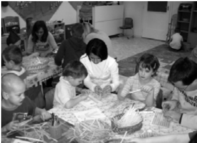
📍 Egy asztalnál dolgozott gyerekek és szülő 📍