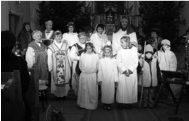
A karácsonykor bemutatott pásztorjáték szereplői