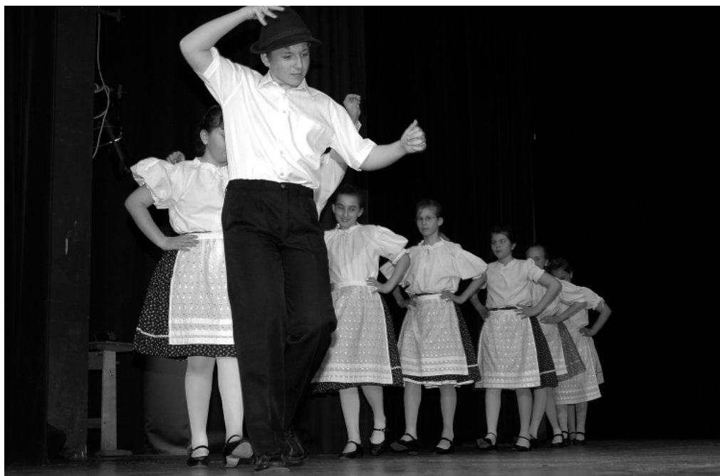
A Kiszelica Táncsoport tagjai