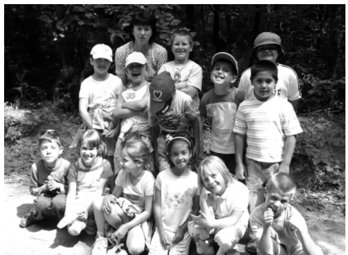
Mosolyalbum első módra