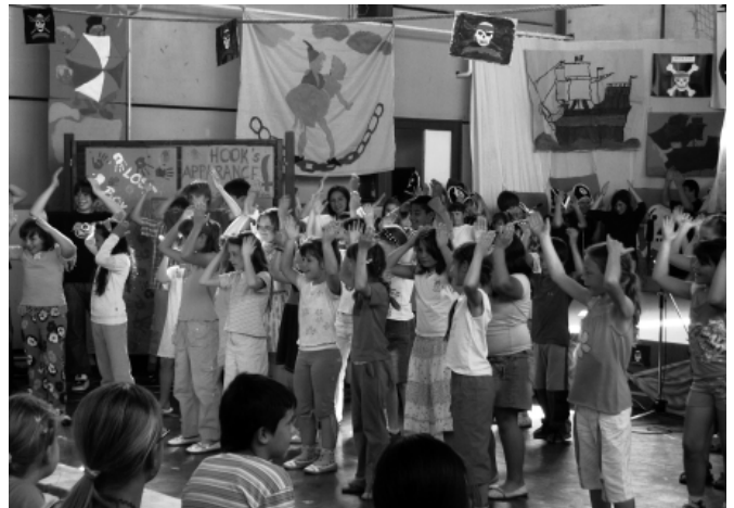
Gyermekek táncjátéka – angolul

GREASE TÁNC-SPORT EGYESÜLET SZÓDI KISZELICA VÁCI FORMA SE – DYNAMIC TÁNCSTÚDÍÓ BOLERO TÁNCSPORT EGYESÜLET VADRÓZSÁK NÉPTÁNCGYŰTTES AMARO KHELYPO CSŐRÖGI TÁNCSPORT HACACÁRÉ -ISKOLÁNK AEROBIKOSAI ELTE BTK, HÍSSASSAA NÉPTÁNCGYŰTTES LIPA SZLOVÁK FOLKLÓR EGYESÜLET DÉZSI YVETT TÁNCISKOLA SZÓDI SZITA TÁNCGYŰTTES