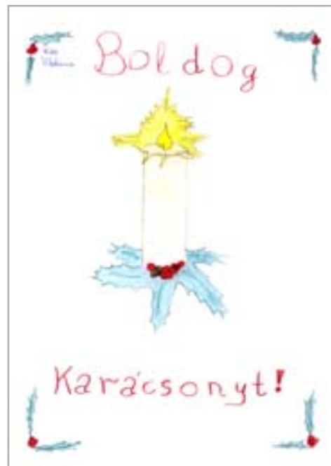
Kiss Viktória rajza