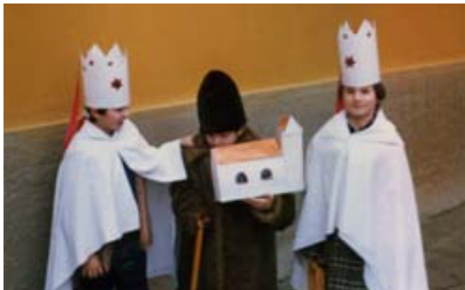
Betlehemezők a plébánia udvarán az 1980-as évek végén

Karácsony előtt két héttel elkezdték járni a falut a betlehemesek. A köszöntőket szívesen látta család, sőt még hívták is, ha még nem jártak náluk. A betlehemes fiúk négyen, öten voltak. Bundába, csákóba öltöztek, és köszöntés közben csörgő bottal verték a szoba földjét. Magukkal hozták a kis Jézust a betlehemi házikóban. A karácsonyi szent énekek eléneklése után bőséget, békességet kívántak a ház népének. A köszöntésért diót, almát kaptak. A kántálás is igen régi kedves szokás volt. Három, négy gyermek összefogott, és az ünnepi vacsora után elindultak a szomszédok ablaka alá kántálni. Ezt a kis versikét mondták (szlovákul fonetikusán és magyarul):