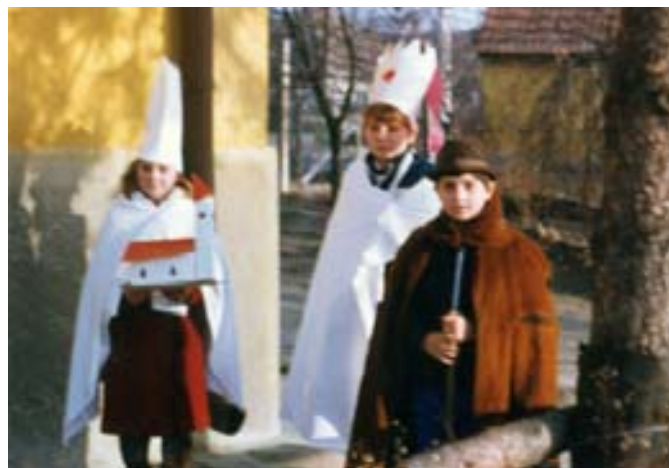
Betlehemezők a plébánia udvarán az 1980-as évek végén

December 25-e olyan nagy ünnep volt, hogy ilyenkor nem volt szokás elmenni ott-