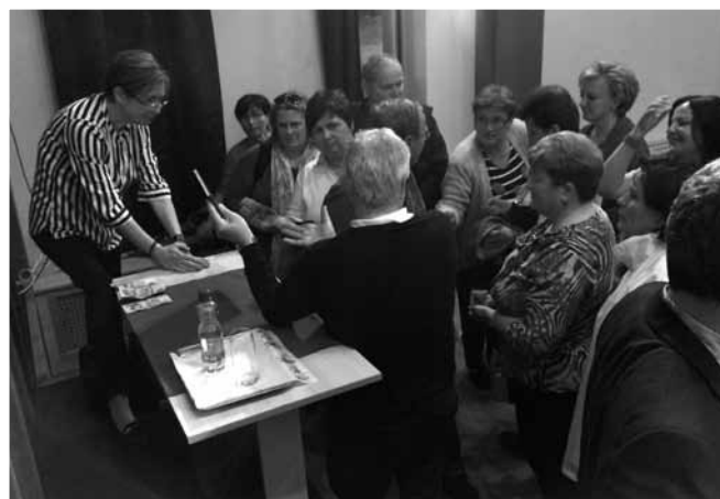
Nagy az érdeklődés