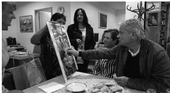
Ajándék az előadónak