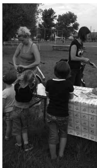
Készülnek az arccsókák és a lufi nyuszik