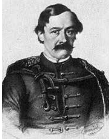
Széki gróf Teleki László (Pest, 1811. február 11 – 1861. május 7.) Magyarország párizsi követe, író Szászországból elhurcolták.