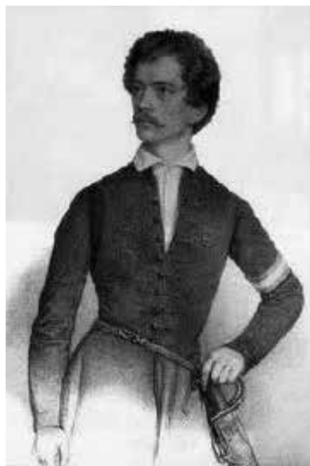
Petőfi Sándor nemzetőrként

Petőfi Sándor barátja gróf széki Teleki Sándor kastélyában Koltón