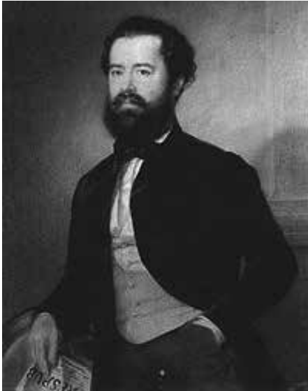
Szemerei Szemere Bertalan (Vatta, 1812. augusztus 27. – Pest, 1869. január 18.) Belügyminiszter, Magyarország miniszterelnöke. Távollétében halálra ítélték.