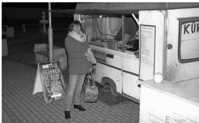
Székely kalács a Faluház előtt