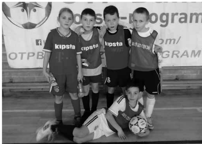
A II. osztályos gárda nem kímélte az ellenfelet...

Vácon, a Piarista Gimnázium tornacsarnokában az I., II. és IV. korcsoportos csapatok a megbeszélés alapján kreatív támadófutballt játszottak, váratlan és sikeres megoldásoknak is köszönhetjük a győzelmeiket.