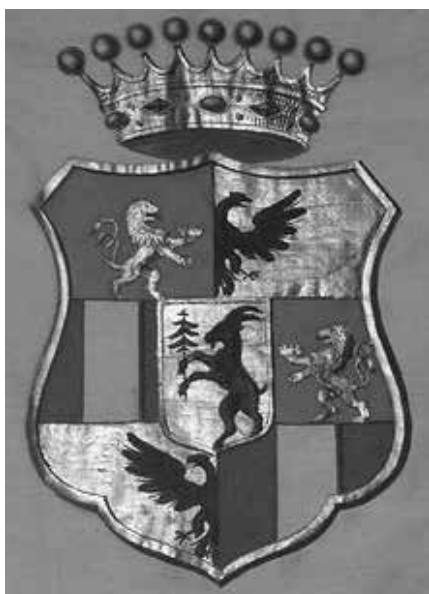
gróf széki Teleki címer

Petőfi Sándor barátja gróf széki Teleki Sándor kastélyában Koltón