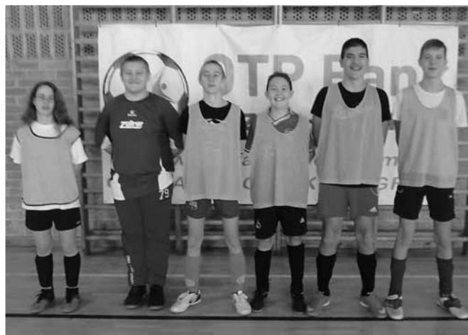
A IV. korcsoportos ezüstérmes csapat

A téli bajnokságon, az első fordulón gyenge játékot produkáltunk. Azonban a második fordulón a lányok kitétek magukért, megmutatták, hogy fociból kitűnőek és tudásuk legjavát adva dolgoztak meg a sikerért.