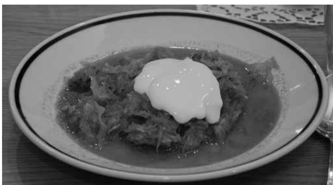
Székely káposzta nagyon finoman