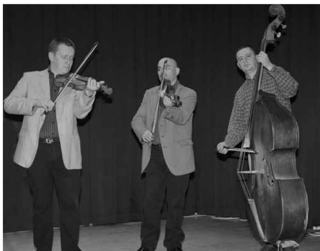
Fix Stimm zenekar