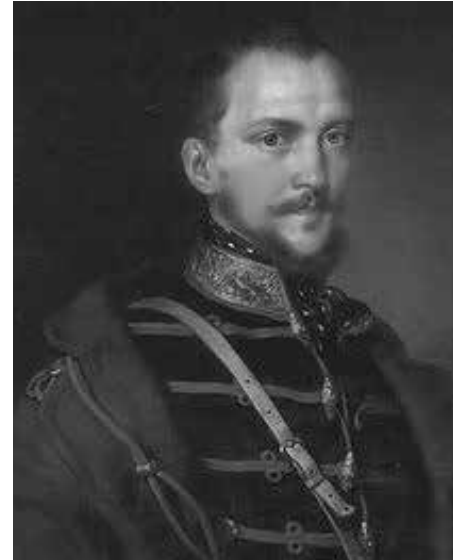
Görgői és toporczy Görgey Artúr (Toporc, 1818. január 30. – Budapest, 1916. május 21.) Honvédtábornok, a honvédsereg fővezére. Száműzték Ausztriába.