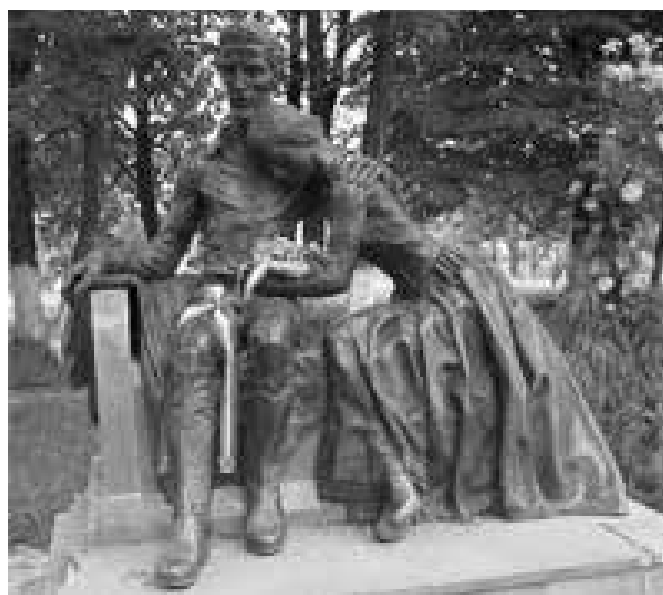
Petőfi Sándor és Szendrey Júlia Koltón