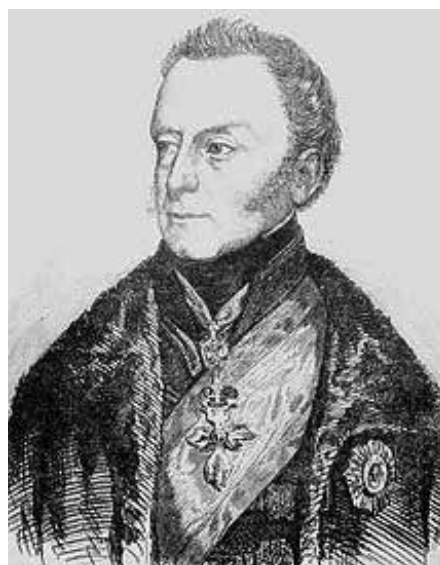
Galánthai herceg Esterházy Pál Antal (1786. március 11. – Regensburg, 1866. május 21.) A király személye körüli miniszter. Visszavonult a politikától.