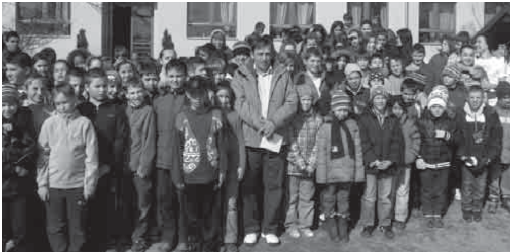
Búcsúznak, Tanár Úr

dolom, méltón búcsúztunk Tőle kollégák és munkatársak - és természetesen tanítványai. (A képeken is ez látható.)