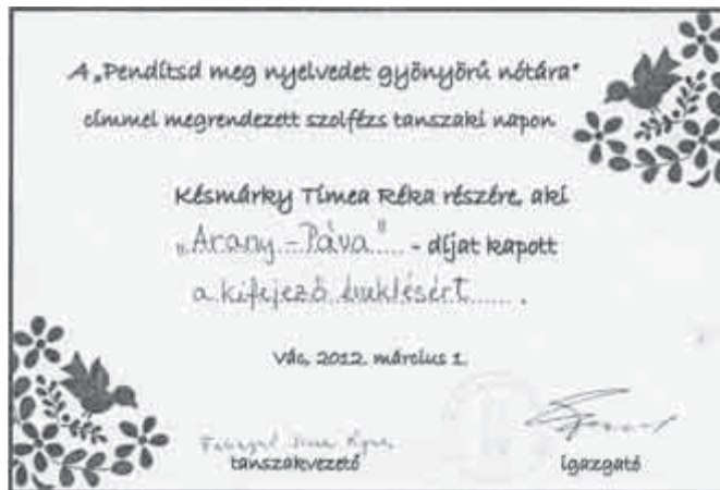
Az Arany-Páva-díjak és tulajdonosaik