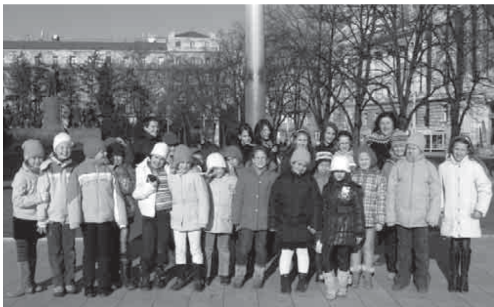
Látogatás a Parlamentbe

Az estét egy pár perces salsa-bemutató nyitotta meg. A zenét DJ MÁRK szolgáltatta.