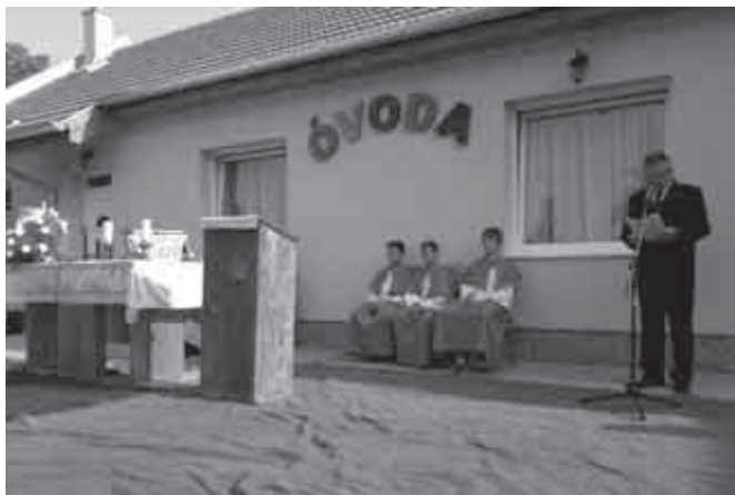
Keszeg község új óvodájának átadásán

Jó, hogy a beszoktatás ennyire könnyen és gördülékenyen zajlott, pedig nagy lépés ez egy kisgyereknek, aki először lép ki az óvó és védő családi környezetből. Nehéz ez nekünk anyukáknak is, hiszen el kell válnunk az egyik legfontosabb személytől az életünkben és más gondjaira kell bízni. Tudom, sok anyuka lép ki könnyes szemmel, aggód-