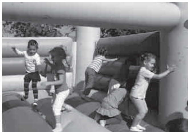
A megunhatatlan ugrálóvár

Vidáman kezdődik az idei tanév is óvodánkban, hiszen hétfő reggel már akkumulátoros motorokkal roboghattak gyermekeink a fészekhinta körül. Bár az arcfestésnél kigyózó sorok álltak, mégis mindenki türelmesen várakozott. Per-