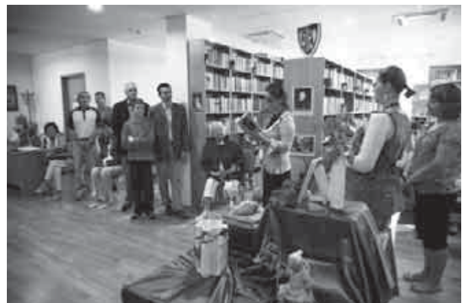
Dominika versei hangot kapnak

A Falunap képeit az újság színes hátsó borítóján tekinthetik meg.