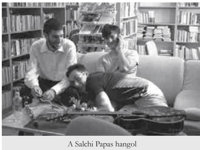
A Salchi Papas hangol