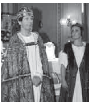
„Uram add, hogy nyugalom, béke legyen ebben az országban!”