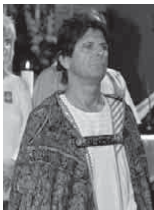
„Az ember Isten segítségét egy életre kérje!”