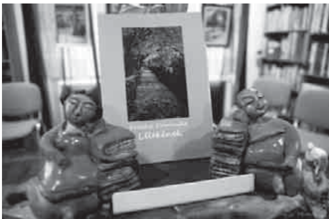
Frappáns kötet cím