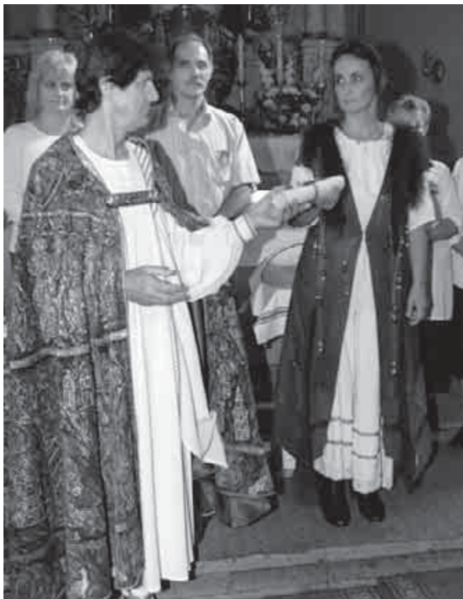
„Ne haljanak a költők, mindig szóljon az ének!”