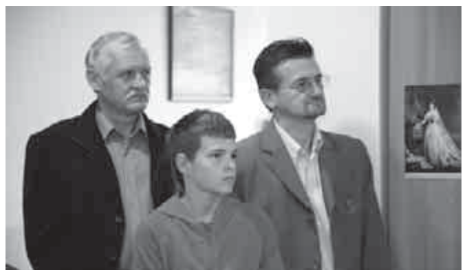
Érdeklődés a Lélekének iránt