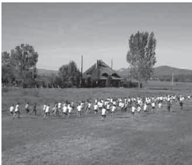
Az óvodások 200 méterrel indulhattak

(További képek a hátsó belső borítón találhatóak, a 27. oldalon.)