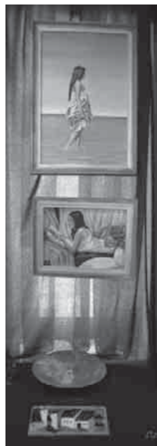
A Kalmár család néhány értéke