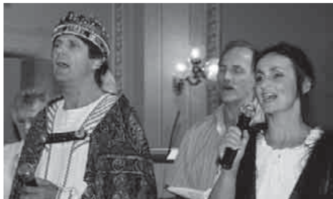
„Világok világa, Magyarország!”