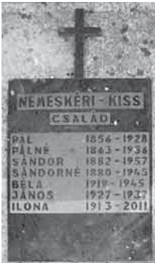
A szódi Nemeskéri-sírhely