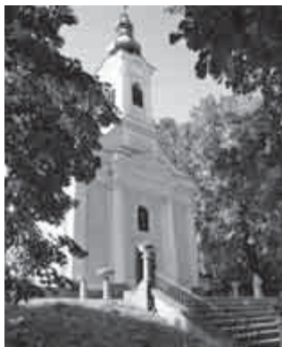
A templom napjainkban

Általában a litánia után mentek haza, de ez már 1988-ban érdektelenség miatt elmaradt,