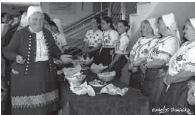
Ízlik a szódi kapusznik