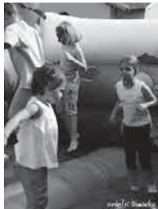
Ha végre itt a nyár

Eközben a focipályán már javában zajlottak az izgalmasabb programok. A futballpálya egyik felét a labdarúgók foglalták el, akik korosztály szerint rövidített meccseket játszottak egy-