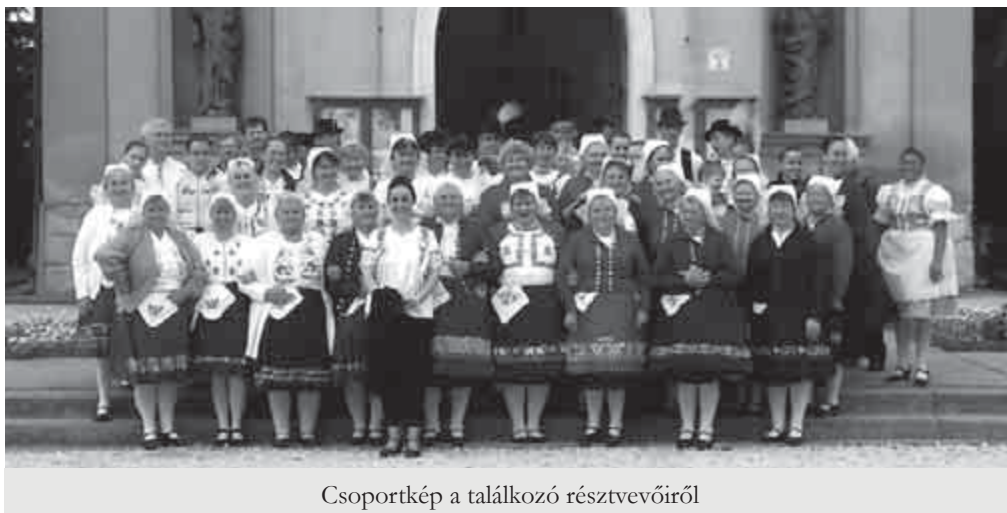
Csoportkép a találkozó résztvevőiről

szlovák illetve magyar nyelven tartott ünnepi beszédet.