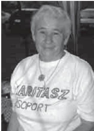
Egy mosoly – egy zsíroskenyér

lönféle ügyességi feladatokba. Bohóchoz méltón mindezt nagyon humorosan tette (ld. a címlapon).