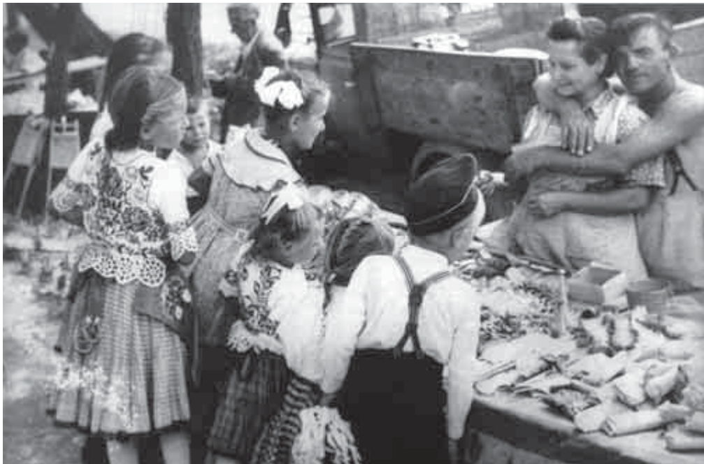
Ilyen volt a szódi „búcsú” 1951-ben