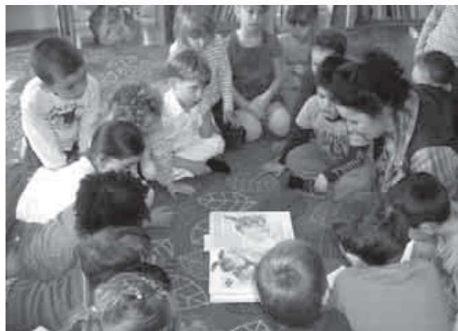
Feszült a figyelem