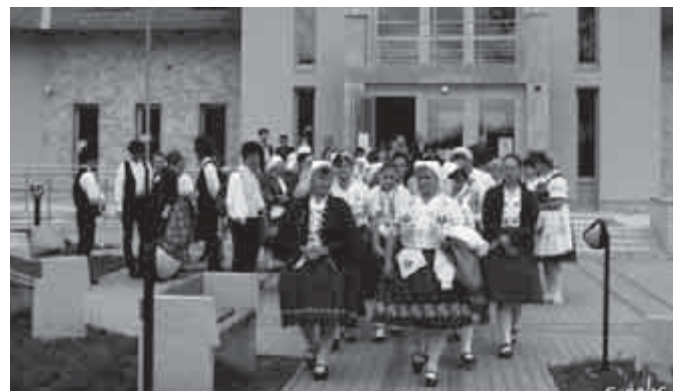
Indul a menet a plébániára