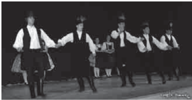
Isaszegi Csata Táncegyüttes