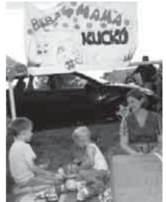
Baba-Mama Kuckó a gyermeknapon