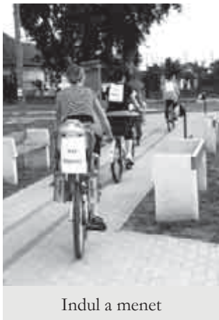
Indul a menet

A drogellenes biciklis menet május 25-én, pénteken 18 órakor indult a Faluház elől.