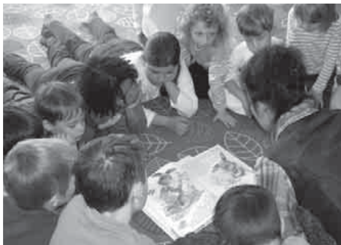
Márti néni történetei

Továbbra is szeretettel várjuk utazni szerető és úti élményeiket megosztó családok, egyének jelentkezését, akik szóbeli vagy fényképes élménybeszámolót tartanak az érdeklődőknek!