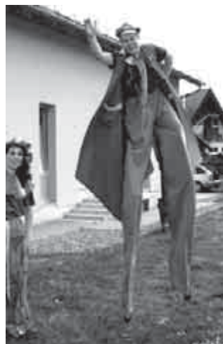
Innen főntről a felnőtt is gyerek