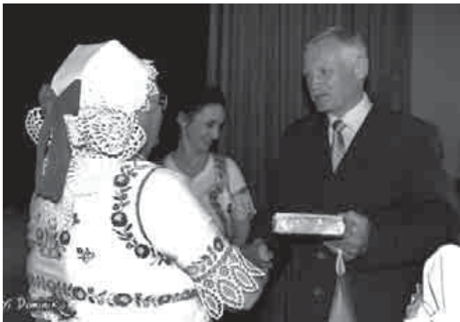
A polgármester úr ajándékoz