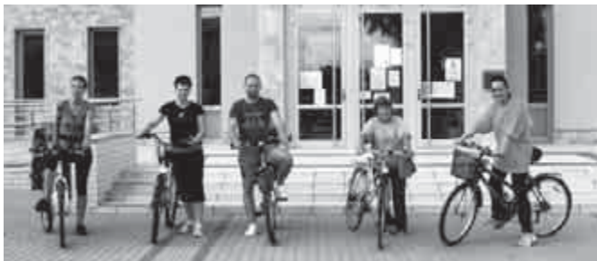
No Drog! – Startra készen

és más hivatalos szervek, továbbá néhány tiszteletreméltó egyén megszállott munkájára hagyatkozunk. A civil társadalom és minden egyes ember ügye, hogy megóvjuk jövőnket a drogok terjedésétől.