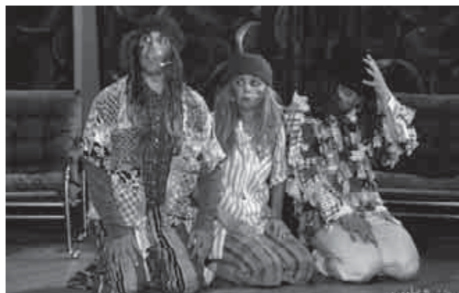
Jónak lenni jó