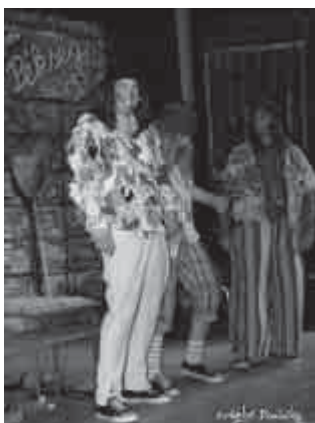
„A három rabló”

A gyereknep végét a gólyalábas produkció zárta, ami csaknem egy órára sikeredett, a gyerkőcök nagy öröme. A gólyalábas bohóc sok játékkal szórakoztatta a közönséget és ügyesen becsalogatta a nagyobbakat, anyukákat, apukákat is a kötélhúzásba és a kü-