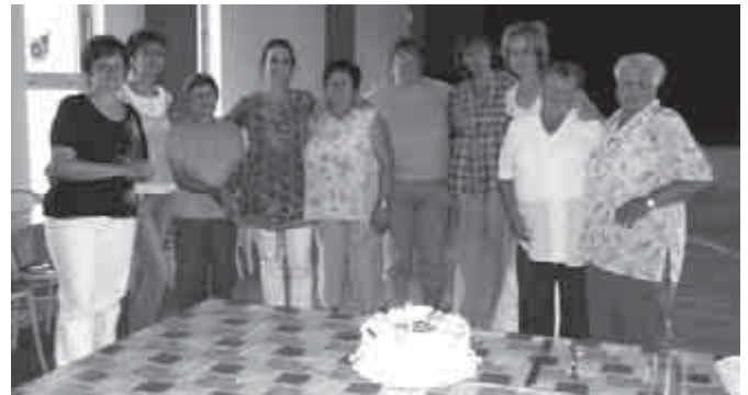
Asszonyok a bálban

zösséget Sződön, nevezetesen a Sződi Asszonyok Társaságát! E társaság minden hónapban egyszer, megbeszélt időpontban találkozik és különböző, nőket érintő dolgokról tanácskozik: gyermeknevelés, egészség, tanulás, szabadidős foglalkozás, munkahelyi problémák, illetve örömök, kulináris fortélyok, szépség, kozmetika, életmód, kultúra, művészet, sport stb. Szeretettel várunk még több hölgyet a társaságba!