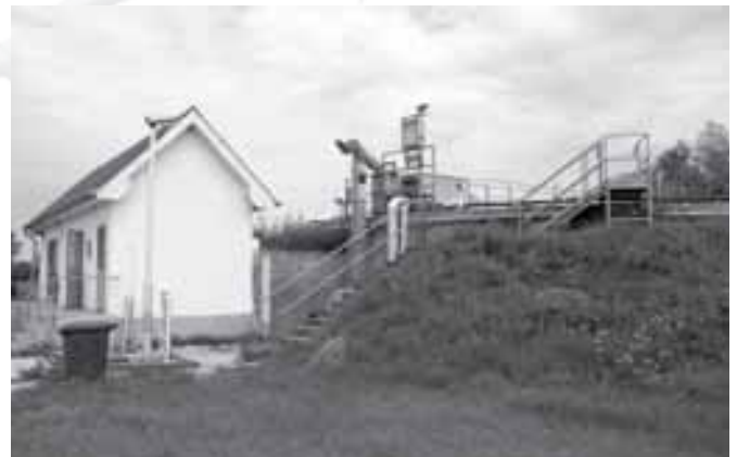
A szennyvíztisztító marad!