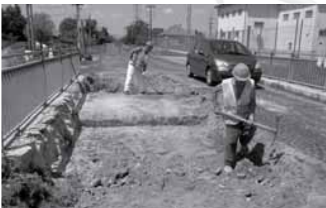
A híd szerkezete 1941-ben épült

A csörögi hulladéklerakó 2009 júniusában zárt be, többek között azért, mert nem felelt meg az uniós normáknak. Önkormányzatunk tagja az Észak-kelet Pest és Nógrád Megyei Regionális Hulladékgazdál- kodási és Környezetvédelmi Önkormányzati Társulásnak. A szervezet 2009 júniusában tervezte a kerepesi hullá- déklerakó átadását. Sajnos a munkálatok elhúzódtak, így a csörögi hulladéklerakó bezá- rása után – valószínűleg 2010 elejéig – nem tudja fogadni a kommunális hulladékot.