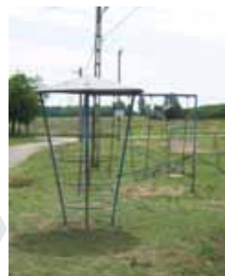
Több és modernebb játszótér lesz

A képviselő-testület célja három játszótér kialakítása községünkben. Az egyiket a település egyik végén, a két híd között, a másikat a túlsó végén, a Rét utca jelenleg is játszótérként működő részén építtetnénk meg. Ezekre inkább a kisebb gyermekeknek szóló játékok kerülnek. A harmadik – amelynek kialakításához pályázati forrásokat is igénybe szeretnének venni – a település központjában, a butiksor mögötti területen épülne, és több korosztály is tudná használni. A két kisebb játszóteret az uniós normáknak megfelelően saját erőből építjük meg, még ebben az évben. A terveket és