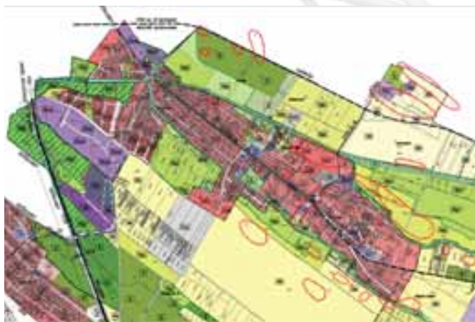
Elkészült a Rendezési Terv