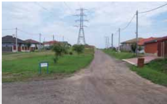
Pályázunk a Szent István út és bekötőútjainak aszfaltozására

Szöd Község Rendezési Tervéről és a Helyi Építési Szabályzatról bővebb információt