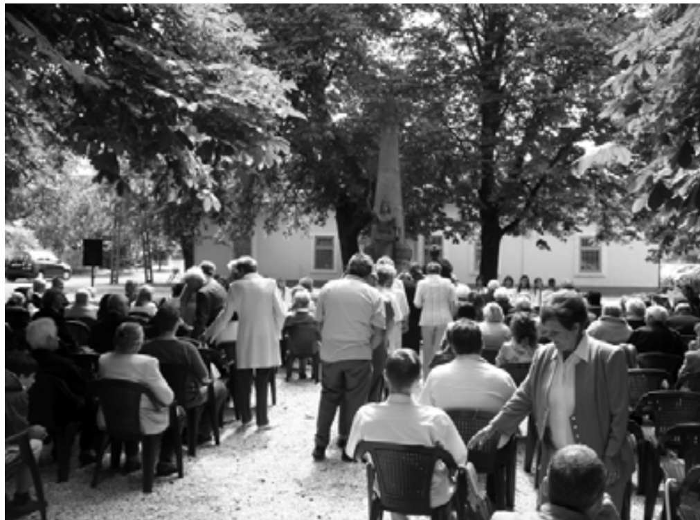
Az árnyas tér alkalmas nyári ünnepségek, esküvők megrendezésére is

Az 1924. évi XIV. törvényekben szabályozták a hősök emlékünnepeinek megrendezését. Ekkor országos mozgalom indult, és szinte minden faluban kőbe vésték az elesettek nevét. Május utolsó vasárnapja, a Hősök Napja, egyik legbensőségesebb ünnepnapjává vált a gyermekeiket elvesztő anyáknak, a férjeiket sirató feleségeknek, apjukat felidéző árváknak, bajtársaikra emlékező katonatársaknak. A második világháborút követően a hazáért életüket áldozó hősök megünneplését kiterjesztették az 1938. után elesettekre is. A diktatúra évtizedeiben kiesett hivatalos ünnepeink sorából, de nem került teljesen a feledés homályába.