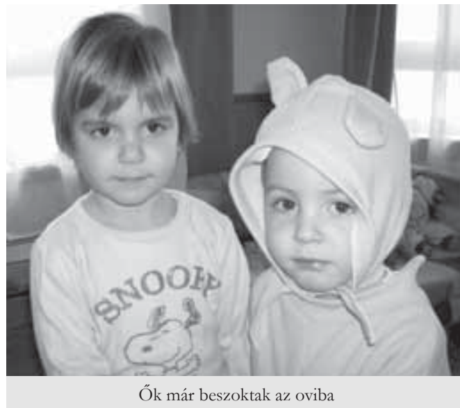
Ők már beszkottak az oviba

Épp hogy a világra jövünk, és máris azon töpreng a családi tanács, hogy „milyen és melyik óvodába kerüljön a gyerek”? Esetleg válasszák a tagozatos ovit, vagy valamilyen alternatív pedagógia szemléletű óvodát? Esetleg a hagyományos verziót? Netalán a magánovi az, amely a legjobban kielégítené a család és a gyermek igényét? Válasszák bármelyiket, a gyermek szülőitől való elválása, elválása ugyanakkora fájdalmat