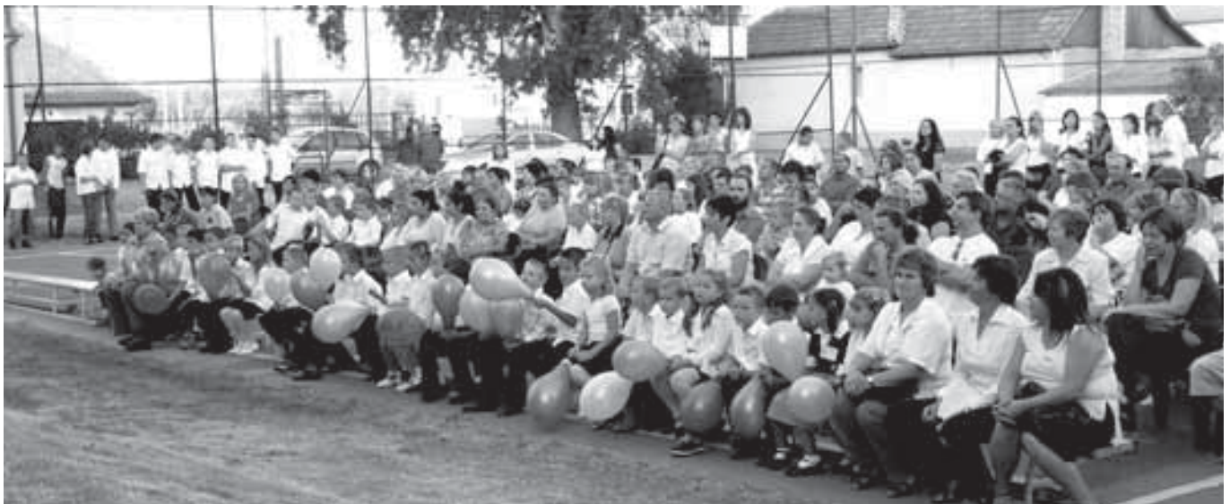
Az első osztályosok

Azt ne felejtsetek el, hogy a kincsvadászat alatt az útról letérni nem szabad! Ha fáradt vagy, akkor lassíthatsz, de a tudáshoz vezető utat semmilyen körülmények között nem lehet elhagyni, mert eltévedsz. Jönnek a gonosz szellemek, akik az szeretnék, hogy eltévedj. Egyet megnevezek közülük, úgy hívják, hogy lustaság. Szót