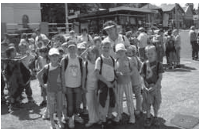
A visegrádi kikötőben